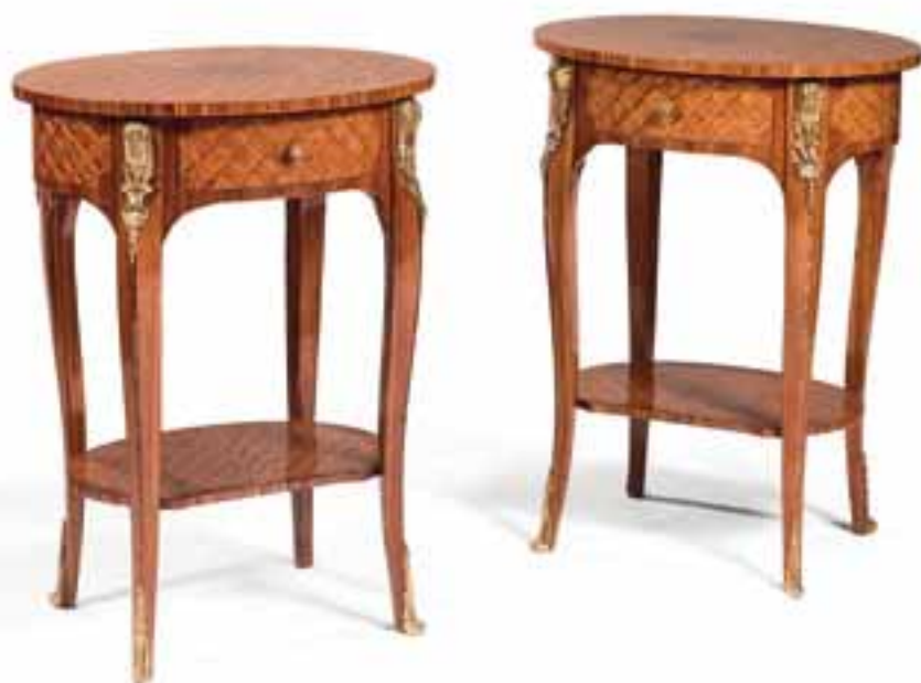
201 PAIRE DE TABLES VIDE-POCHES

Bois plaqué, marqueté de croisillons, le plateau ovale ouvrant par un tiroir, posant sur quatre pieds cambrés, réunis par un plateau incurvé.