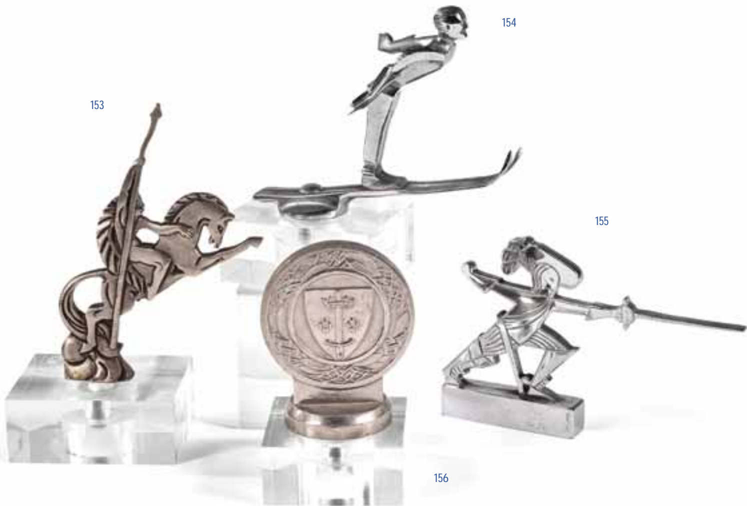
153 BINMORAN MASCOTTE AUTOMOBILE

Bronze argenté, figurant un chef indien à cheval. Signée. Hauteur : 15 cm. Montée sur socle en plexiglass.