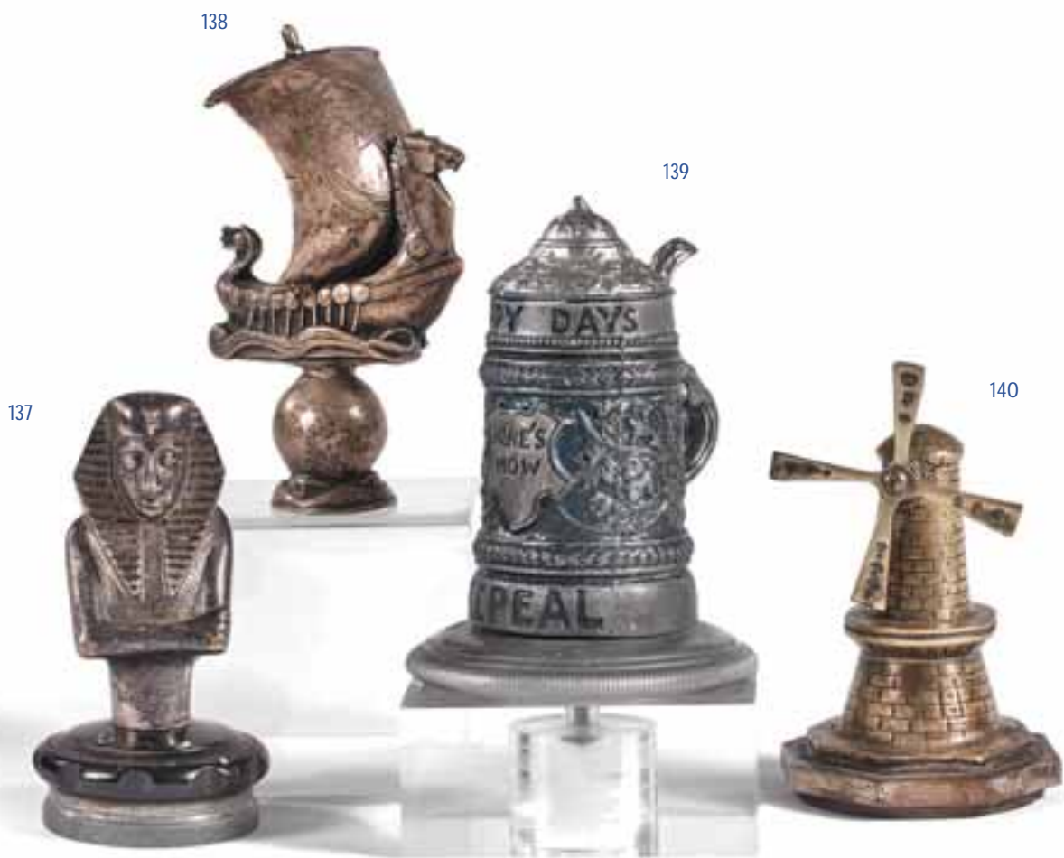
137 RENÉ & JEAN SERTORIO MASCOTTE AUTOMOBILE

Bronze argenté, figurant un buste de pharaon. Signée. Hauteur : 9 cm. Montée sur bouchon de radiateur.