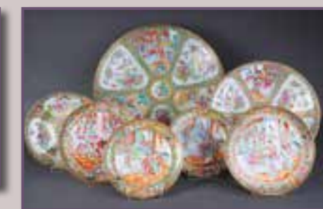
Canton, XIX et XX ème siècles.