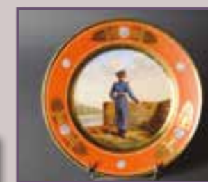
NAST à Paris.