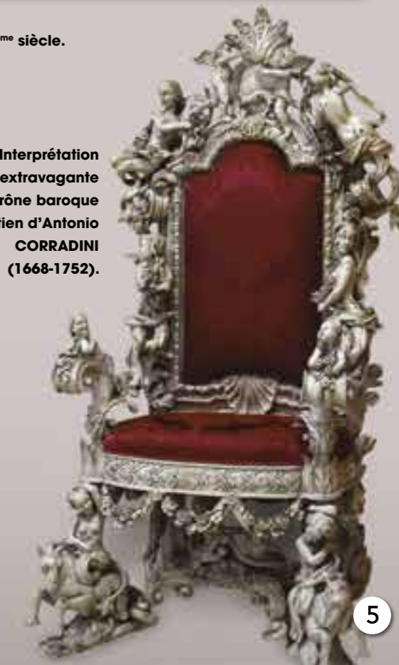
Interprétation extravagante du trône baroque vénitien d'Antonio CORRADINI (1668-1752).