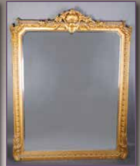
Miroir en bois et stuc doré. Dim. 156 x 126 cm.