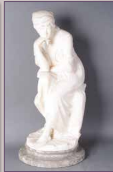
Sculpture en marbre. XIX ème siècle. Haut. 67 cm.