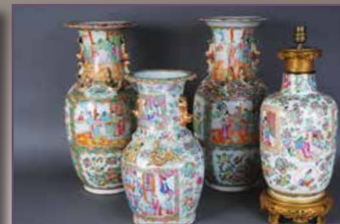
Canton, XIX ème siècle.