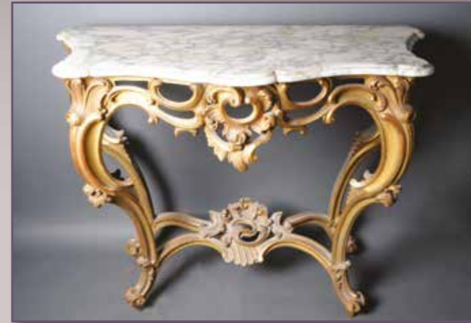
Console dessus marbre et bois doré. Style Louis XV. 107 x 57 x 91 cm.