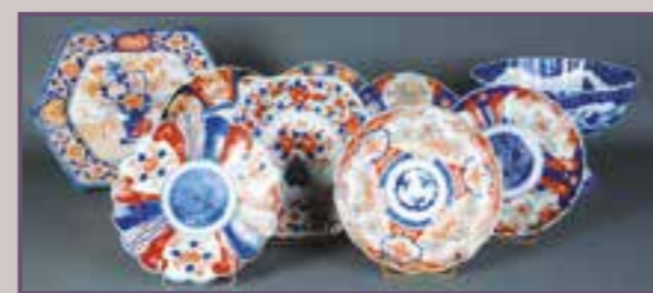
Imari, XIX et XX ème siècle.