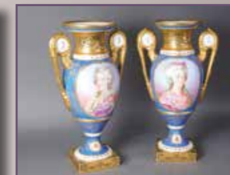
Paire de vases en porcelaine de Sèvres. Haut. 46 cm.