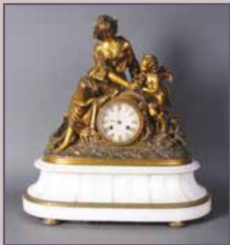
Pendule bronze et marbre. Haut. 52 cm.