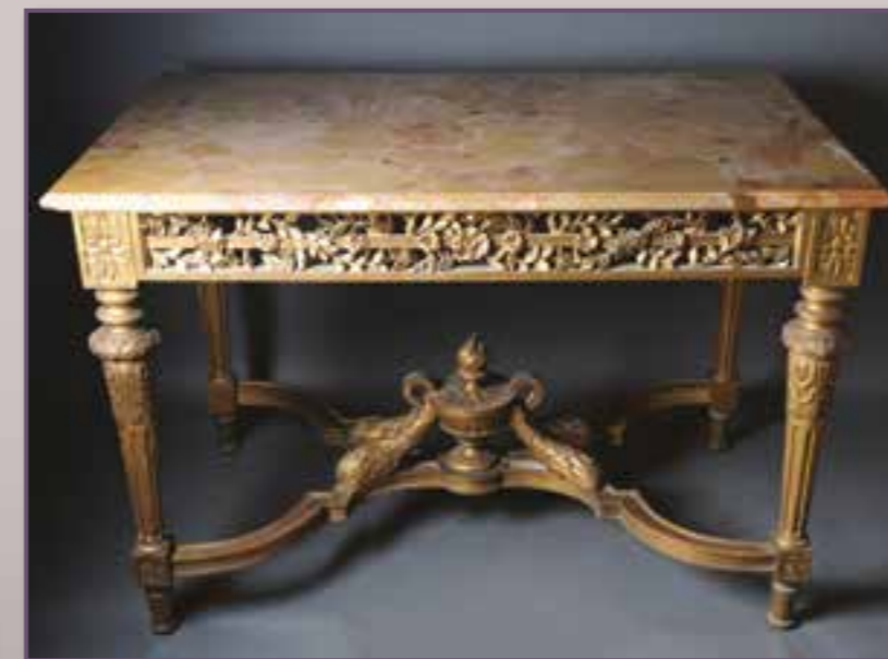
Console bois doré. 110 x 65 x 75 cm.