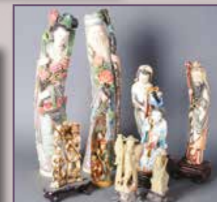
Chine, XIX ème siècle.