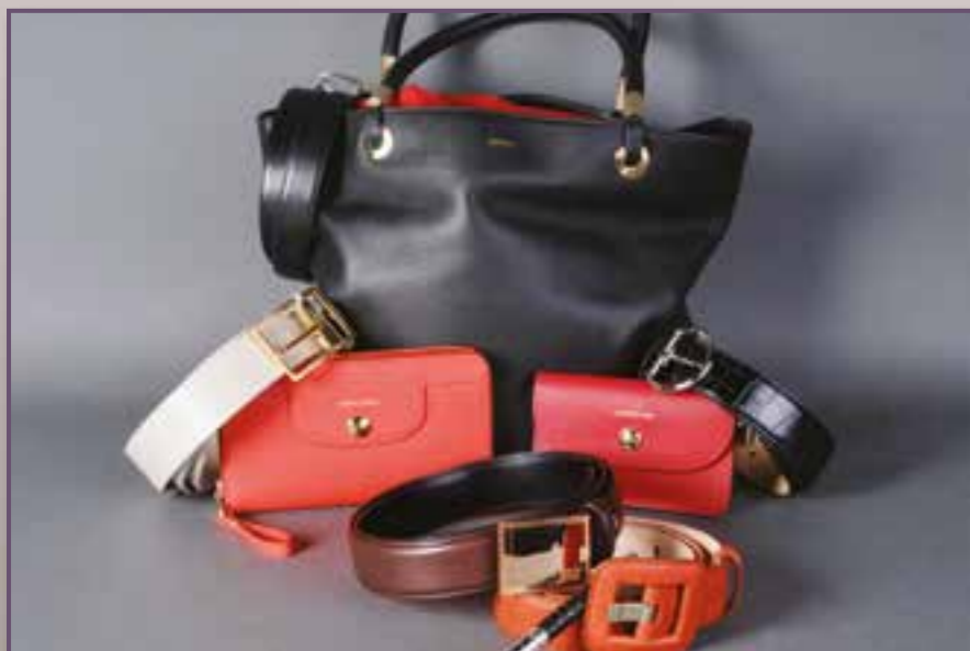
Maroquinerie marques de luxe (Longchamp, Lancel, ...).