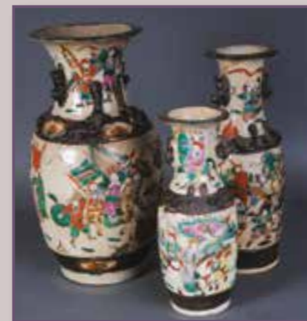
Chine, début XX ème siècle.