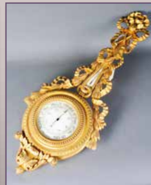
Baromètre et thermomètre en bois doré. Haut. 99 cm.