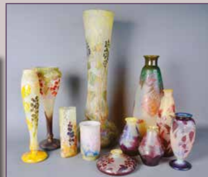
Daum, Gallé, Le Verre Français.