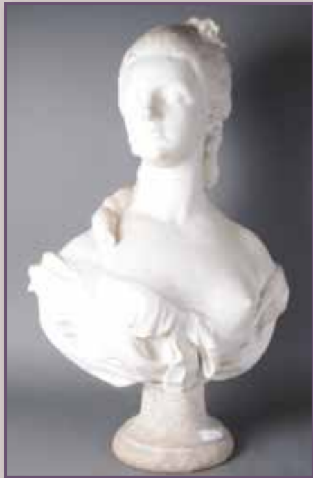
Buste de femme au sein gauche dénudé. Marbre. XIX ème siècle. Haut. 77 cm.