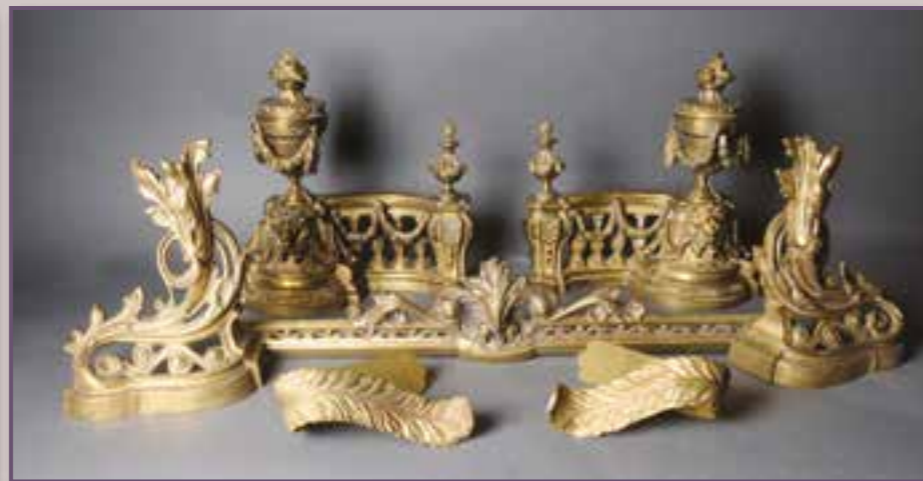
Éléments de garniture de cheminée en bronze doré. XIX ème siècle.