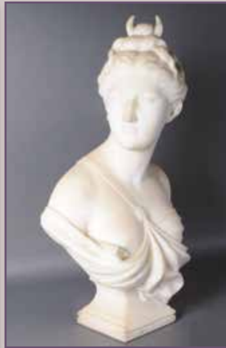
Buste de dame en drapé. Marbre. XIX ème siècle. Haut. 64 cm.