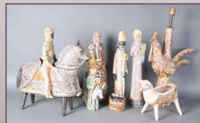
Sculptures de Jean-Pierre et Nicolas FARKAS.