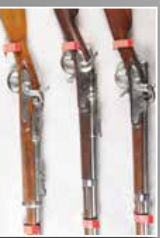
Essai sur fusil Anglais système à culasse. Belge n° 2364.