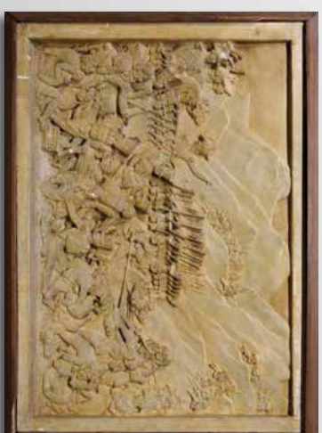
DAVID DANIGERS. Paire de bas-reliefs en plâtre. 19 ème siècle