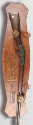
Carabine WINCHESTER 1873 canon hexagonal.