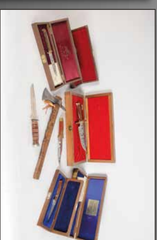
Ensemble de couteaux commémoratifs.