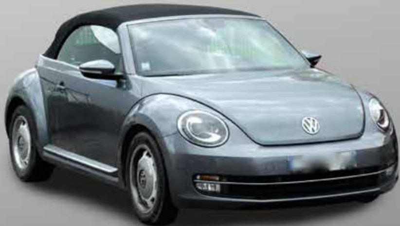
VOLKSWAGEN NEW BEETLE Coccinelle Cabriolet 2013 - 36 000 kms.

► Bronzes à patine brune du 19 ème siècle de sculpteurs tels que Pierre Jules MÊNE (1810-1879), Christophe FRATIN (1801-1864), Antoine Louis BARYE (1789-1876) et Ernest MEISSONNIER (1815-1891).