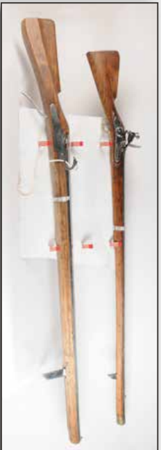
Fusil de temparts système à silex longueur 184, diamètre du canon 2,5 cm. Fusil de temparts système à métaux ramis partiellement en bois 197 cm diamètre 2,5cm.