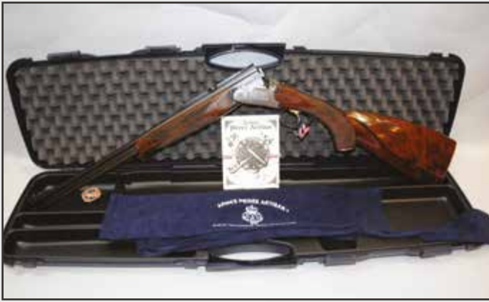
Express Artisan - état neuf.