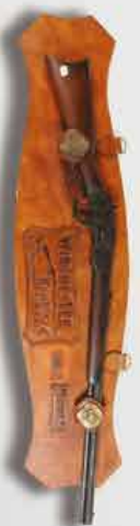
Carabine WINCHESTER 1873 canon long.