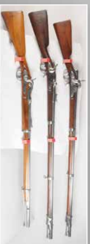
Fusil d'essai | 1822 belge chargement à culasse latéral.