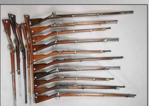
Ensemble de fusils de guerre 1817 à 1900.