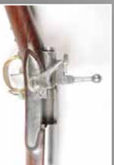
Fusil d'essai PELEUNI et CLERET à AVRANCHES transf. à percussion puis à culasse | BIS.