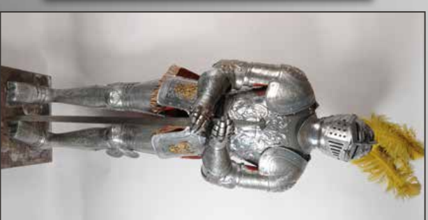
Armure début 20 ème siècle