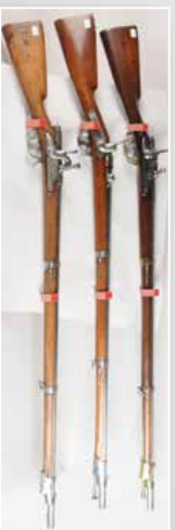
Fusil d'essai garniture laiton, chargement culasse, levier escamotable.