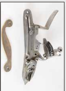
Poitrine de fusil à temparts système à silex.