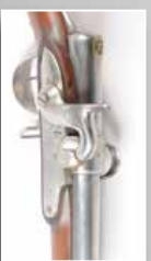
Fusil d'essai garniture laiton, chargement culasse, levier escamotable.