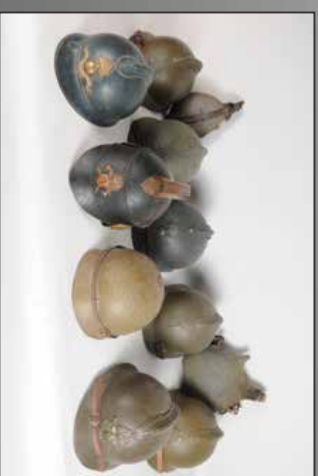
Ensemble de casques ADRIAN, LUFTSCHUSS.