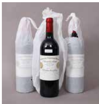
Lot 117 CHÂTEAU CHEVAL BLANC (X3) 2000 Adjugée 1 450 €