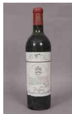
Lot 181 CHÂTEAU MOUTON ROTHSCHILD (X1) 1947 Adjugée 1 050 €