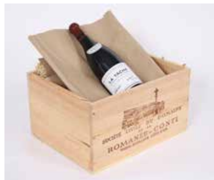
Lot 107 LA TÂCHE (X1) 2017 Adjugée 3 000 €