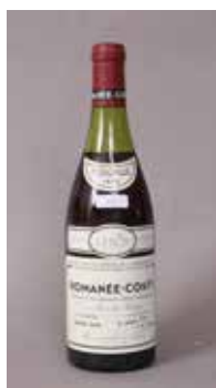
Lot 108 ROMANÉE CONTI (X1) 1978 Adjugée 7 400 €