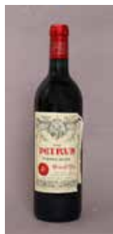
Lot 113 PÉTRUS (X1) 1990 Adjugée 1 700 €