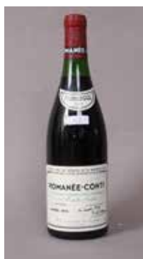
Lot 109 ROMANÉE CONTI (X1) 1975 Adjugée 5 200 €