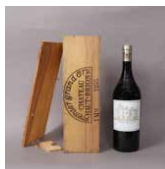
Lot 122 CHÂTEAU HAUT BRION (X1) 1995 Adjugée 880 €