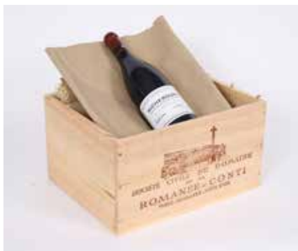
Lot 103 RICHEBOURG (X1) 2015 Adjugée 2 900 €