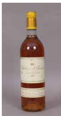
Lot 144 CHÂTEAU YQUEM (X1) 1989 Adjugée 280 €