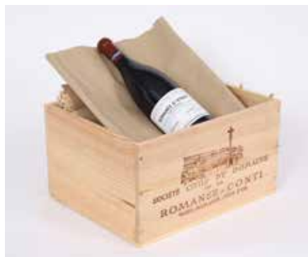
Lot 102 ROMANÉE-ST-VIVANT (X1) 2015 Adjugée 1 900 €