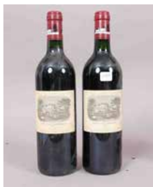
Lot 177 CHÂTEAU LAFITE ROTHSCHILD (X2) 1994 Adjugée 850 €