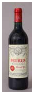
Lot 112 PÉTRUS (X1) 1990 Adjugée 2 050 €