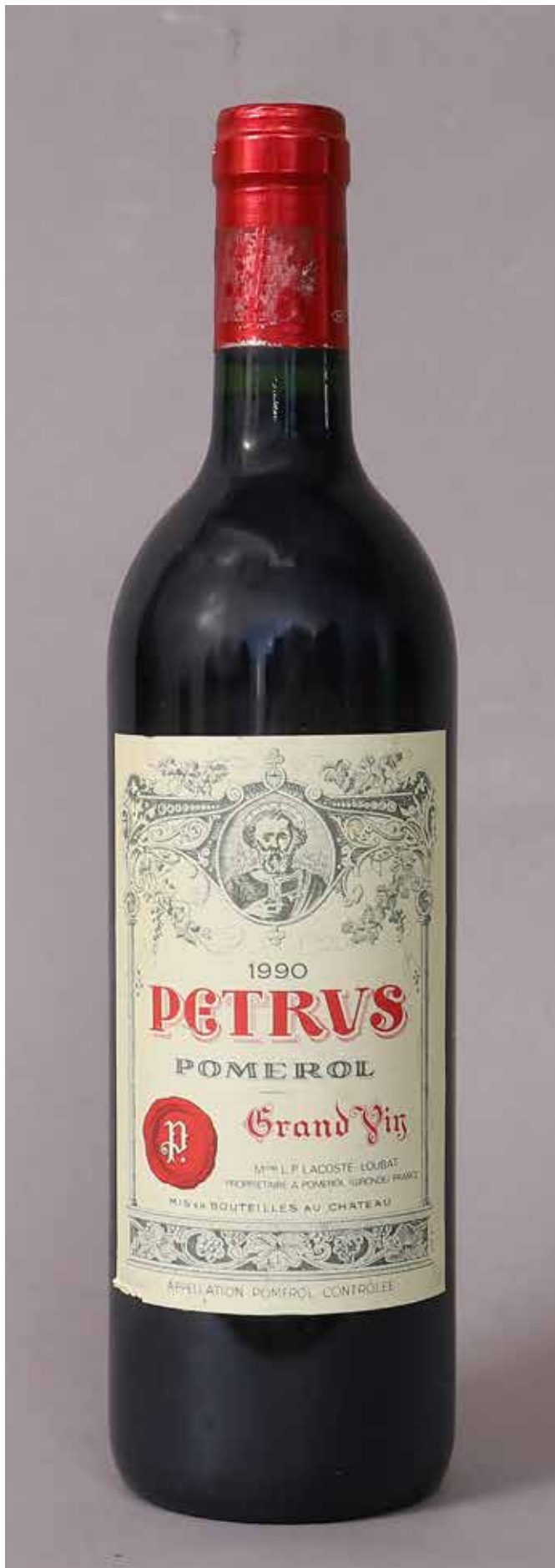
112 PÉTRUS (X1) Pomerol, 1990, 0,75L Est. : 2500 - 5000 €