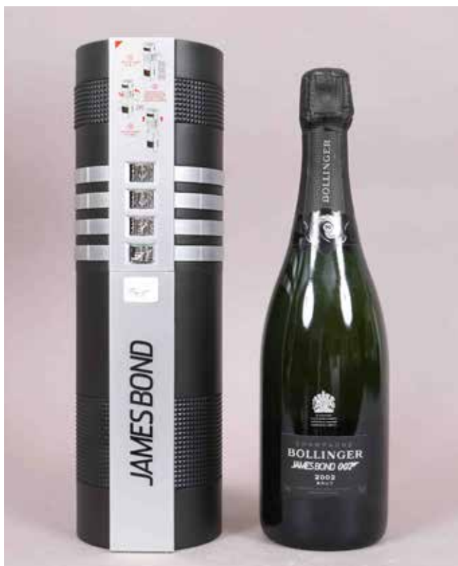
145 CHAMPAGNE BOLLINGER 002 FOR 007 Dans son coffret La grande année 2002, 0,75L Est. : 200 - 300 €