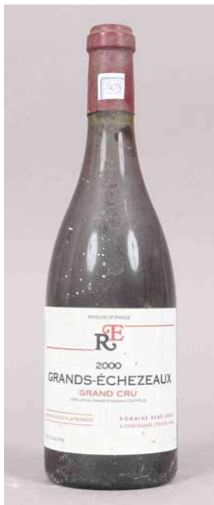
108 GRANDS-ECHEZEUX GC (X1) Domaine René Engel 2000, 0,75L Est. : 2500 - 3500 €