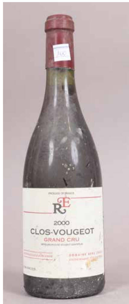
100 CLOS-VOUGEOT GC (X1) Domaine René Engel 2000, 0,75L Est. : 1000 - 2000 €