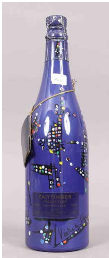
144 CHAMPAGNE TAITTINGER (X1) Collection - Vieira da Silva, 1983, 0,75L Est. : 100 - 200 €