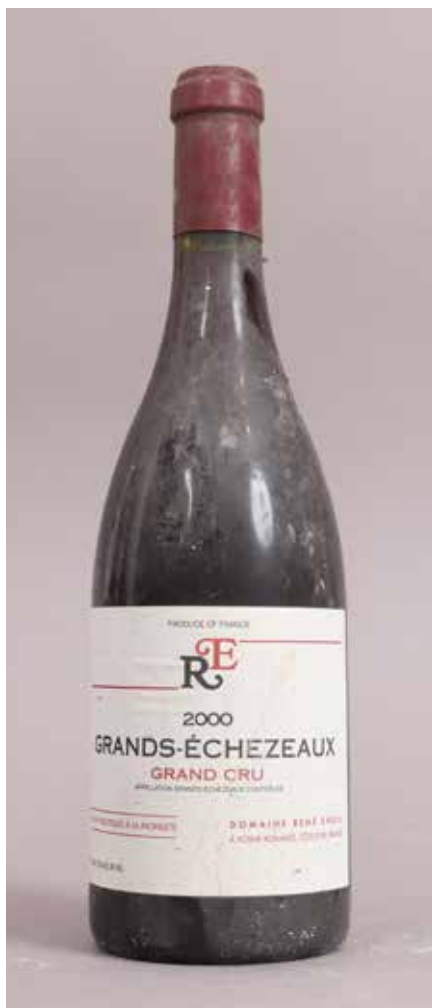
105 GRANDS-ECHEZEUX GC (X1) Domaine René Engel 2000, 0,75L Est. : 3000 - 4000 €