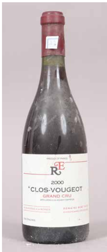
102 CLOS-VOUGEOT GC (X1) Domaine René Engel 2000, 0,75L Est. : 1000 - 2000 €