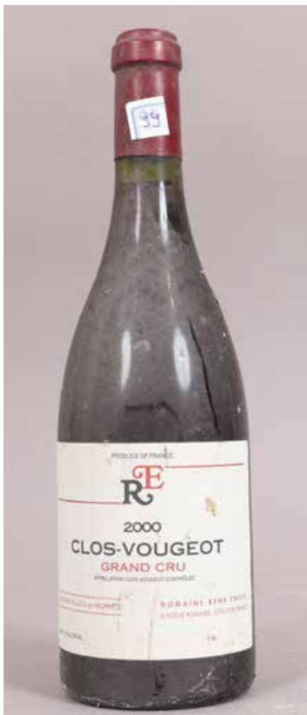
99 CLOS-VOUGEOT GC (X1) Domaine René Engel 2000, 0,75L Est. : 1000 - 2000 €