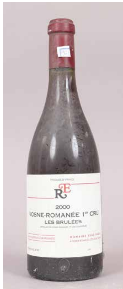
98 VOSNE ROMANÉE 1ER CRU LES BRULÉES (X1) Domaine René Engel 2000, 0,75L Est. : 2000 - 3000 €