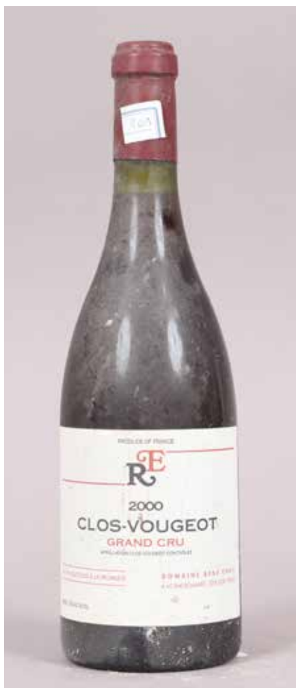
101 CLOS-VOUGEOT GC (X1) Domaine René Engel 2000, 0,75L Est. : 1000 - 2000 €