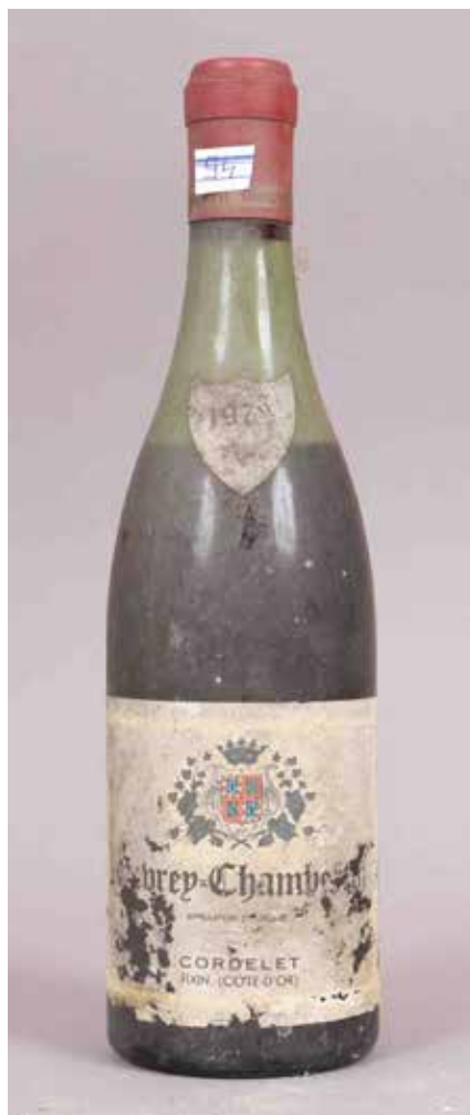
94 GEVREY-CHAMBERTIN (X1) Cordelet, 1979, 0,75L Est. : 60 - 80 €