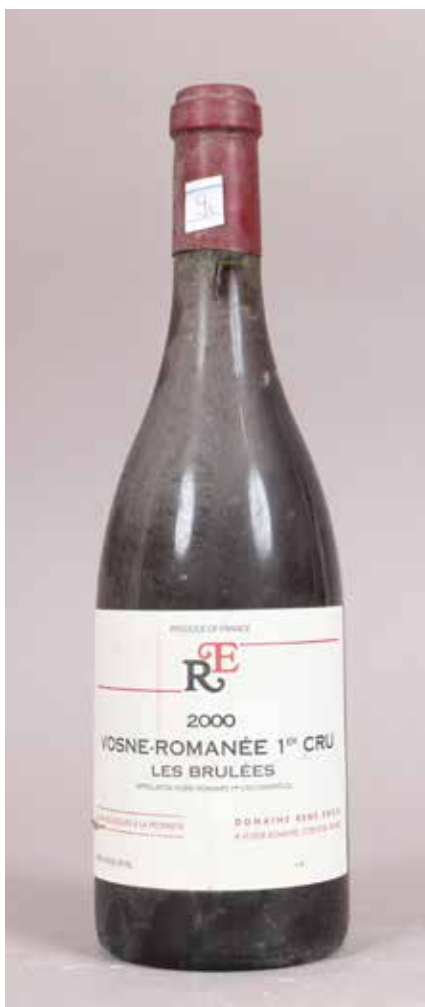
96 VOSNE ROMANÉE 1ER CRU LES BRULÉES (X1) Domaine René Engel 2000, 0,75L Est. : 2000 - 3000 €