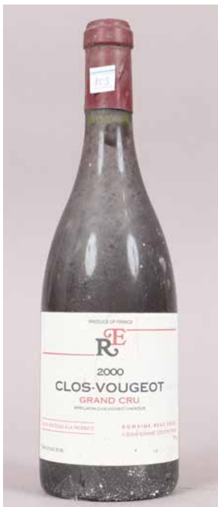
103 CLOS-VOUGEOT GC (X1) Domaine René Engel 2000, 0,75L Est. : 1000 - 2000 €