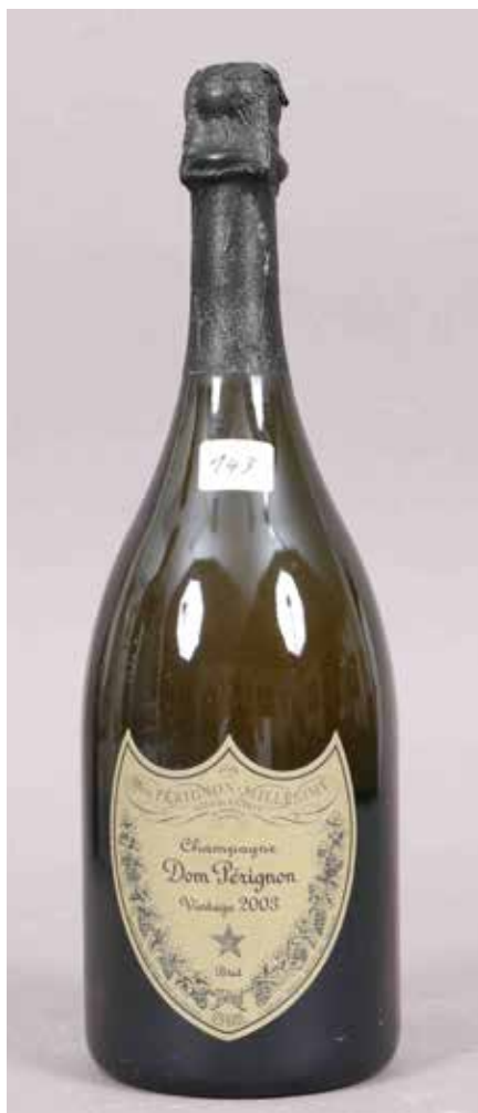
143 CHAMPAGNE DON PÉRIGNON (X1) Vintage 2003, 0,75L Est. : 150 - 200 €