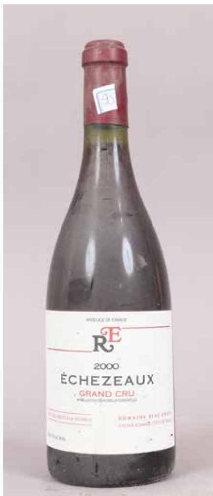
95 ECHEZEUX GC (X1) Domaine René Engel 2000, 0,75L Est. : 2000 - 3000 €