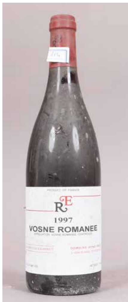
104 VOSNE ROMANÉE (X1) Domaine René Engel, 1997, 0,75L Est. : 800 - 1000 €