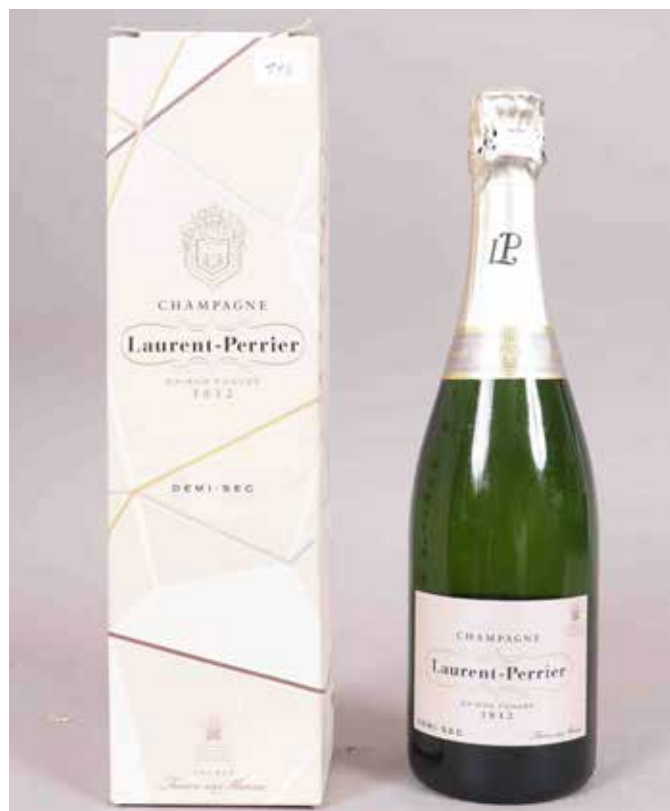
146 CHAMPAGNE LAURENT PERRIER (X1) Demi-sec, 0,75L Est. : 20 - 40 €