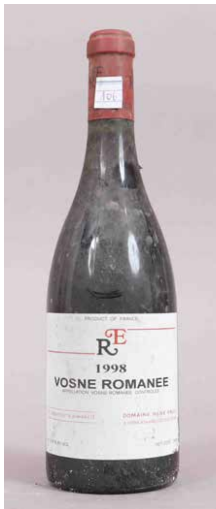
106 VOSNE ROMANÉE (X1) Domaine René Engel, 1998, 0,75L Est. : 700 - 1000 €