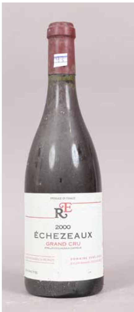
93 ECHEZEUX GC (X1) Domaine René Engel 2000, 0,75L Est. : 2000 - 3000 €