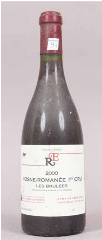
97 VOSNE ROMANÉE 1ER CRU LES BRULÉES (X1) Domaine René Engel 2000, 0,75L Est. : 2000 - 3000 €