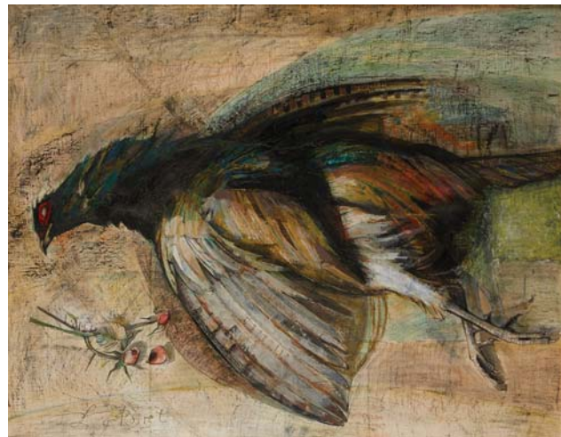
- 232 - Pierre-Louis POIRET Nature morte au faisán Huile sur toile signée en bas à gauche. Dim. : 73 x 92 cm 150 / 200 €