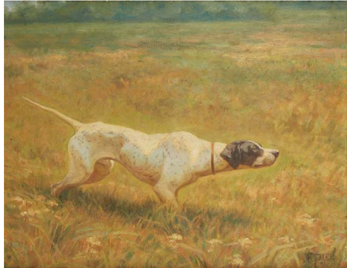
- 230 - F PIEL Pointer à l'arrêt Huile sur panneau signée en bas à droite. Dim. : 32,5 x 41 cm 200 / 300 €