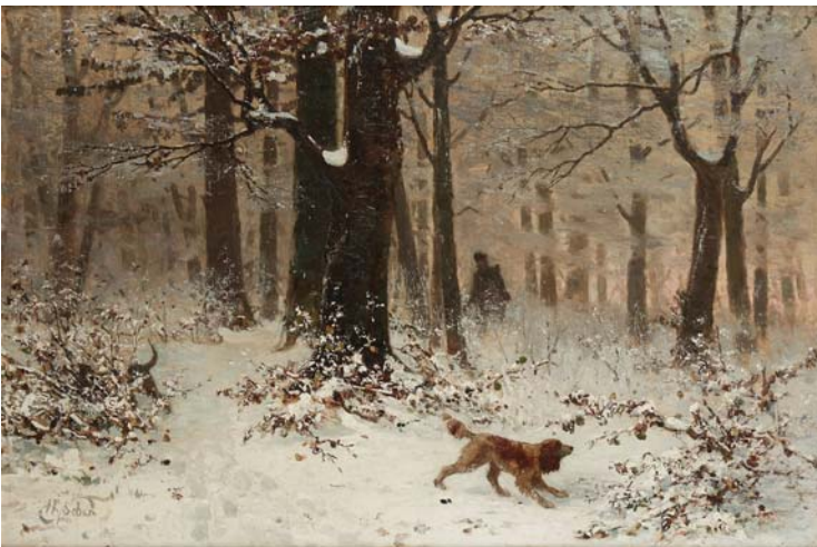
- 231 - Ecole probablement russe Chasseur et son chien sous la neige Huile sur toile signée en bas à gauche. : H SIBER. Dim. : 48 x 71,5 cm 150 / 200 €