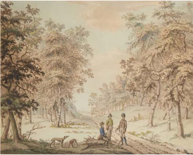
- 229 - Ecole française du XIXe siècle, attribué à SARTORIUS Chasseurs aux chiens Dessin au lavis. Dim. : 43,5 x 54,5 cm 200 / 300 €