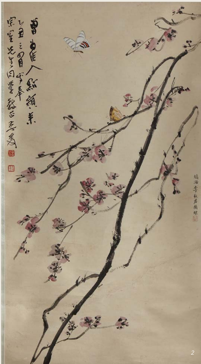
2 CHINE ZHANG Daqian, style de Rouleau figurant une fleur de prunus et papillon. XXe siècle. Dim. : 86 x 47,5 cm 500 / 700 €