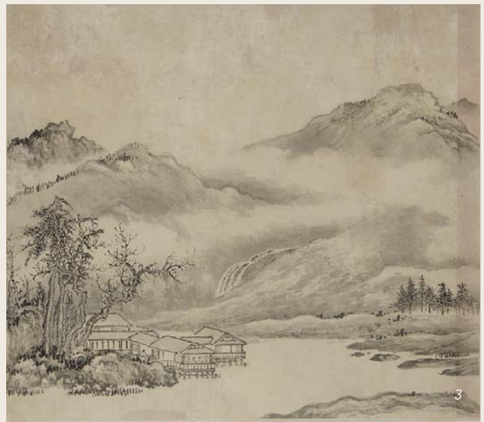
3 CHINE Paire d'aquarelles au lavis représentant un paysage lacustre. Une comporte un poème calligraphié. XXe siècle. Dim. : 29,5 x 34 cm 200 / 300 €