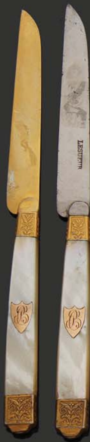
147 Deux couteaux de voyage, manches en nacre, lames en vermeil et acier. Paris 1798-1809. Poids brut : 63,8 g. 50 / 80 €