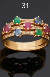
- 31 - BAGUE composée de trois anneaux sertis de lignes de diamants de taille huit-huit et intercalés par rangs, deux d'un petit saphir rond et d'une petite émeraude ronde, le centre de deux rubis. TDD : 50 Poids brut : 4,7 g 100 / 200 €