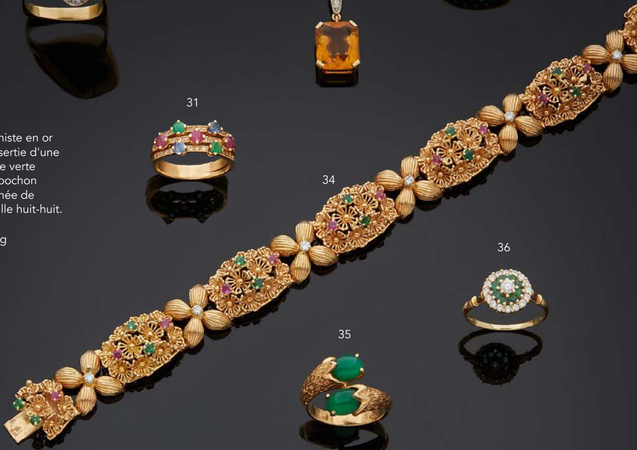
- 34 - BRACELET ARTICULÉ en or jaune 750 mm à motifs de fleurettes ponctuées de rubis, émeraudes et diamants brillantés. Travail français vers 1965. Poids brut : 36,7 g. 1 000 / 1 500 €