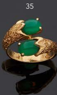
- 35 - BAGUE croisée en or jaune 750 mm sertie de deux cabochons d'agate verte baignée TDD : 53 Poids brut : 5 g 100 / 200 €