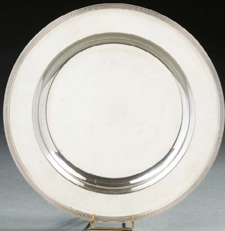
- 353 - CHRISTOFLE Plat en métal argenté, modèle à filets. Style Empire. 50 / 80 €