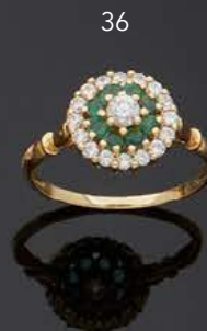
- 36 - BAGUE en or jaune 750 mm dite marguerite, ornée de pierres blanches et vertes imitation. TDD : 55 Poids brut : 2,4 g 150 / 200 €