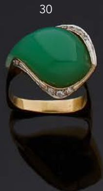
- 30 - BAGUE moderniste en or jaune 750 mm sertie d'une goutte de pierre verte imitation en cabochon fantaisie soulignée de diamants de taille huit-huit. TDD : 56 Poids brut : 11 g 300 / 500 €