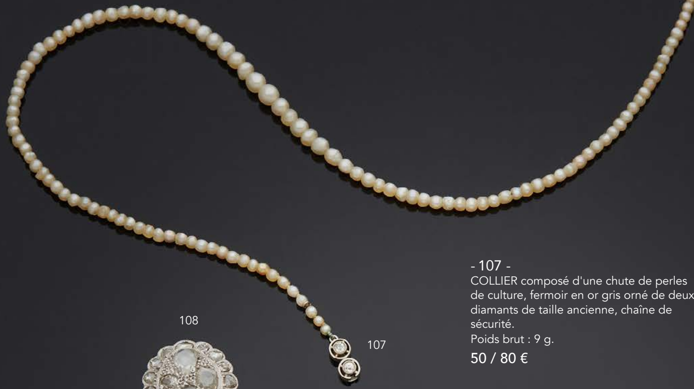
- 107 - COLLIER composé d'une chute de perles de culture, fermoir en or gris orné de deux diamants de taille ancienne, chaîne de sécurité. Poids brut : 9 g. 50 / 80 €