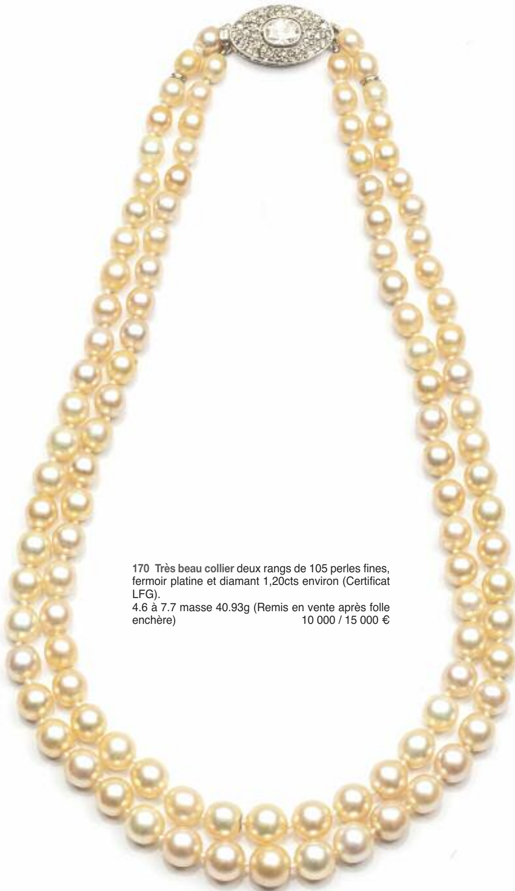
170 Très beau collier deux rangs de 105 perles fines, fermoir platine et diamant 1,20cts environ (Certificat LFG). 4.6 à 7.7 masse 40.93g (Remis en vente après folle enchère) 10 000 / 15 000 €