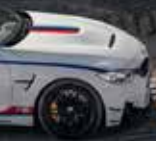
1995 BMW M3 GT