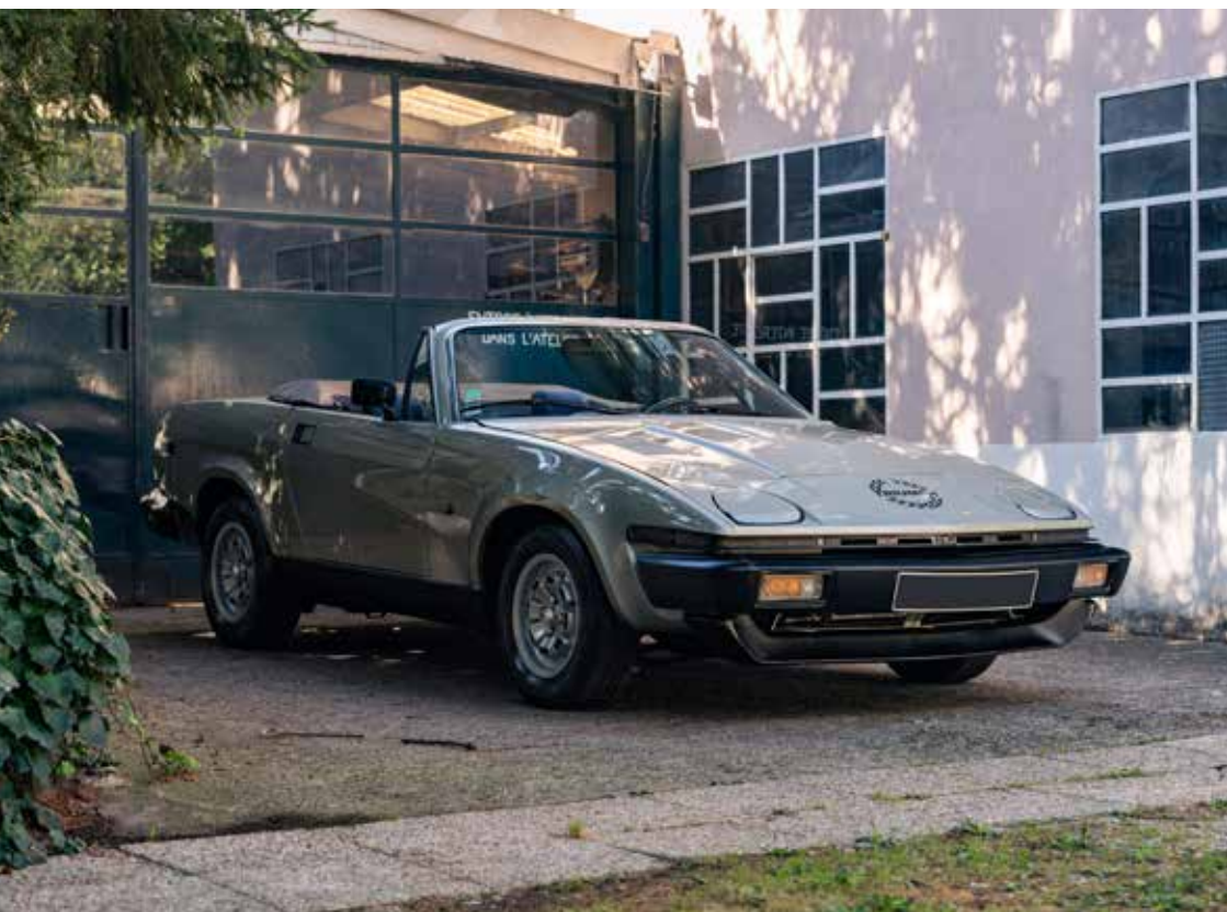
TRIUMPH TR7 CABRIOLET