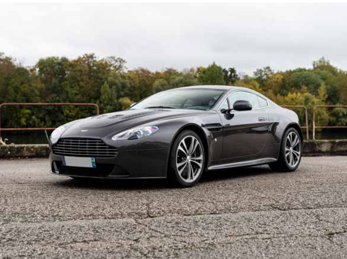
ASTON MARTIN V12 VANTAGE