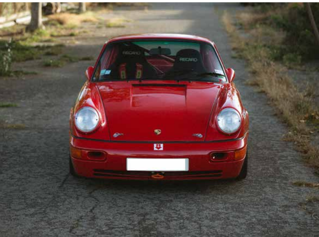
PORSCHE 964 CUP