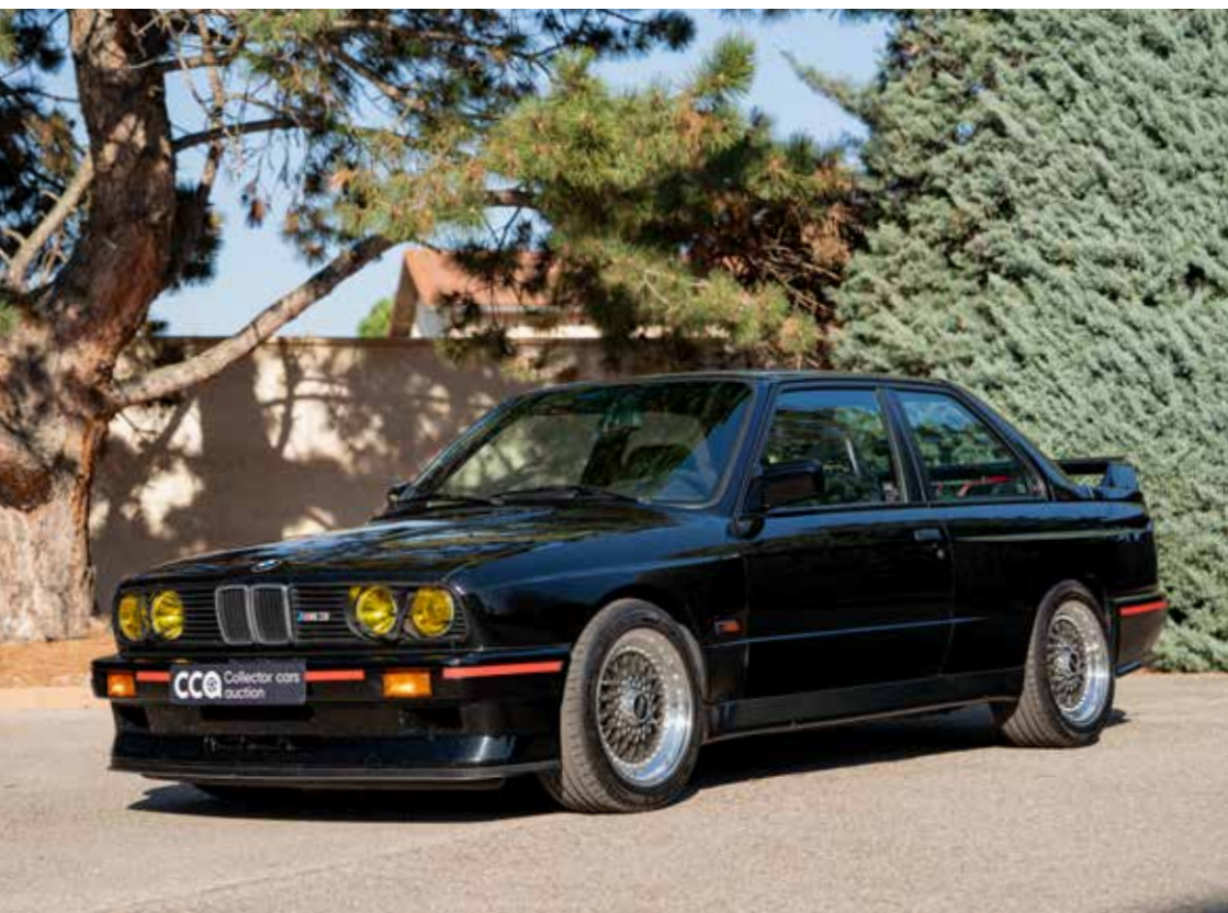
BMW M3 SPORT EVOLUTION