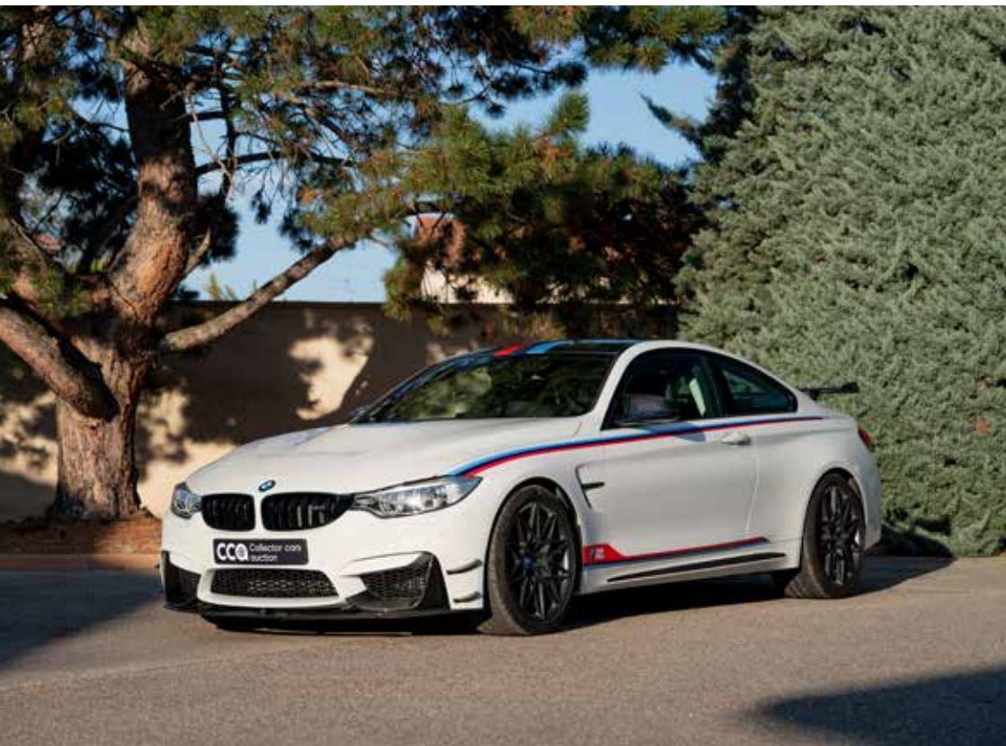
BMW M4 DTM CHAMPION EDITION