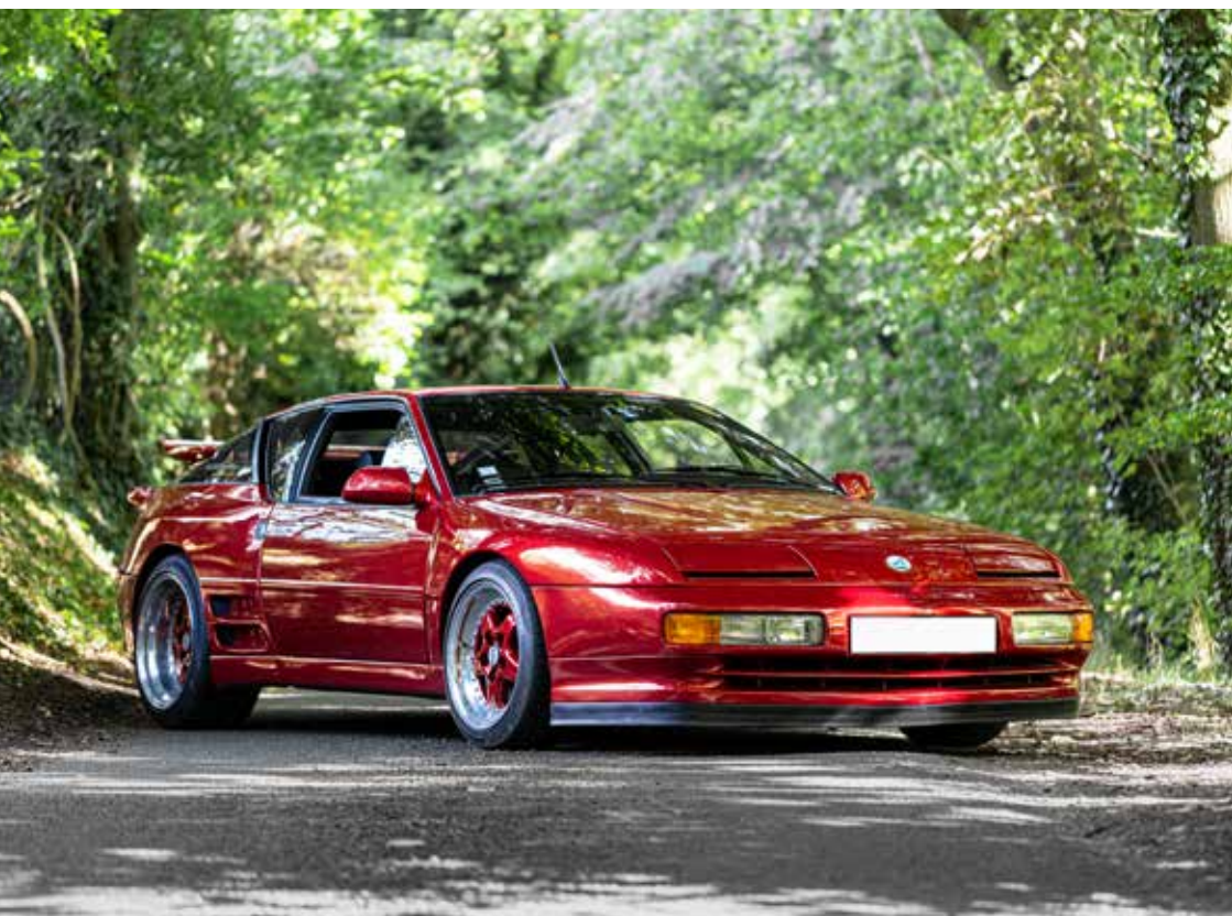
ALPINE A610 PROTOTYPE