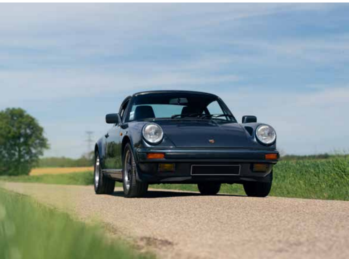
PORSCHE 911 3.2L