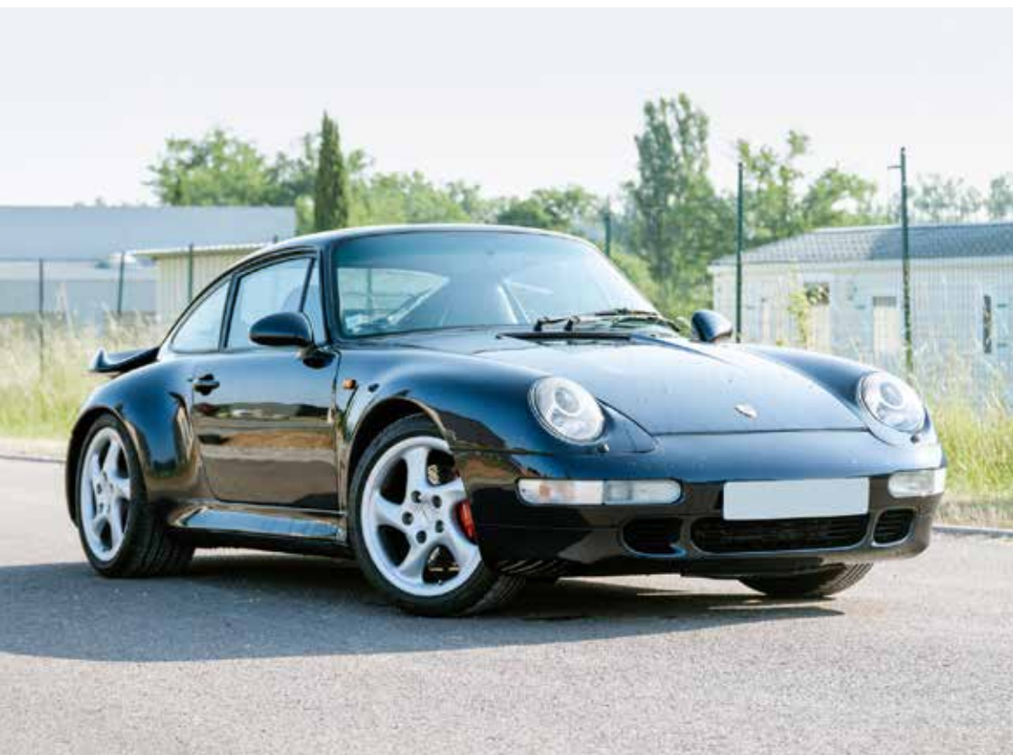
PORSCHE 993 TURBO