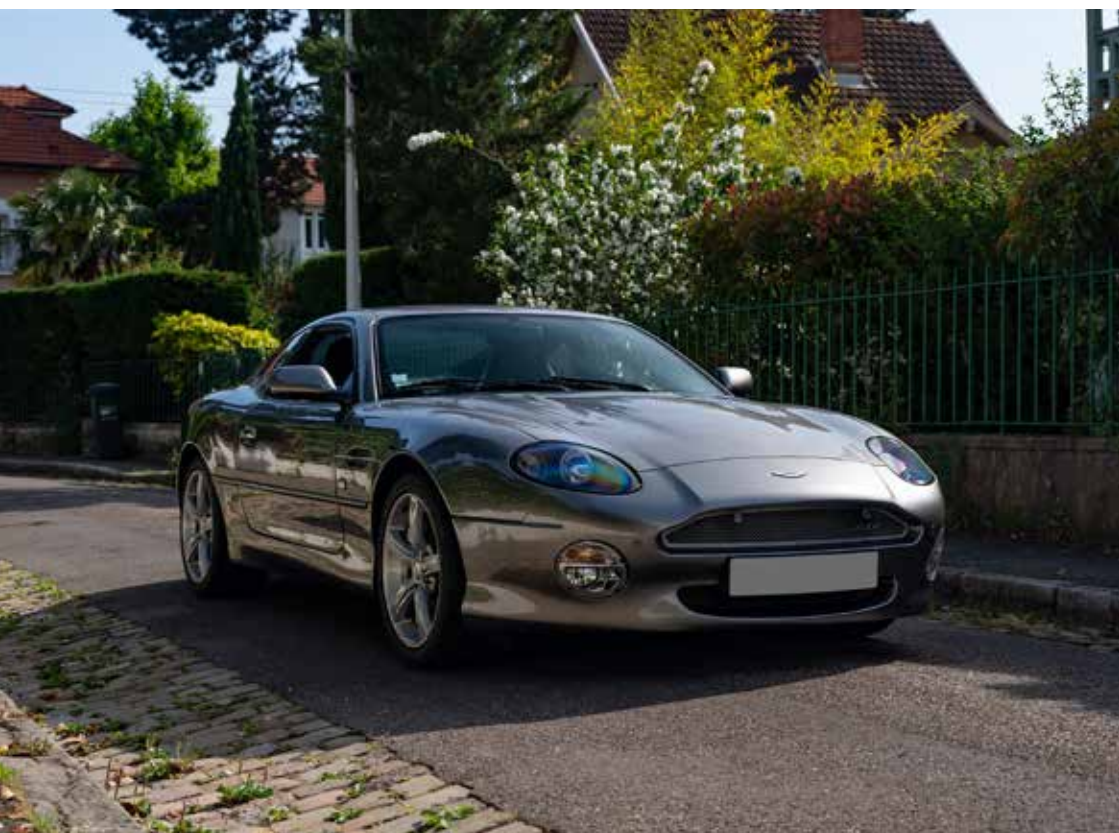
ASTON DB7 GTA