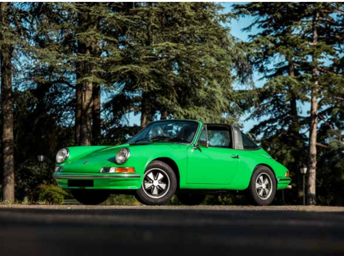
PORSCHE T TARGA