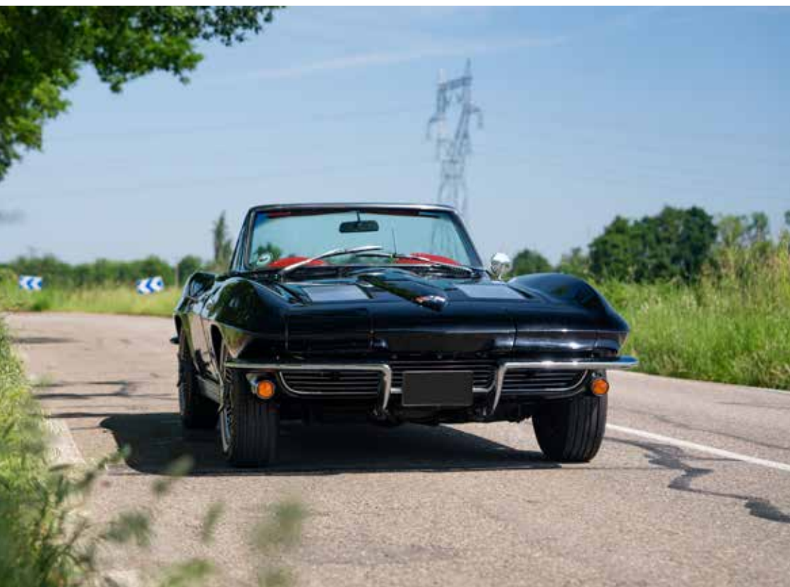
CORVETTE C2 STINGRAY