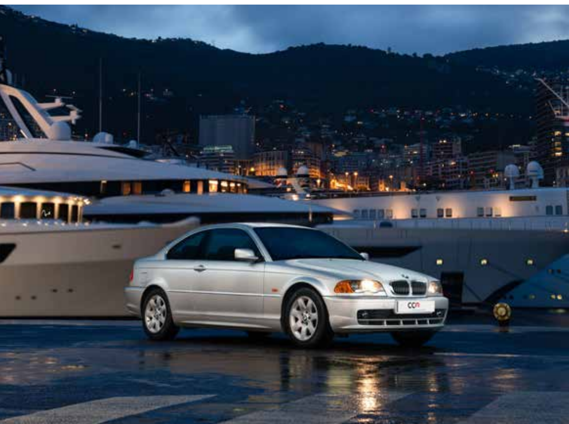
BMW 328 Ci