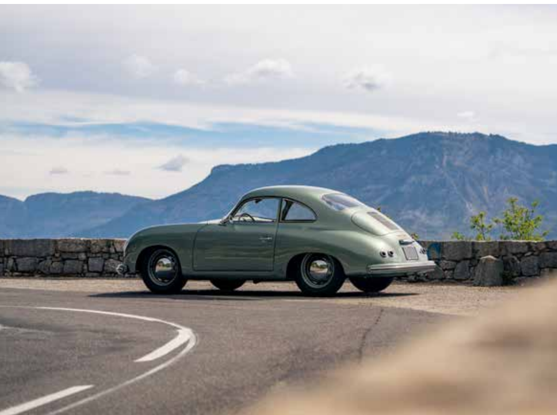
PORSCHE 356 Pré-A