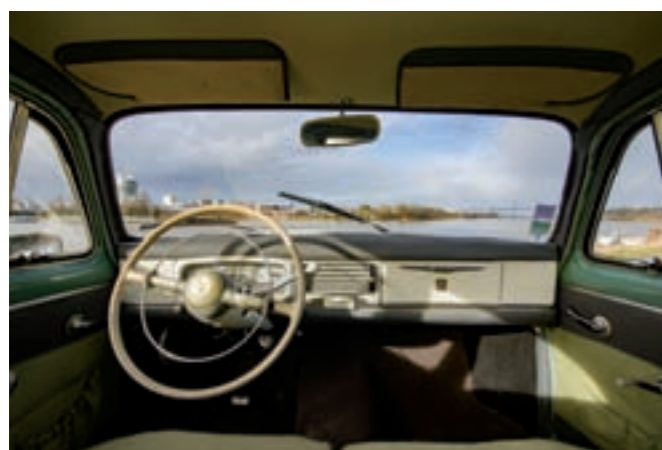
17 PEUGEOT 403 Berline 4 portes, verte du 27/03/1957, n° de série 2110863, carte grise française, 70000 km au compteur. Moteur 4 cylindres de 1468 cm3, 8 CV fiscaux, carburateur Solex, boîte de vitesses manuelle à 4 rapports. Sellerie tissu chiné et simili vert, tableau de bord et volant d'origine. Pare-chocs chromés. Jantes acier avec enjoliveurs chromés. Motif Lion Peugeot sur capot. En état de marche avec contrôle technique. 4 000/5 000 €