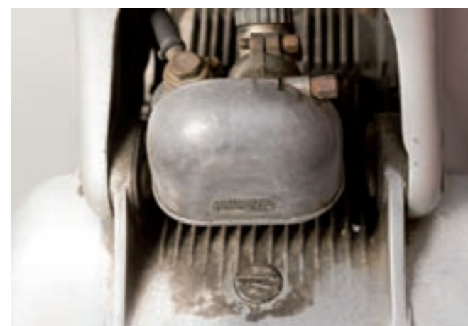
2 RUMI FORMICCHINO Scooter 2 places gris métallisé du 00/00/1956, carte grise française, n° de série 20684, 04670 km au compteur. Cadre en alu coulé. Moteur bi cylindre 125 cm 3 2 temps avec carburateurs Delorto, refroidi par air, 4 vitesses manuelles. Selle longue bi places simili noir. 2 000/2 500 €