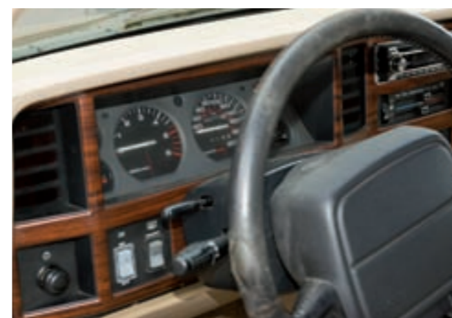
16 CHRYSLER JEEP CHEROKEE 4X4 Country 2L5, 5 places, 5 portes, vert foncé du 17/05/1995, carte grise française, LHD, n° de série 1J4FJN8MXSL615906, 242775 km au compteur. Moteur 4 cylindres 2L5 turbo diesel, 10 CV fiscaux, boîte de vitesses manuelle à 5 rapports. Sellerie cuir beige, tableau de bord façon bois, volant gainé cuir d'origine. Jantes alliage. Attache de remorque. Guides et manuels d'entretien ainsi que factures et contrôles anciens. 3 000/5 000 €