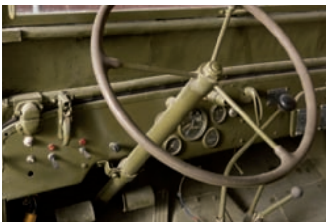
5 JEEP WILLYS Torpédo militaire 2 places type MB 4X4 couleur Kaki du 12/04/1944, n° de série 394465. Moteur latéral 4 cylindres en ligne, 13 CV fiscaux (17cv, erreur s/carte grise) Boite de vitesses manuelle. Bâche toile kaki. Sellerie tissu kaki. Accessoires : Pelle, hache et Jerrycan à l'arrière. Pneumatiques tous terrain avec roue de secours. 8 000/10 000 €