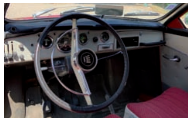
8 SAAB 96 Coach 2 portes rouge type 96V4 du 16/01/1967, carte grise française, n° de série 433040, 11183 km au compteur avec manuel de service. Moteur Ford 4 temps, 4 cylindres en V de 1498 cm 3 , 55 CV Din. Boîte de vitesses manuelle à 4 rapports. Double circuit de freinage. Jantes acier grises avec enjoliveurs chromés. Pare chocs et calandre chromés. Sellerie velours rouge, simili gris et blanc, tapis de sol caoutchouc gris. Factures d'entretien et de réparations. En état de marche avec contrôle technique. 6 000/8 000 €