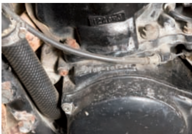
3 SUZUKI TS 125X Trail 2 places, rouge du 14/06/1984, carte grise française, n° de série 101357, 21726 km au compteur. Moteur n° F105-101441, mono cylindre 125 cm 3 , 2 temps. Selle longue bleue. Jantes Chromées. 1 000/1 200 €