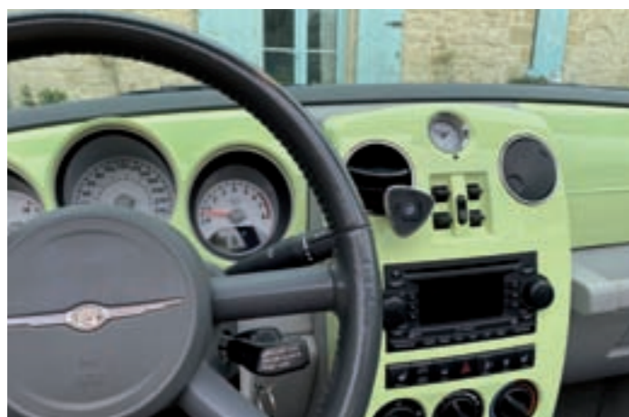
7 CHRYSLER PT CRUISER Cabriolet 2 portes, 4 places, Vert anis du 27/04/2007, carte grise française, n° de série 1C3HYB5X67T590232, 81814 km au compteur. Moteur 4 cylindres essence de 2L4, 143 CV à 5100 tr/mn, 10 CV fiscaux, boîte de vitesses automatique à 4 rapports. Sellerie cuir gris, capote toile noire, arceau de sécurité. Tableau de bord couleur carrosserie avec instruments fonds blancs et autoradio, volant à 4 branches gainé cuir. Jantes noires d'origine. En état de marche avec contrôle technique. 6 000/7 000 €