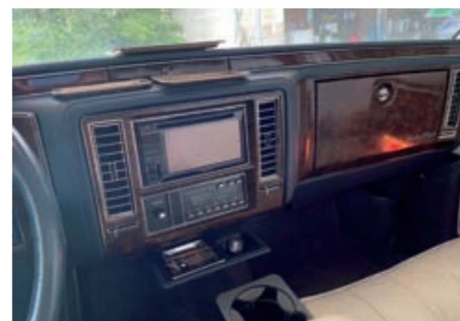
14 CADILLAC BROUGHAM d'élégance berline 4 portes, 5 places, blanche du 02/02/1991, carte grise française, n° de série 1G6DW5475MR718605, 69975 km au compteur. Moteur V8 Chevrolet injection de 5L7, 173 CV, 32 CV fiscaux, boîte de vitesses automatique à 4 rapports. Sellerie simili blanc, sièges capitonnés. Tableau de bord façon bois. Grands phares rectangulaires. Jantes acier avec enjoliveurs façon rayons. En état de marche avec contrôle technique. 9 000/15 000 €