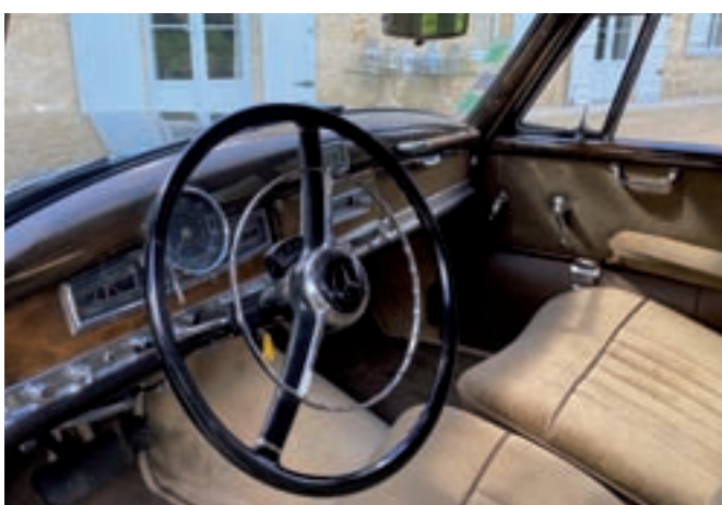
13 MERCEDES BENZ 300 C Limousine découvrable « Adénauer » 4 portes, noire du 15/09/1956, carte grise française de collection, n° de série 1860176500062, type W186, 45508 km au compteur. Moteur 3 litres, 6 cylindres en ligne alimenté par 2 carburateurs, 17 CV fiscaux, boîte de vitesses automatique. Sellerie velours et simili beige. Tableau de bord et entourages intérieurs des vitres en bois vernis, bien complet de ses instruments de contrôle, volant d'origine avec cerclé de Klaxon. Automobiles ayant appartenu pour la plupart à des chefs d'état ou au show-biz. En état de marche. 50 000/70 000 €