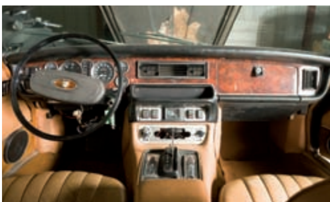
15 JAGUAR XJ6 4L2 Coupé 2 portes marron clair 4 places, toit vinyle noir du 11/02/1976, carte grise française, LHD, n° de série 2J50448BW, 81162 km au compteur. Moteur bloqué, 6 cylindres en ligne, 4L2, 2 ACT, 2 carburateurs SU, boîte de vitesses automatique. Sellerie cuir fauve, moquettes de laine beige, tableau de bord, volant d'origine. Pare-chocs chromés. Jantes acier avec enjoliveurs chromés. 5 000/7 000 €