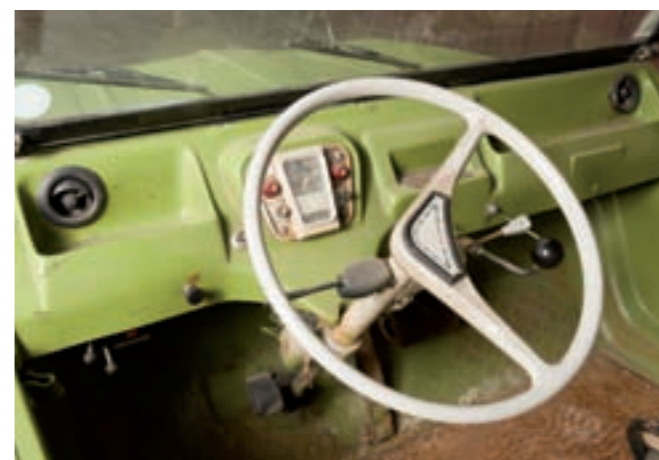
4 CITROËN Méhari fourgonnette bâchée 2 places, type AYCA, verte du 14/06/1971, carte grise française, n° de série 02CA1344, 01184 km au compteur. Moteur SAA Citroën n°0501023453, 2 cylindres à plat de 602 cm 3 , boîte de vitesses manuelle à 4 rapports. Bâches supérieure et latérales simili noir, sellerie simili noir. Tableau de bord et volant d'origine. Attache de remorque. Jantes acier d'origine grises avec roue de secours à l'intérieur. Factures d'entretien et contrôle ancien. 8 000/10 000 €