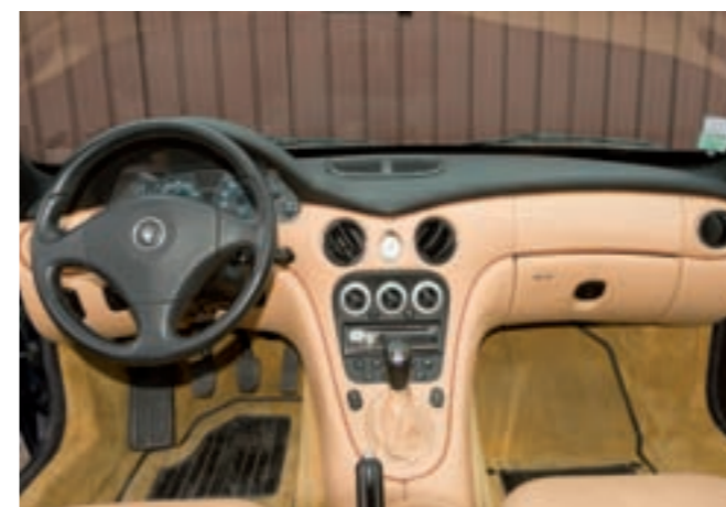
12 MASERATI 3200 GT Coupé 2 portes bleu nuit, 4 places du 28/11/2002, carte grise française, n° de série ZAMAA38A000003598, 78827 km au compteur. Carrosserie par Giorgetto Giugiaro, feux arrière Boomerang. Moteur V8 injection bi-turbo de 3217 cm3, 370 CV Din. Boîte de vitesses manuelle à 6 rapports. Climatisation. Jantes alliage d'origine. Sellerie cuir beige ainsi que les garnitures de portes, le ciel de toit et le tableau de bord. Dossier factures depuis 2006 à 24170 km avec changement moteur/turbo à 44439 km par concession Maserati pour un moteur de même type avec garantie n'ayant que 9000 km et distribution revue à 70790 km. En état de marche avec contrôle technique. 25 000/30 000 €