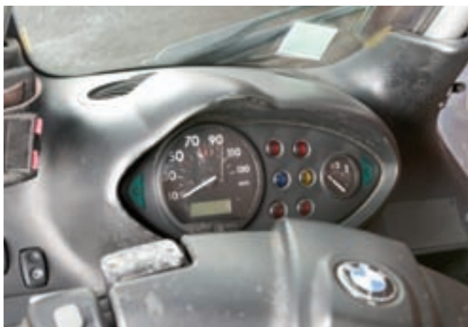
1 BMW C1 Exécutive Scooter avec toit translucide et coffre à l'arrière, noir et gris métallisé du 16/09/2003, carte grise française, n° de série WB10191A01YA18171, 52348 km au compteur. Châssis et cadre alu. Moteur 124 cm 3 4 temps 2ACT 4 soupapes, 1 catalyseur, refroidi par eau, boîte de vitesses avec variateur. Sellerie cuir avec appui tête. 2 jantes alliage + 1 jante supplémentaire. En état de marche. 1 000/1 500 €