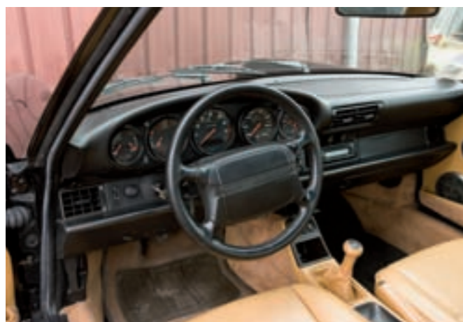
11 PORSCHE 911 Turbo Coupé 2 portes noir, toit ouvrant électrique type 965 du 11/01/1991, carte grise française, livré en France le 04/01/91, n° de série WPOZZZ96ZMS470176, 163664 km parcourus depuis l'origine avec livret d'entretien à jour et manuel technique. Moteur M30/69 injection KE Jetronic + turbo KKK, 3L3, 320 CV à 5750 tr/mn, boîte de vitesses G50.52 à 5 rapports. Pont autobloquant 40%. Climatisation. Jantes alliage Turbo de 18". Sellerie d'origine cuir beige/jaune avec moquettes assorties. Factures d'entretien et contrôles techniques. Modèle rare. En état de marche avec contrôle technique. 80 000/100 000 €