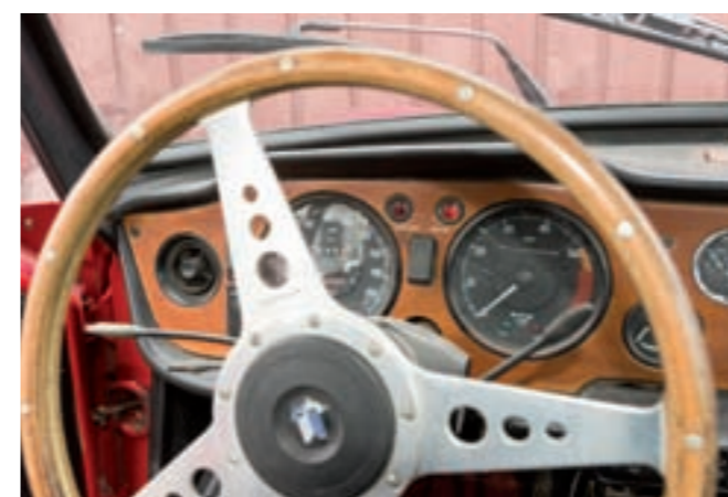
6 TRIUMPH TR6 PI Cabriolet rouge du 10/11/1971, carte grise française, LHD, n° de série 1CP53076LP, 33450 km au compteur. Moteur injection 6 cylindres en ligne de 2L5, 150 CV, boîte de vitesses manuelle à 4 rapports. Jantes alliage léger « Cosmic ». Sellerie simili noir, tableau de bord bois vernis, volant Moto-Lita à 3 branches. Capote de toile noire. Porte bagages sur coffre arrière. Factures d'entretien à disposition. 10 000/12 000 €