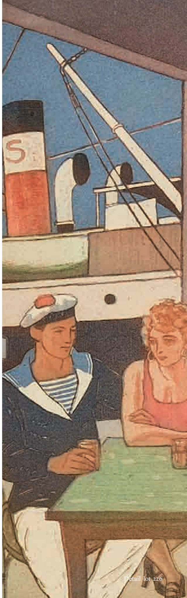
Détail lot 226