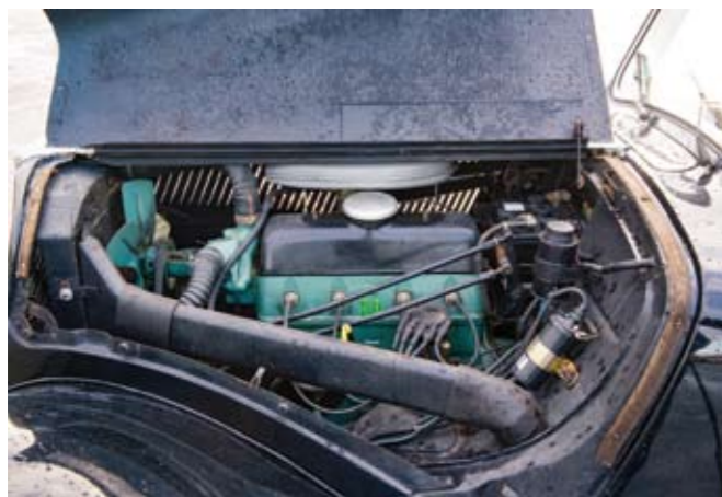
5 CITROEN Berline 4 portes type 11BL traction avant de 1953, n° de série 621268 de couleur noire, sellerie tissu et simili gris. Moteur 4 cylindres de 1911 cm 3 . Boite de vitesses mécanique à 3 rapports. Jantes acier avec enjoliveurs chromés. Compteur annonçant 64988 km. Carte grise française normale. 9 000/10 000 €