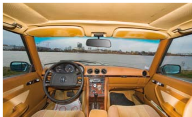
14 MERCEDES Coupé 2 portes type 280SLC du 22/11/1978, n° de série 10702212006061 de couleur gris métallisé clair, toit ouvrant électrique, sellerie velours beige. Moteur 6 cylindres en ligne double ACT de 2746 cm 3 à injection, 177CV à 6000 Tr/mn. Boîte de vitesses automatique. Jantes alliage léger d'origine. Carte grise française normale. 10 000/12 000 €