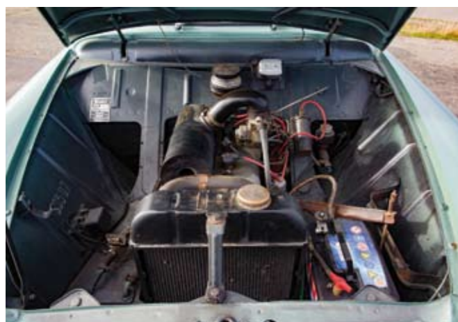
3 PEUGEOT Berline 4 portes type 403 8CV du 27/03/1957, n° de série 2110863 de couleur verte, sellerie tissu chiné et simili Vert. Moteur 4 cylindres de 1468 cm 3 . Boite de vitesses mécanique à 4 rapports. Jantes acier avec enjoliveurs chromés. Compteur annonçant 69384 km. Carte grise française normale. 2 500/3 000 €