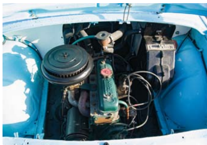
1 RENAULT Berline 4 portes Dauphine type R1090 de 1958, n° de série 3072142 de couleur vert clair, sellerie tissu gris et simili Marine. Moteur 4 cylindres 845 cm 3 . Boite de vitesses mécanique à 3 rapports. Jantes acier avec enjoliveurs chromés. Compteur annonçant 89482 km. Carte grise française normale. 3 000/4 000 €