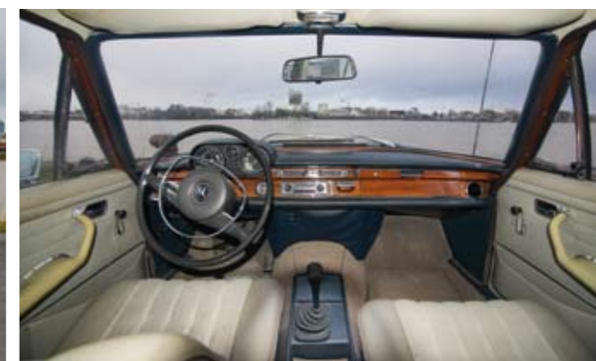
15 MERCEDES Berline 4 portes type 280S du 18/01/1972, n° de série 1080161008693S de couleur bleu-marine, toit ouvrant électrique, sellerie velours gris. Moteur M130-16, 6 cylindres en ligne à carburateur de 2778 cm 3 , 140CV à 4200 Tr/mn. Boîte de vitesses mécanique à 4 rapports, 4 freins à disques assistés. Compteur annonçant 57443 km. Carte grise française de Collection. 5 000/6 000 €