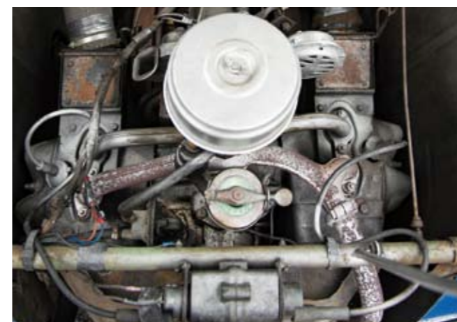
2 CITROEN Berline découvrable type AZ sie 2CV du 7/01/1961, n° de série 2517371 de couleur bleue, sellerie neuve tissu à rayures bleu. Capote bleue. Moteur 2 cylindres à plat de 425 cm 3 . Boite de vitesses mécanique à 4 rapports. Jantes acier. Compteur annonçant 29859 km. Carte grise française de Collection. 3 000/4 000 €