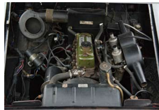
13 AUSTIN HEALEY Cabriolet type Sprite MKIII du 18/02/1965, n° de série 43303 de couleur noire, sellerie d'origine simili noir, passepoils blancs, capote simili noir. Moteur 4 cylindres de 1098 cm 3 alimenté par 2 carburateurs SU. Boite de vitesses mécanique à 4 rapports. Roues à rayons. Conduite française. Compteur annonçant 75961 km. Carte grise française de collection. 8 000/10 000 €