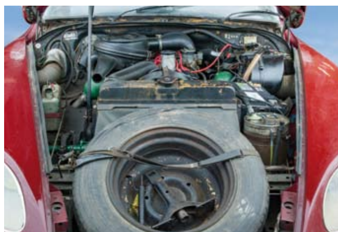
16 CITROEN Berline 4 portes type DSpécial du 18/07/1974, n° de série 09FD4274 de couleur bordeaux, toit gris, sellerie tissu Rouge. Moteur 4 cylindres de 1985 cm 3 . Boite de vitesses mécanique à 4 rapports. Jantes acier avec enjoliveurs chromés. Compteur annonçant 13775 km. Carte grise française normale. 9 000/10 000 €