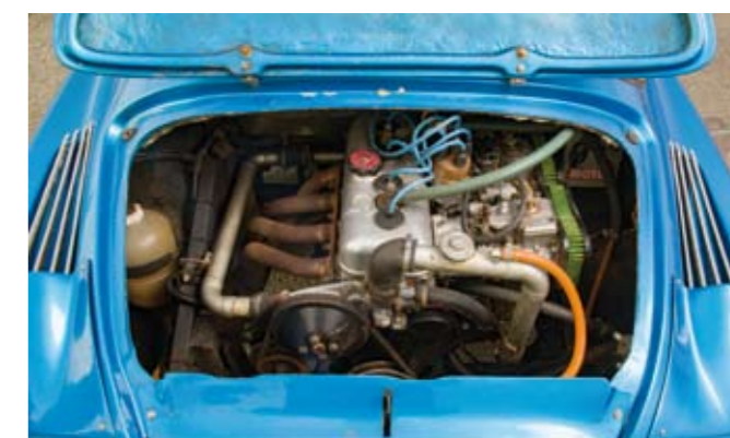
8 ALPINE RENAULT Berlinette V85 type A110 1300VC de 1976, n° de série 16083, carrosserie AA100 n° 7675 de couleur bleue, sellerie d'origine simili noir. Moteur Gordini 1300 type 812-00 n° 4944, 103CV SAE alimenté par 2 carburateurs double corps Weber 40DCOE. Boîte de vitesses mécanique à 5 rapports. Jantes alliage léger d'origine. Compteur annonçant 94819 km. Vente par autorité de Justice, à immatriculer en carte grise de Collection. 20 000/25 000 €