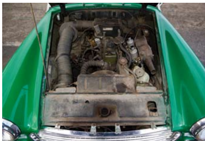
12 AUSTIN HEALEY Cabriolet type Sprite MKIII du 24/06/1964, n° de série 40169 de couleur verte (British Racing Green) sellerie d'origine simili noir, passepoils blancs, capote et couvre-tonneau simili noir. Moteur 4 cylindres de 1098 cm 3 alimenté par 2 carburateurs SU. Boite de vitesses mécanique à 4 rapports. Roues à rayons. Freins et carburation revus, pompe à essence et collecteur d'échappement changés (factures). Conduite française. Compteur annonçant 23500 km. Carte grise française normale (même propriétaire depuis 25 ans). 8 000/10 000 €