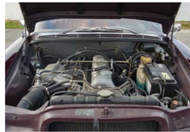
6 MERCEDES Berline 4 portes type 250SE du 10/05/1967, n° de série 10801410037444 de couleur bordeaux, sellerie simili fauve. Moteur 6 cylindres en ligne de 2496 cm 3 à injection, 150CV à 5600 Tr/mn. Boite de vitesses mécanique à 4 Rappports, 4 freins à disques assistés. Jantes acier avec enjoliveurs chromés. Compteur annonçant 32960 km (132960 km supposés), réfection du moteur à 121926 km (facture). Carte grise française normale. 5 000/6 000 €