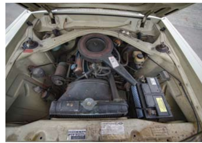
4 FORD Coupé 2 portes type Taunus 17M 1700 du 20/02/1968, n° de série GA33HB47283 de couleur beige, sellerie tissu et simili gris. Moteur V4 de 1699 cm 3 . Boite de vitesses mécanique à 4 rapports. Jantes acier avec enjoliveurs. Compteur annonçant 73215 km. Carte grise française normale (2 e main) avec Bon de commande et garantie ainsi que feuille barrée des Mines. 4 000/5 000 €