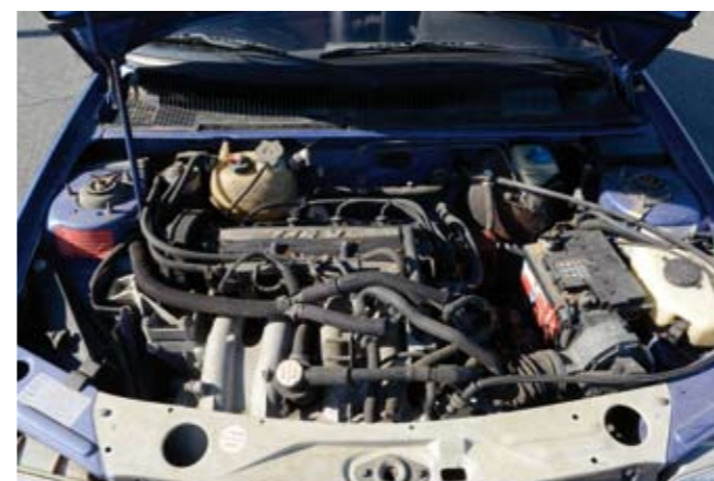
2 UN COACH 3 PORTES DE MARQUE PEUGEOT type 205 GTI 1L9-20CD62 du 30/08/1990 de couleur bleue files rouges, carte grise française, n° de série VF320CD6224068511, Moteur 4 cylindres injection transversal avant de 1905 cm 3 , 16 soupapes, 130 CV à 6000 tr/mn, 9CV fiscaux, boîte de vitesses mécanique à 5 rapports + M.A. Jantes d'origine en alliage léger. Sellerie d'origine simili noir et velours à points rouges. Automobile annonçant 188 820 km au compteur à remettre en route. 7 000/9 000 €