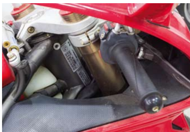
11 UNE MOTOCYCLETTE SOLO 2 PLACES DE MARQUE MV AGUSTA type F4 - LUS19L404002 du 26/01/2001 de couleur rouge, carte grise française, n° de série ZCGF401BBYVOO1477 Moteur 1000 cm 3 4 cylindres en ligne, 7CV fiscaux, annonçant 1 338 km au compteur. 7 000/8 000 €