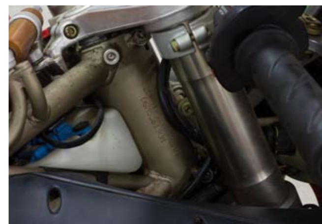
12 UNE MOTOCYCLETTE SOLO DE MARQUE DUCATI type 916 F3 - ZDM91652 Desmoquattro du 13/09/1994 de couleur rouge, carte grise française, n° de série 000070 Moteur bi-cylindre en V 916 cm 3 , 4 temps, 2 ACT, 8 soupapes, injection électronique Weber, refroidissement liquide, 109 CV à 8000 tr/mn, 9 CV fiscaux, annonçant 2313 km au compteur. 6 000/7 000 €