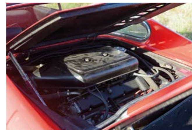
9 UNE BERLINETTE 2 PLACES DE MARQUE FERRARI type Dino 246 du 10/07/1974 de couleur rouge, carte grise française, n° de série 07582. Moteur 135CS V6 transversal central de 2418 cm 3 , trois carburateurs Weber double corps, 195CV à 7600 tr/mn, 14CV fiscaux, boîte de vitesses mécanique à 5 rapports + M.A. Pneumatiques de marque Michelin X montés sur des jantes d'origine en alliage léger. Sellerie d'origine en cuir noir. Automobile annonçant 82291 km au compteur, moteur tournant. 150 000/200 000 €