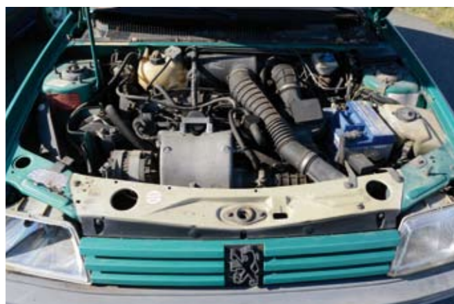
1 UN COACH 3 PORTES DE MARQUE PEUGEOT type 205 GTI 1L9 Griffé (série limitée, Jean Todt) 20CD62 du 28/03/1991 de couleur vert fluorite, carte grise française, n° de série VF320CD6224187141. Moteur 4 cylindres injection transversal avant de 1905 cm 3 , 16 soupapes, 130 CV à 6000 tr/mn, 9CV fiscaux, boîte de vitesses mécanique à 5 rapports + M.A. Jantes d'origine en alliage léger grises. Sellerie d'origine cuir gris. Automobile annonçant 71 884 km au compteur à remettre en route, peinture à revoir. 8 000/10 000 €