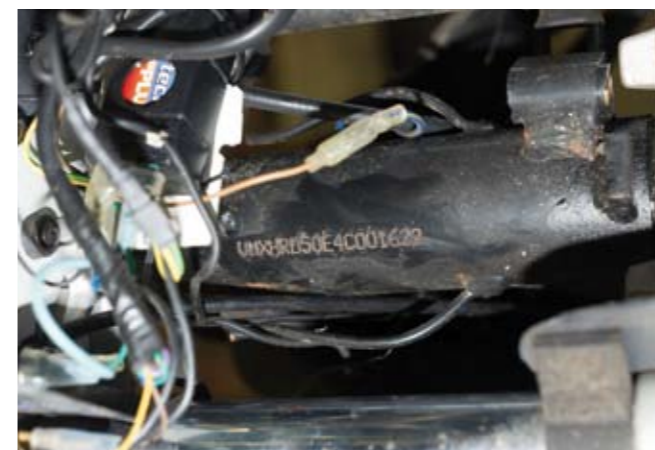
14 UN CYCLOMOTEUR CROSS DE MARQUE SHERCO type Réplia Champion de France sans immatriculation et sans carte grise, moteur 50 cm³ 400/700 €