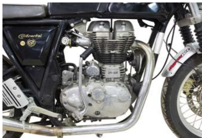
13 UNE MOTOCYCLETTE SOLO 2 PLACES DE MARQUE ROYAL-ENFIELD type Continental GT 535 du 16/09/2015 de couleur noire, carte grise française, n° de série ME3CLEET5FK002900 Moteur mono- cylindre 535 cm3, 29,1 CV à 5100 tr/mn, 6 CV fiscaux, 2° main, fabrication indienne avec 2° pot d'origine et selle bi-place. 3 000/4 000 €