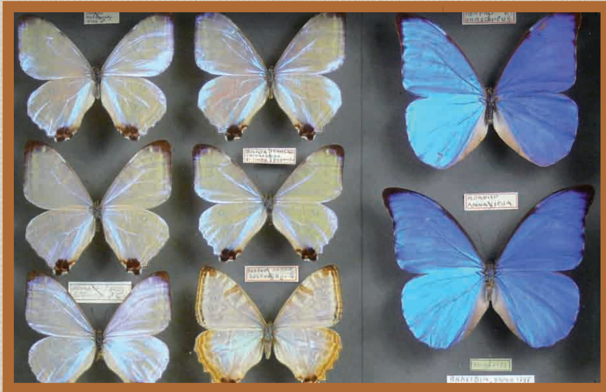
Détail lot 144