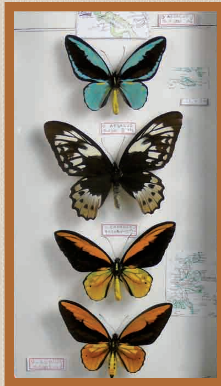
Détail lot 245

Once the hammer falls, the new buyer becomes the owner and so becomes responsible for the lot. Please note that purchases can only be collected after payment in full. For people who bought by telephone, via absentee bid or live, items can be sent by mail. For this service, please contact the company mentioned on your invoice who will be in charge of the packaging and the shipment.