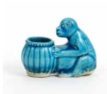
257 Rince-pinceau Porcelaine à glaçure bleu turquoise et biscuit représentant un singe tenant un récipient Chine, Epoque Qinq H 5,5, L 5,5 cm Etiquette Pierre Saqué 150 / 200 €