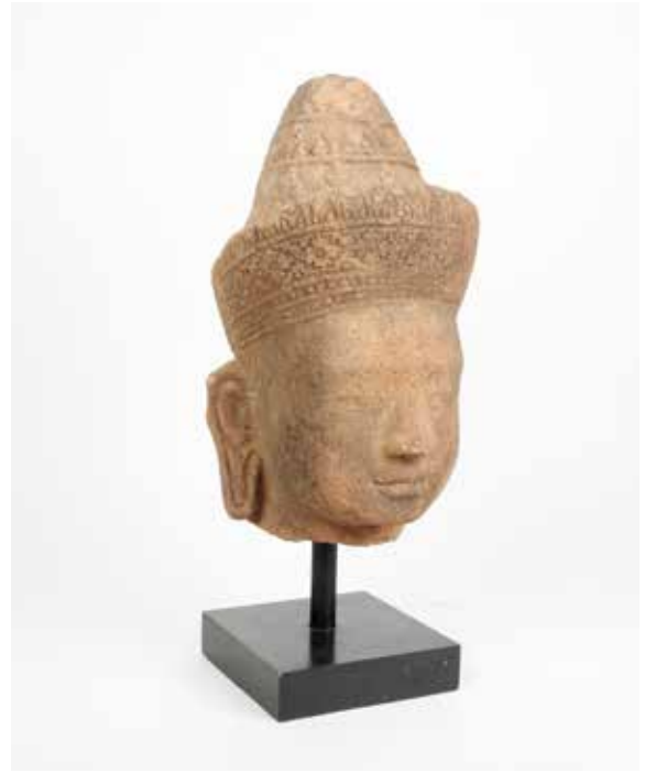
114 Tête de Vishnu Grès beige Cambodge, 12-13 e ème siècle H 32 cm 2500 / 3000 €