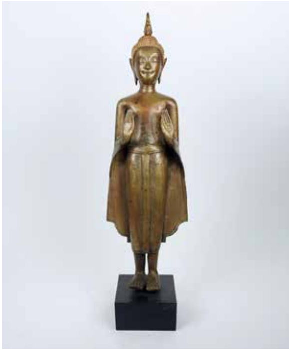
113 Bouddha debout en position d'accueil et d'absence de crainte Bronze à patine cuivrée Usnisha amovible Laos, XVIII e siècle H 47 cm 2000 / 2200 €