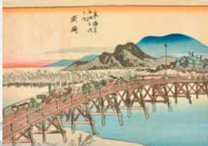
398 Utagawa Hiroshige Okazaki Les 53 stations du Tokaido Gravure sur bois 120 / 150 €