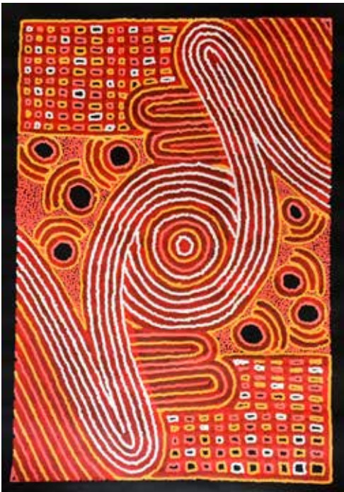
378 Narpula Scobie Napurrula ( Née en 1950) Women's Body Paint, 2010 Acrylique sur toile 90 x 60 cm Certificat d'authenticité remis à l'acquéreur 1800 / 2200 €