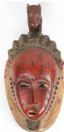
58 Masque surmontée d'un animal Bois polychrome République de Côte d'Ivoire, ethnie Baoulé H 55 cm 1200 / 1500 €