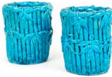
228 Paire de bitongs

Porcelaine et émaux de la famille rose à décor central de fleurs et de médaillons dans des semis sur l'aile Chine, XVIII e siècle Diam 22,5 cm 400 / 600 €