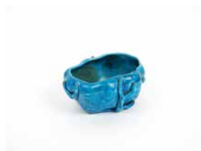
255 Instrument de lettré Rince pinceau en porcelaine à glaçure bleu turquoise à décor naturaliste de végétaux Chine, époque Qinq H 4,5 cm (petits accidents) 300 / 400 €