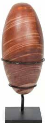
337 Shiva Lingam

Madagascar Ère Jurassique L 20 cm 180 / 200 €