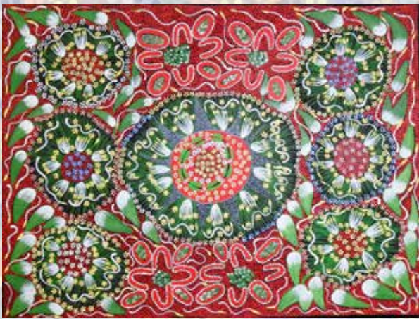
367 Eunice Rêve de la banane du désert Toile 130 x 100 cm 1200 / 1500 €