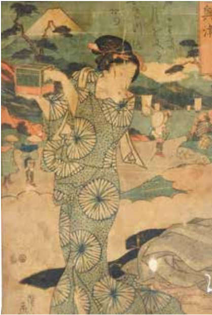
403 Keisai Eisen Belle femme Gravure sur bois Date vers 1847-1851 100 / 120 €