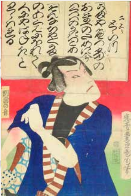
395 Utagawa kunisada Acteur de Kabuki Gravure sur bois Vers 1840 80 / 120 €