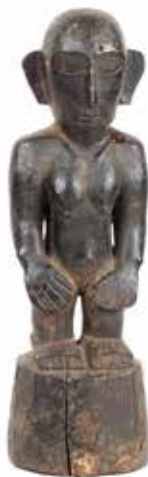
341 Bulul Tinagtao Gardien de rizière

Couleur saumonée, sur socle Tibet H 9 cm 100 / 120 €