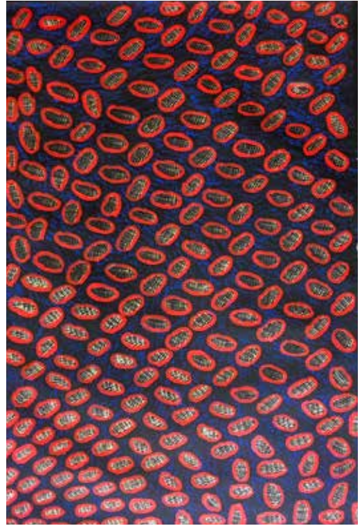
377 Gnoia Pollard Swamps near Talarada, 2010 Acrylique sur toile de lin 90 x 60 cm Certificat d'authenticité remis à l'acquéreur 1500 / 2000 €