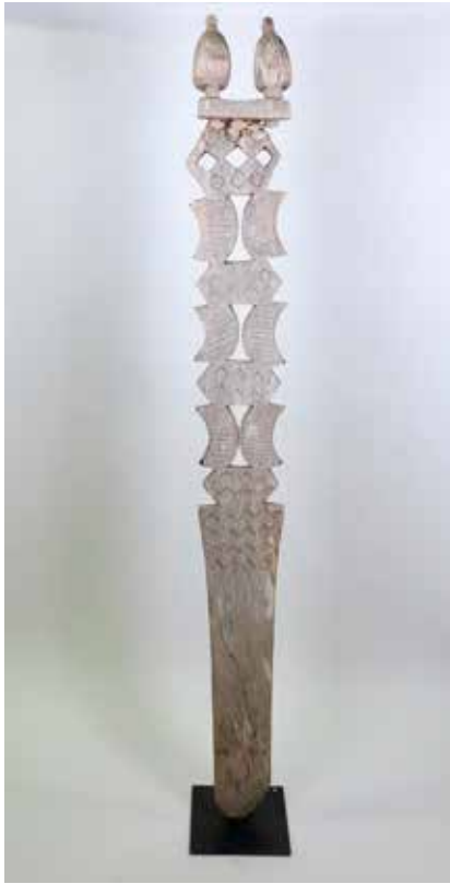
50 Poteau Aloalo figurant deux oiseaux Poteau protecteur en honneur aux ancêtres Bois raviné par les éléments naturels Madagascar, ethnie Aloalo, XIXème siècle Ancienne collection franco-italienne H 175 cm 5200 / 5500 €