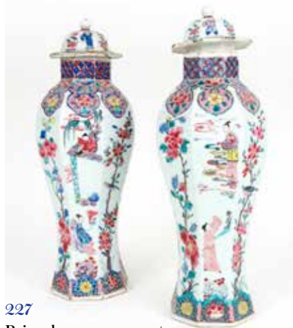
227 Paire de vases couverts

Porcelaine à couverte brun manganèse de forme irrégulière reprenant les formes végétales Chine, époque Qing H 3,5, l 7,5 cm (très légères égrenures) Etiquette ancienne Pierre Saqué 100 / 120 €