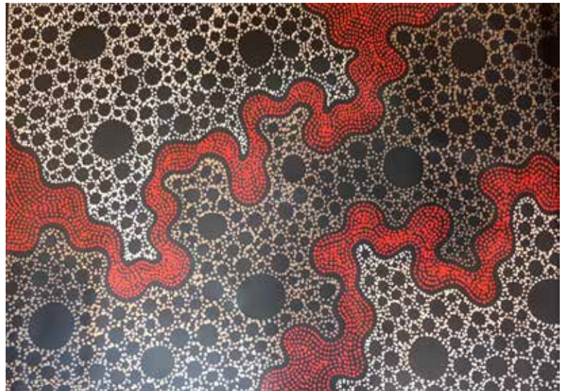
379 Tammy Matthews Taranora, 2012 Acrylique sur toile 72 x 110 cm Certificat d'authenticité remis à l'acquéreur 800 / 1200 €