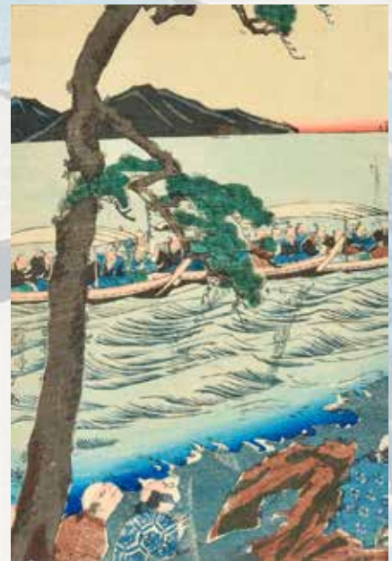
401 Utagawa Yoshifusa Gravure sur bois Date vers 1870 100 / 120 €