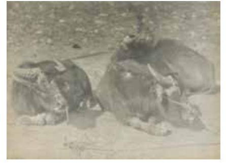
408 Animaux sacrés Epreuve d'époque 200 / 250 €