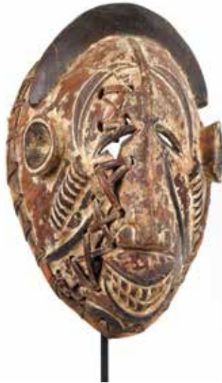
53 Masque Bois polychrome sculpté et kaolin Fibres végétales Nigeria, ethnie Igbo H 31 cm 800 / 1000 €