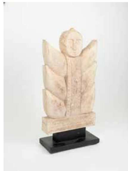
343 Stèle de tombe (penji), culte des ancêtres

Pierre calcaire Îles Sumba H 37 cm 400 / 600 €