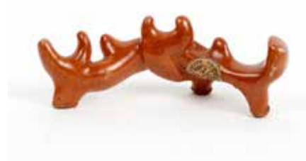
258 Repose-pinceaux Porcelaine à glaçure rouge corail Chine, époque Qinq L 10 cm Etiquette Pierre Saqué 150 / 200 €