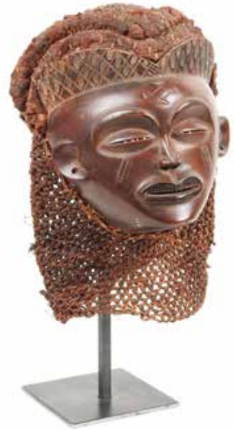
55 Masque Pwo Bois sculpté Bois rouge Angola, ethnie Tschockwe H 21 cm 1000 / 1500 €