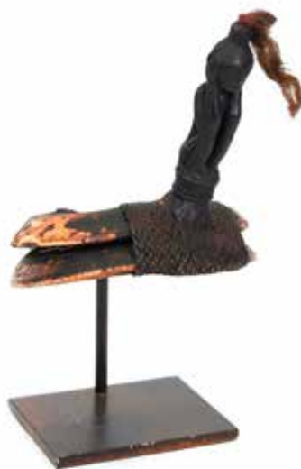
339 Bracelet cérémoniel

Pierre sacrée polie retrouvée dans l'une des sept rivières sacrées de l'Inde la Narmadâ H 18 cm 220 / 250 €