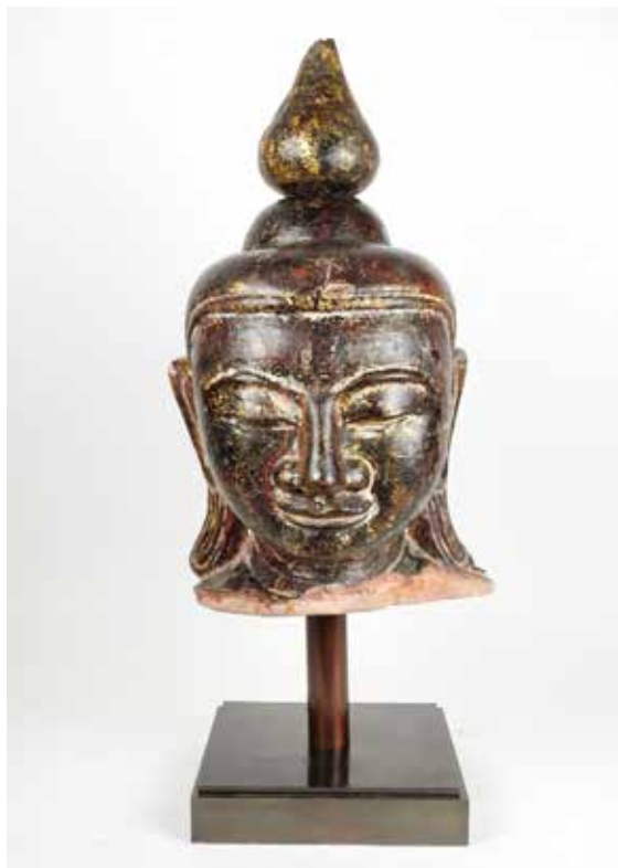
115 Tête de bouddha Grès Rose laqué et doré Usnisha amovible Birmanie, Royaume des Etats Shan, XVIII e siècle H 45 cm 4200 / 4500 €