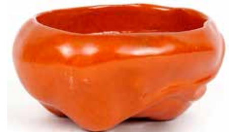
232 Petit rince-pinceaux

Porcelaine à glaçure bleue turquoise figurant un champignon à excroissances Décor sous couverte Chine, époque Qing H 18,5 cm (restaurations anciennes) 800 / 1000 €