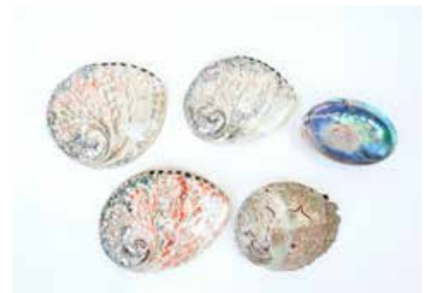
321 Ensemble de cinq ormeaux ou haliotis naturels et rufescens Couleurs nacrées L 12 à 18 cm 550 / 600 €