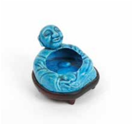
251 Instrument de lettré Rince-pinceau Porcelaine à glaçure bleu turquoise à décor sous couverte figurant un sage assis son corps formant réceptacle Chine, époque Qinq H 6 cm (socle en bois exotique rapporté) 120 / 150 €