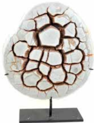
316 Tranche de Septeria Madagascar Ere jurassique H 32,5, Diam 30 cm 1000 / 1200 €