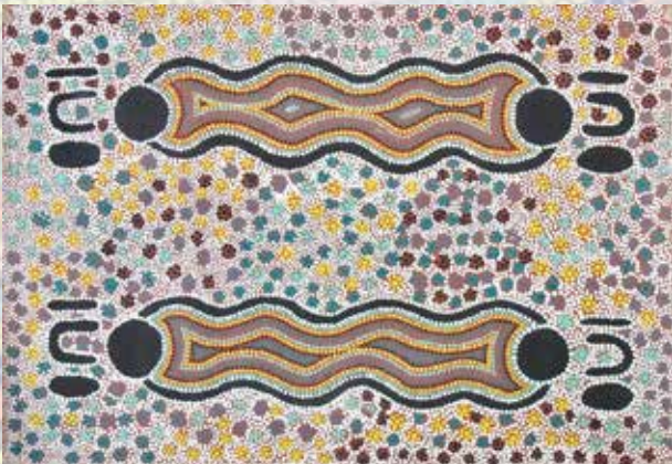
368 Anonyme Aborigène Sans titre Toile 130 x 100 cm 600 / 800 €