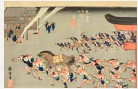
400 Utagawa Hiroshige Miya Les 53 stations du Tokaido Gravure sur bois 120 / 150 €