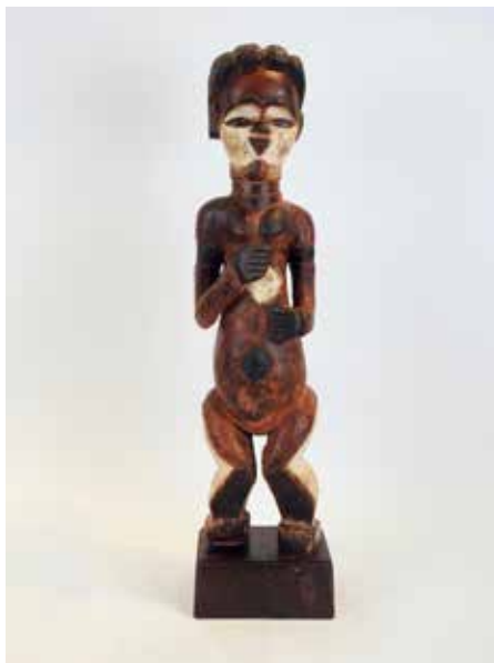
17 Statue de jeune homme debout Bois sculpté polychrome à traces de kaolin Gabon, ethnie kwelé H 61 cm 1800 / 2000 €