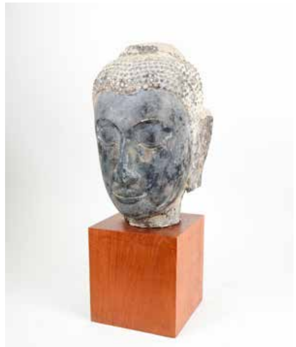
Tête de bouddha en grès laqué Coiffure de fines bouclettes Thaïlande, ancienne capitale des Siam, Ayutthaya XVII e ème siècle H 40 cm 3800 / 4000 €