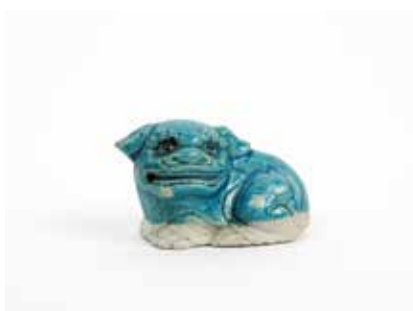
256 Chien de fo Porcelaine à glaçure bleu turquoise et biscuit à décor sous couverte Chine, époque Qinq H 4,5 cm Etiquette Pierre Saqué 120 / 150 €