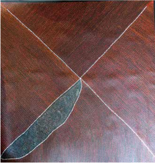
376 Kathleen Petyarre ( Née en 1940) Groupement Utopia Mountain Devil Lizard dreaming, 2010 acrylique sur toile 94 x 93 cm Peintre présent dans les principaux musées et les collections privées Certificat d'authenticité remis à l'acquéreur 3000 / 3500 €