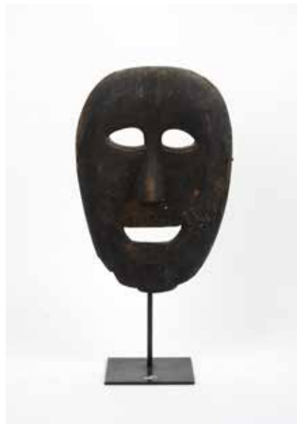
54 Masque chamanique Bois à patine croûteuse Népal, XVIII-XIX° H 25 cm 800 / 1200 €