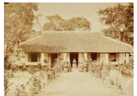
410 Monastère Indochine Epreuve d'époque 200 / 250 €