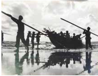
405 Van Huy Entraide entre pêcheurs, Cholon, Viet- nam, vers 1965 Epreuve argentique d'époque 290 x 390 mm Etiquette légendée et tampon de présence à une exposition à Johannesburg au verso 200 / 250 €