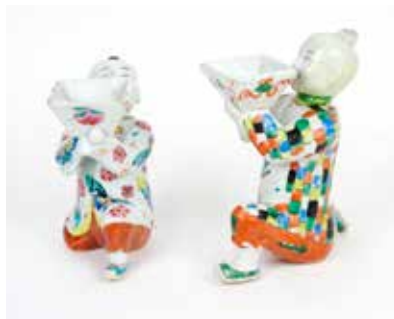
230 Paire de vases soliflores

Porcelaine et émaux de la famille rose à décor de scènes de cour et lambrequins fleuris Chine, époque Qing H 32,5 cm (égrenures) 400 / 600 €