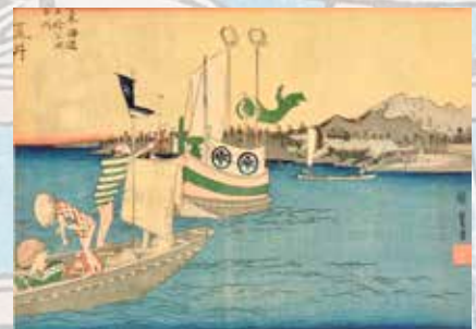
402 Utagawa Hiroshige Aray Les 53 stations du Tokaido Gravure sur bois 120 / 150 €