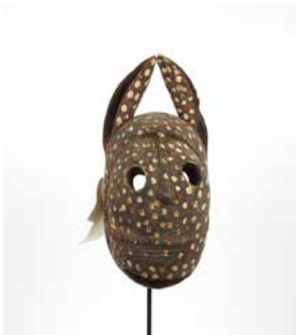
51 Masque zoomorphe Tête de lion et cornes Bois sculpté et pigments Mali, ethnie Bozo H 33 cm 600 / 800 €