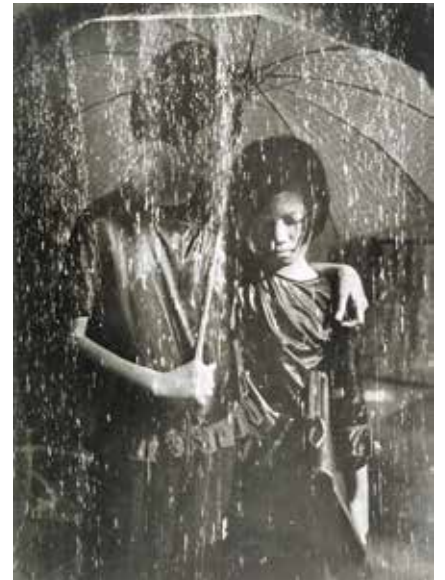
409 Enfants sous parapluie Indochine Epreuve d'époque 300 / 400 €