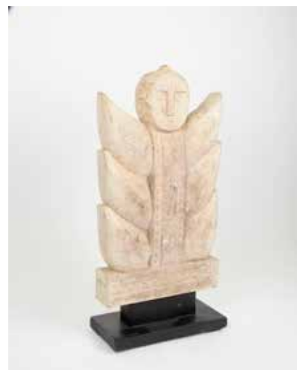
344 Grande tranche de bois pétrifié

Pierre calcaire Îles Sumba H 37 cm 400 / 600 €