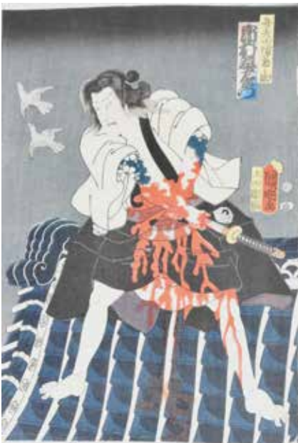
404 Utagawa Kuniaki Scène d'arakiri Estampe coloriée H 37,5 x 37,5 cm vers 1860 100 / 120 €