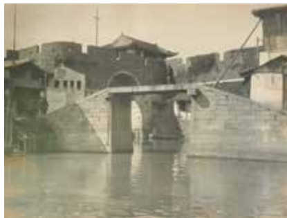
407 Paysage D'Indochine Epreuve d'époque 200 / 250 €