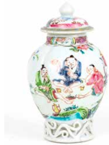
231 Petit vase couvert

Porcelaine ajourée à glaçure bleue turquoise figurant des bambous Chine, époque Qing H 11 cm 300 / 400 €