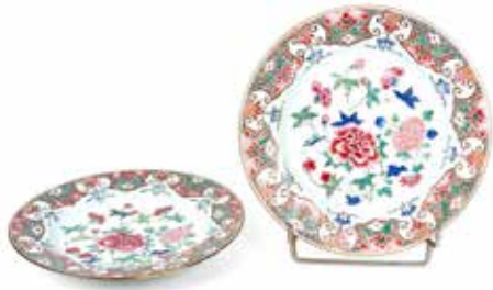
225 Paire d'assiettes

Porcelaine et émaux de la famille rose à décor central de fleurs et de médaillons dans des semis sur l'aile Chine, XVIII e siècle Diam 22,5 cm 400 / 600 €