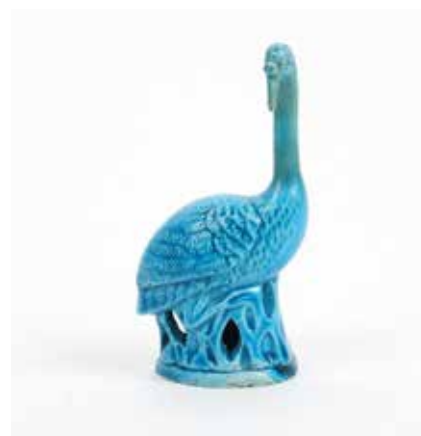
259 Paon Porcelaine à glaçure bleu turquoise à décor sous couverte sur un tertre traité au naturel Chine, époque Qinq H 9,5 cm (restaurations au cou) 100 / 120 €