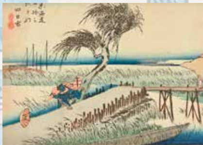
399 Utagawa Hiroshige Yotsukaichi Les 53 stations du Tokaido Gravure sur bois 120 / 150 €