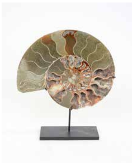
336 Ammonite tranchée

Madagascar Ère Jurassique L 20 cm 180 / 200 €