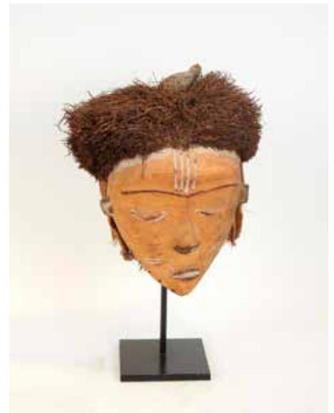
18 Masque dit de maladie bois polychrome sculpté et traces de kaolin avec tissu tressé en fibres végétales République démocratique du Congo, ethnie Pende Ancienne collection Galerie Darteville H 34 cm 1500 / 1700 €