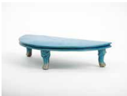
254 Sellette tripode Porcelaine à glaçure bleu turquoise, les pieds ornés de têtes de chimères Chine, époque Qinq H 5,5, L 24 cm Etiquette Pierre Saqué 400 / 600 €