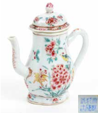
253 Petite verseuse couverte Porcelaine et émaux de la famille rose à décor de fleurs de pivoines, oiseaux et fleurettes Marque au revers Chine, XVIII e siècle H 12 cm (petit accident) 250 / 300 €