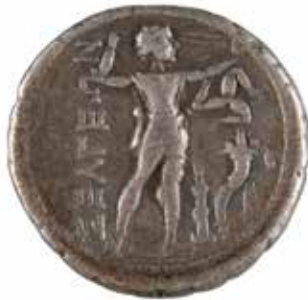
40 PISIDIE SELGE Statère A/ Lutteurs s'affrontant R/ Frondeur debout à droite 300-190 avant J.-C. Argent 8.76 gr 120/150