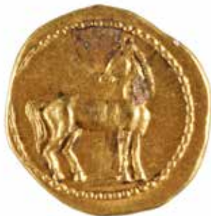
46 ZEUGITANIE CARTHAGE 1/5ème de statère A/ Tête de Tanit à gauche R/ Cheval la tête tournée vers la gauche 350-320 avant J.-C. Or 1.56 gr 500/600