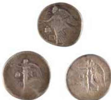
41 PAMPHYLIE SIDE Tétradrachme Lot de 3 monnaies A/ Tête d'Athéna à droite R/ Niké volant à gauche II e siècle avant J.-C. Argent 16.04, 16.09 et 16.50 gr 200/220