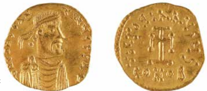
144 CONSTANTIN IV, HÉRACLIUS et TIBÈRE Trémissis A/ Buste de l'empereur à droite R/ Croix potencée 668-681 Or 1,43 gr 150/180