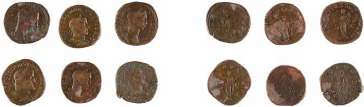
180 EMPIRE ROMAINE Lot de six sesterces d'Alexandre Severe, Maximinus, et Gordien III, revers variés Bon ou très bon état 250/300