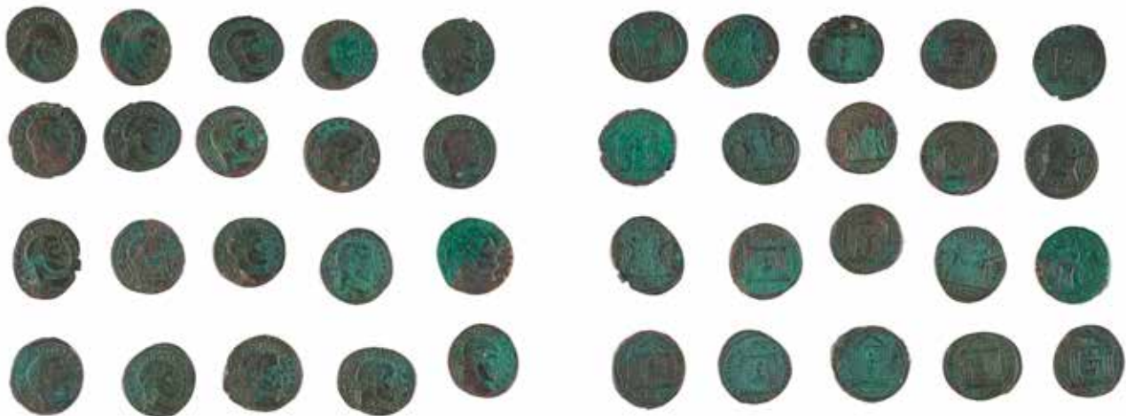
181 MAXENCE Important lot de follis, revers au temple ou aux dioscures 20 monnaies 180/200