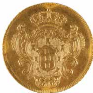
173 PORTUGAL Marie lère Pièce de 6400 Reis ou 4 escudos Or 14.05 gr 400/500