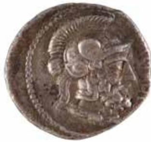
45 CILICIE TARSE Satrape Datames Statère A/ Tête d'Aréthuse R/ Tête de guerrier barbu 372 avant J.-C. Argent 10.23 gr 150/180