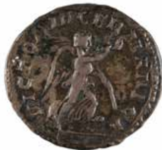
119 HERENNIUS ETRUSCUS Antoninien A/ Buste radié à droite R/ Victoire marchant à droite 251 après J.-C. Argent 4.06 gr 80/100