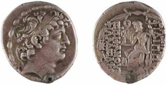
69 SYRIE ROYAUME SELEUCIDE Philippe Philadelphie Tétradrachme A/ Tête de Philippe R/ Zeus assis Atelier d'Antioche 1er siècle avant Argent 15.64 gr Traces de monture 150/180