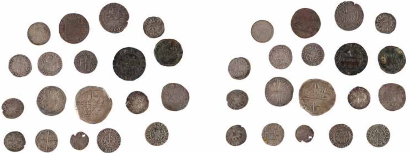
164 MONDE MEDIEVAL Intéressant lot de monnaies féodales ou royales en argent, dont Cilicie Arménie, Rhodes Rogers de Pins, Louis XIV, Venise, etc. Qqs monnaies douteuses On y joint 3 monnaies de Venise en bronze 180/200