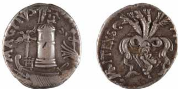
87 SEXTUS POMPEE Denier A/ Vue du port de Messine R/ Scylla le monstre marin 42 avant J.-C. Argent 3,69 gr 160/180