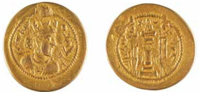
73 ROYAUME SASSANIDE Imitation d'un dinar Electrum 6.76 gr 300/400