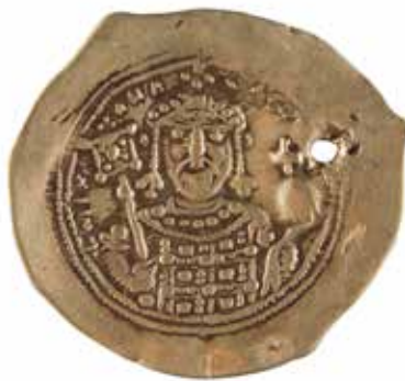
153 MICHEL VII DOUKAS Histamenon A/ Buste du christ de face R/ Buste de l'empereur de face 1071-1078 Or 4.22 gr monnaie percée 120/150