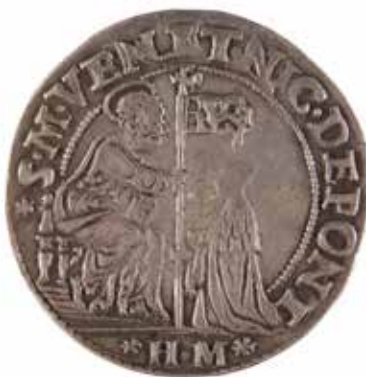
167 VENISE Nicolas Da Ponte A/ St Marc bénissant le doge R/ Ste Justine de Padoue de face 1578-1585 Argent 8.92 gr 60/80