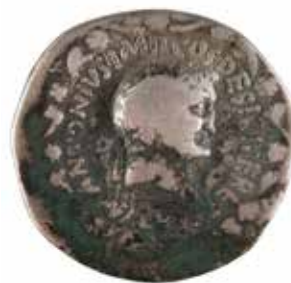
92 EPHESE MARC ANTOINE ET OCTAVIE Cistophore A/ Tête de Marc Antoine auréole dans une couronne dionysiaque R/ Tête nue d'Octavie posée sur la ciste et entourée de deux serpents 39 avant J.-C. Argent 11.52 gr 100/120