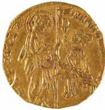
165 VENISE Pierre Gradenigo Ducat A/ St Mars bénissant le doge R/ Christ bénissant 1289-1311 Or 3.51 gr 200/300