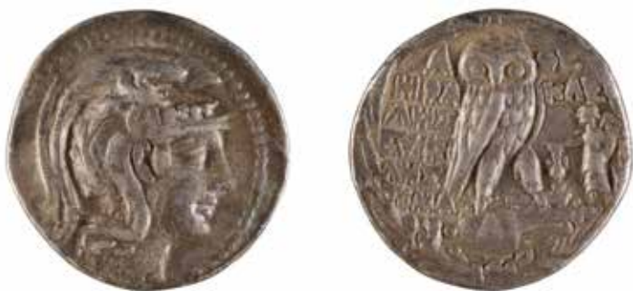
15 ATTIQUE ATHENES Tétradrachme stéphanophore A/ Tête d'Athéna R/ Chouette 186-86 avant J.-C. Argent 16,36 gr 100/120