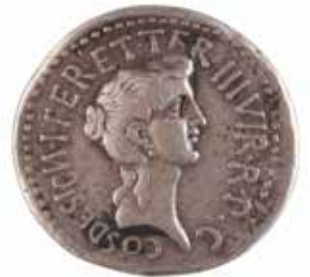
91 ROME MARC ANTOINE ET OCTAVE Denier A/ Tête nue de Marc Antoine R/ Tête nue d'Octave 41 avant J.-C. Argent 3.85 gr