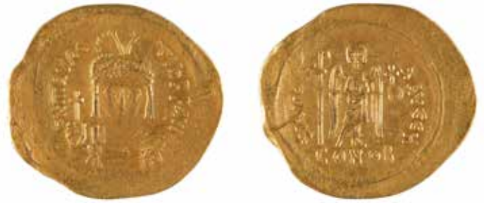
142 MAURICE TIBERE Solidus A/ Buste de Maurice Tibere de face R/ Ange debout de face 582-602 Or 4,34 gr 300/400