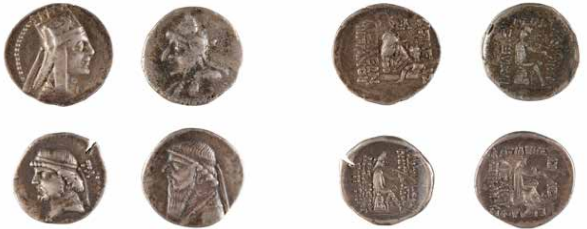
72 ROYAUME PARTHE Ensemble de 4 drachmes en argent 150/180