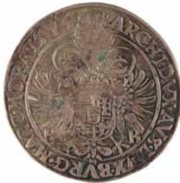
172 MAXIMILIEN II Thaler A/ Maximilien à droite R/ Armoiries 1574 Argent 28.60 gr 140/160