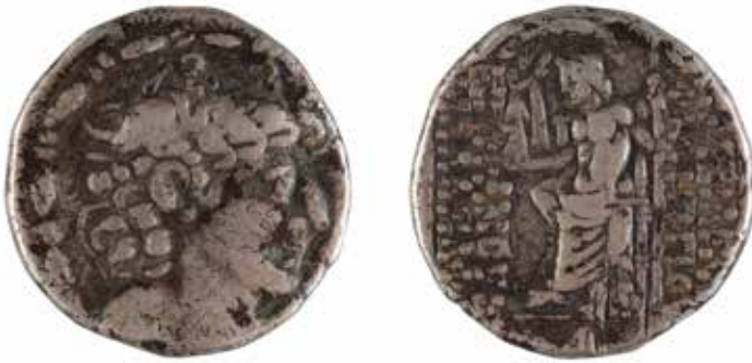
70 SYRIE ROYAUME SELEUCIDE Philippe Philadelphie Tétradrachme A/ Tête de Philippe R/ Zeus assis Atelier incertain 1er siècle avant Argent 15.35 gr 50/60