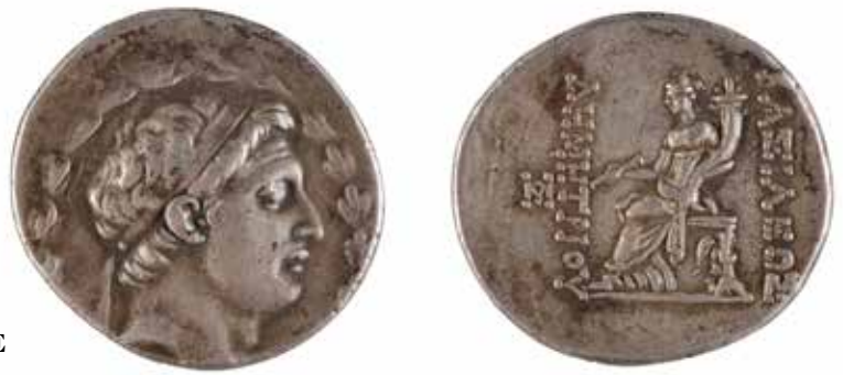
66 SYRIE ROYAUME SELEUCIDE Démétrius Ier Tétradrachme A/ Tête de Démétrius à droite R/ Tyché assise tenant une corne d'abondance Atelier de Tarsos II e siècle avant J.-C. Argent 16.89 gr 200/220