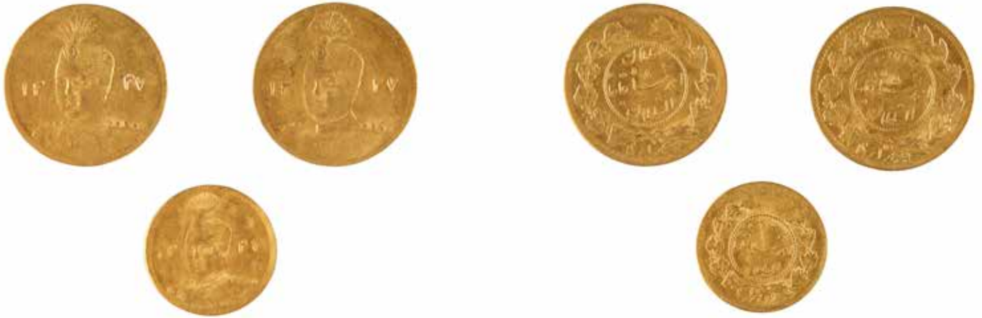
163 IRAN Ahmad Shah Ensemble de trois pièces comprenant deux 1/2 toman, et 1/5 toman Or 3.56 gr au total 120/150