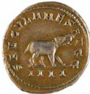
118 OTACILIA SEVERA Antoninien A/ Buste diadémé et lauré R/ Hippopotame passant à droite 248 après J.-C. Billon doré pour probablement imiter un auréus 4.16 gr 60/80