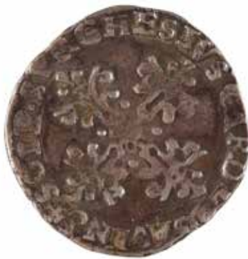
171 AVIGNON Demi franc de Paul V A/ Buste à droite R/ Croix fleuronée 1609 Argent 6.71 gr 100/120