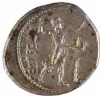
39 PAMPHYLIE ASPENDOS Statère A/ Lutteurs s'affrontant R/ Frondeur debout à droite 300-250 avant J.-C. Argent 10.03 gr 250/280