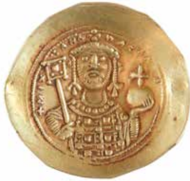
151 MICHEL VII DOUKAS Histamenon A/ Buste du christ de face R/ Buste de l'empereur de face 1071-1078 Or 4.25 gr 200/250