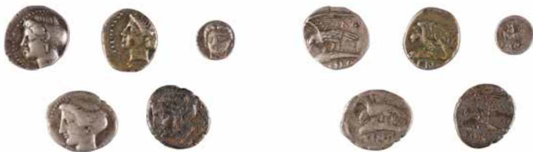
16 PAPHLAGONIE SINOPE Ensemble de quatre drachmes A/ Tête de la nymphe Sinope R/ Aigle et dauphin 330-300 avant J.-C. Argent 4.40, 4.70, 5.42 et 5.94 gr 1/4 de drachme A/ Tête de la nymphe Sinope R/ Aigle de face IV-IIIème siècle avant J.-C. Argent 1,38 gr 200/220