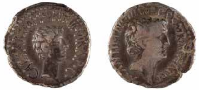
90 MARC ANTOINE ET OCTAVE Denier A/ Tête nue de Marc Antoine à droite R/ Tête nue d'Octave à droite Ca 41 avant J.-C. Argent 3.59 gr 120/150