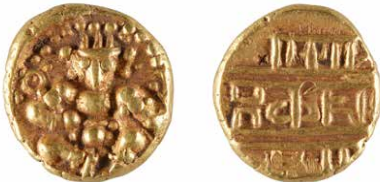
182 INDE Nayakas de Chitradurga Pagode d'or 3,37 gr 100/120