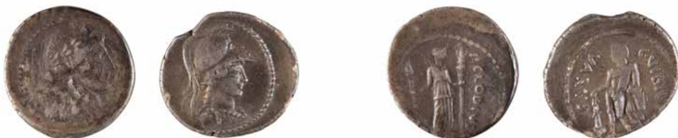
89 REPUBLIQUE ROMAINE Ensemble de deux monnaies comprenant : CLAUDIA Denier A/ Tête laurée d'Apollon à droite R/ Diane debout de face 42 avant J.-C. Argent 4,02 gr