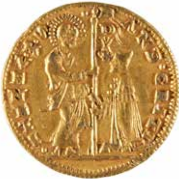
166 VENISE Andréa Gritti Sequin A/ Le doge agenouillé devant St Marc R/ Christ bénissant 1523-1539 Or 3.48 gr 200/300