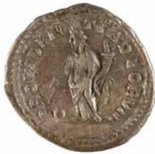
117 MACRIN Denier A/ Buste lauré de Macrin à droite R/ Providentia tenant une corne d'abondance 218 après J.-C. Argent 2.87 gr 120/150