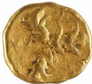
47 CYRENAIQUE Hemidrachme A/ Tête d'Athéna casquée R/ 3 sylphions 435-331 av. J.-C. Or 2.16 gr 500/600