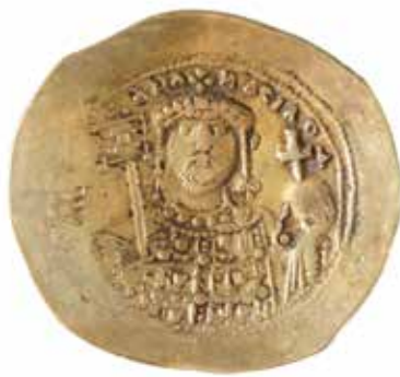
152 MICHEL VII DOUKAS Histamenon A/ Buste du christ de face R/ Buste de l'empereur de face 1071-1078 Or 4.36 gr 200/250