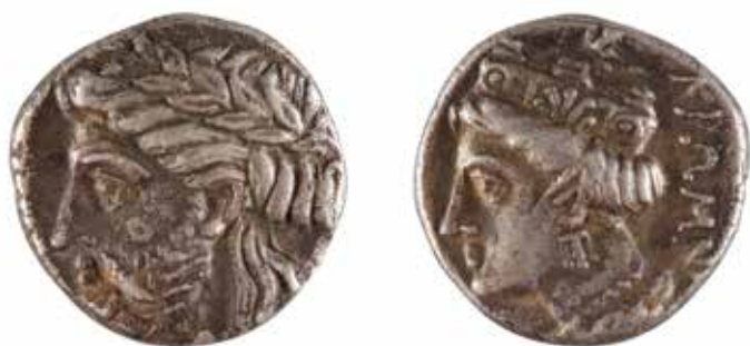
17 PAPHLAGONIE KROMNA Tetrobole A/ Tête de Zeus à gauche R/ Tête de Tychée à gauche 350-300 avant J.-C. Argent 3,56 gr 200/220