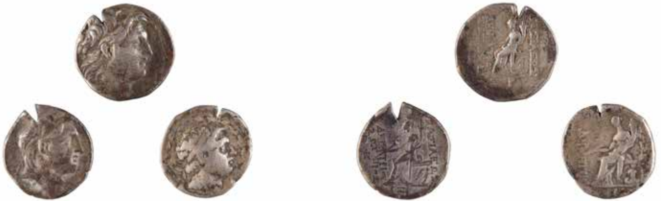
67 SYRIE ROYAUME SELEUCIDE Démétrius Ier Ensemble de 3 tétradrachmes A/ Tête de Démétrius à droite R/ Tyché assise tenant une corne d'abondance II e siècle avant J.-C. Argent 16.21, 16.47 et 16.56 gr 150/200