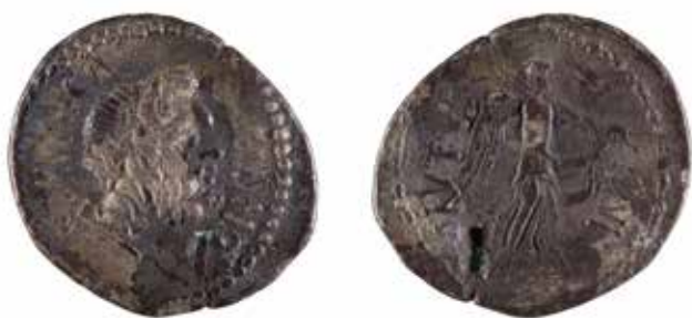
88 BRUTUS Denier A/ Tête de Neptune à droite R/ Victoire à droite 42 avant J.-C. Argent fourré 3,59 gr 120/150