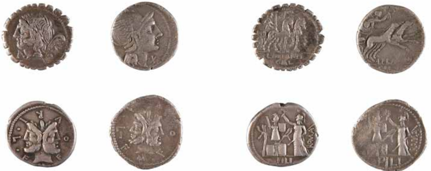
74 REPUBLIQUE ROMAINE Ensemble de quatre monnaies comprenant : FURIA Denier A/ Tête barbue de Janus R/ Victoire, captifs et trophées 119 avant J.-C. Argent 3.81 gr