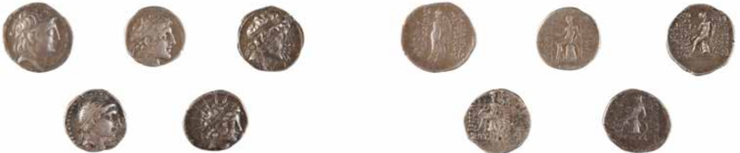
71 ROYAUME SELEUCIDE Ensemble de 5 monnaies en argent Fin du 1er millénaire avant J.-C. 180/200