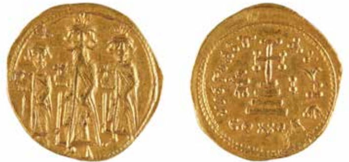
143 HERACLIUS, HERACLIUS CONSTANTIN et HERACLONAS Solidus A/ Trois empereurs en pied R/ Croix potencée 638-641 Or 4,32 gr 300/400