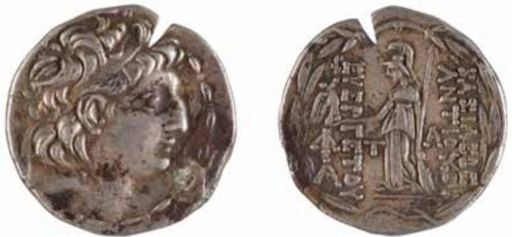
68 ROYAUME DE CAPPADOCE Ariarathes VII Philometor Tétradrachme posthume au nom et au type d'Antiochus VII Sidetes A/ Tête diadémée d'Antiochus VII R/ Athéna casquée tenant une victoire II e siècle avant J.-C. Argent 16.30 gr 150/180