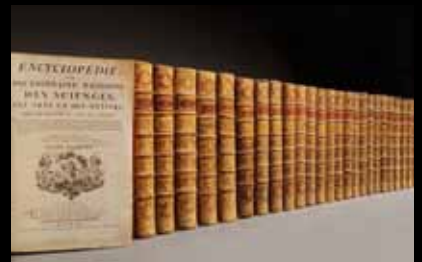
Diderot et d'Alembert Encyclopédie 75 000 €