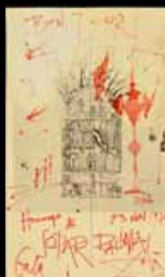
Salvador Dali Sopar Palinia 6 000 €