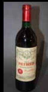
Petrus Pomerol 1982 3 410 €