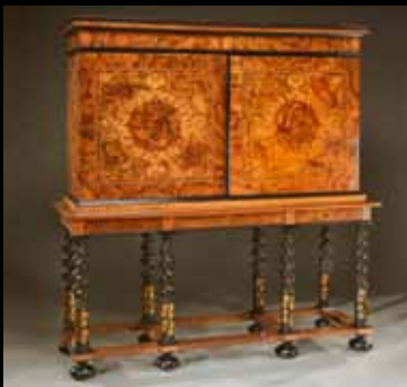
Grand cabinet XVII ème siècle 40 000 €