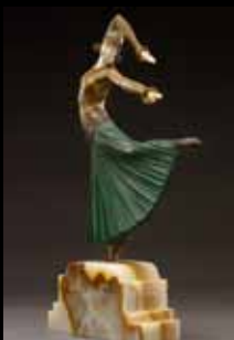
Déméter Chiparus Ayouta 43 750 €