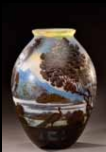
Gallé - Vase à décor de lac de Côme 13 500 €