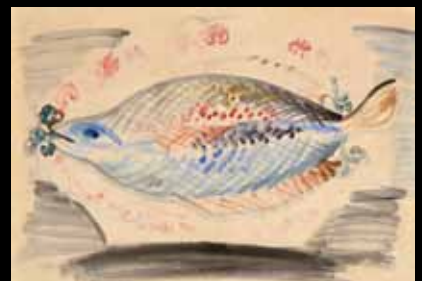
Raoul Dufy La Barbué 17 500 €