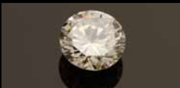
Diamant 6,33 cts 38 125 €