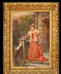
Louis Emile Villa L'Automne 26 250 €

Si vous souhaitez inclure des lots dans nos ventes, merci de contacter la maison de vente clôture des catalogues un mois avant la vente.