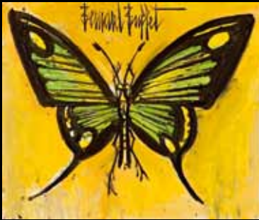
Bernard Buffet - Papillon vert 65 000 €