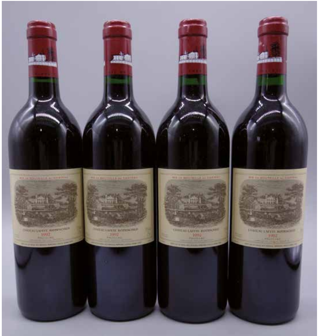
LOT 2. 4 BOUTEILLES CHÂTEAU LAFITE ROTHSCHILD GCC1 Pauillac, 1992. 1 500 / 1 600 €

Couverture : LOT 11. LA TACHE (GRAND CRU). Domaine de la Romanée Conti, 1989 2 100 / 2 300 € LOT 12. LA TACHE (GRAND CRU). Domaine de la Romanée Conti, 1989 2 100 / 2 300 €