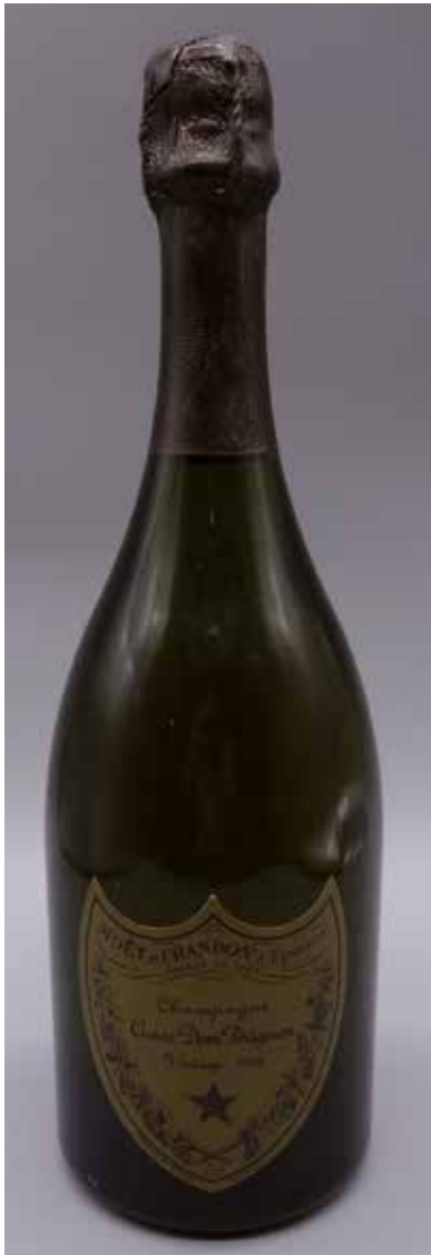
LOT 90. CHAMPAGNE DOM PÉRIGNON (COFFRET). Moët & Chandon, 1976. 240 / 260 €