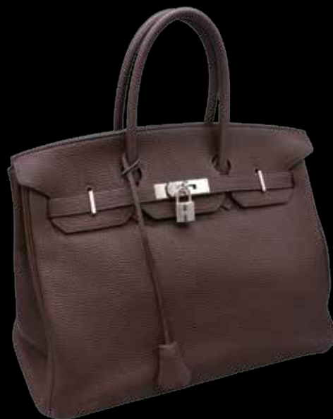
Hermès Paris made in France. Sac Birkin 35 cm en cuir grainé chocolat.

VENTES AUX ENCHÈRES - ESTIMATIONS - EXPERTISES - ASSURANCES