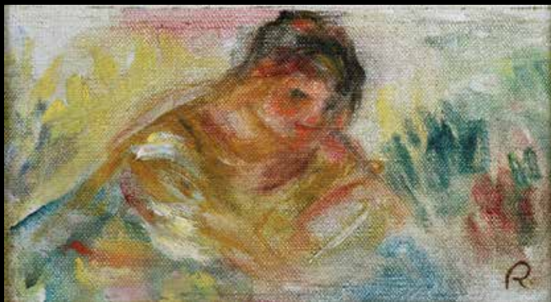
Auguste Renoir (1841-1919) Femme en buste, 1916

MOBILIER & OBJETS D'ART TABLEAUX ANCIENS & MODERNES