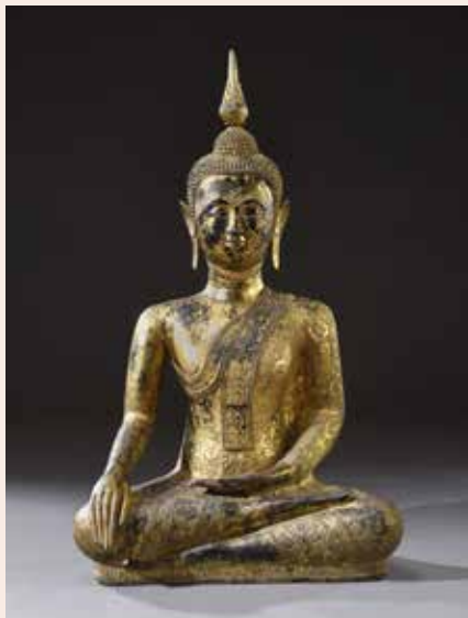
BOUDDHA EN BRONZE DORÉ. Siam, période Rattanakosin, XVIII e - début XIX e s. 4 000 / 6 000 €