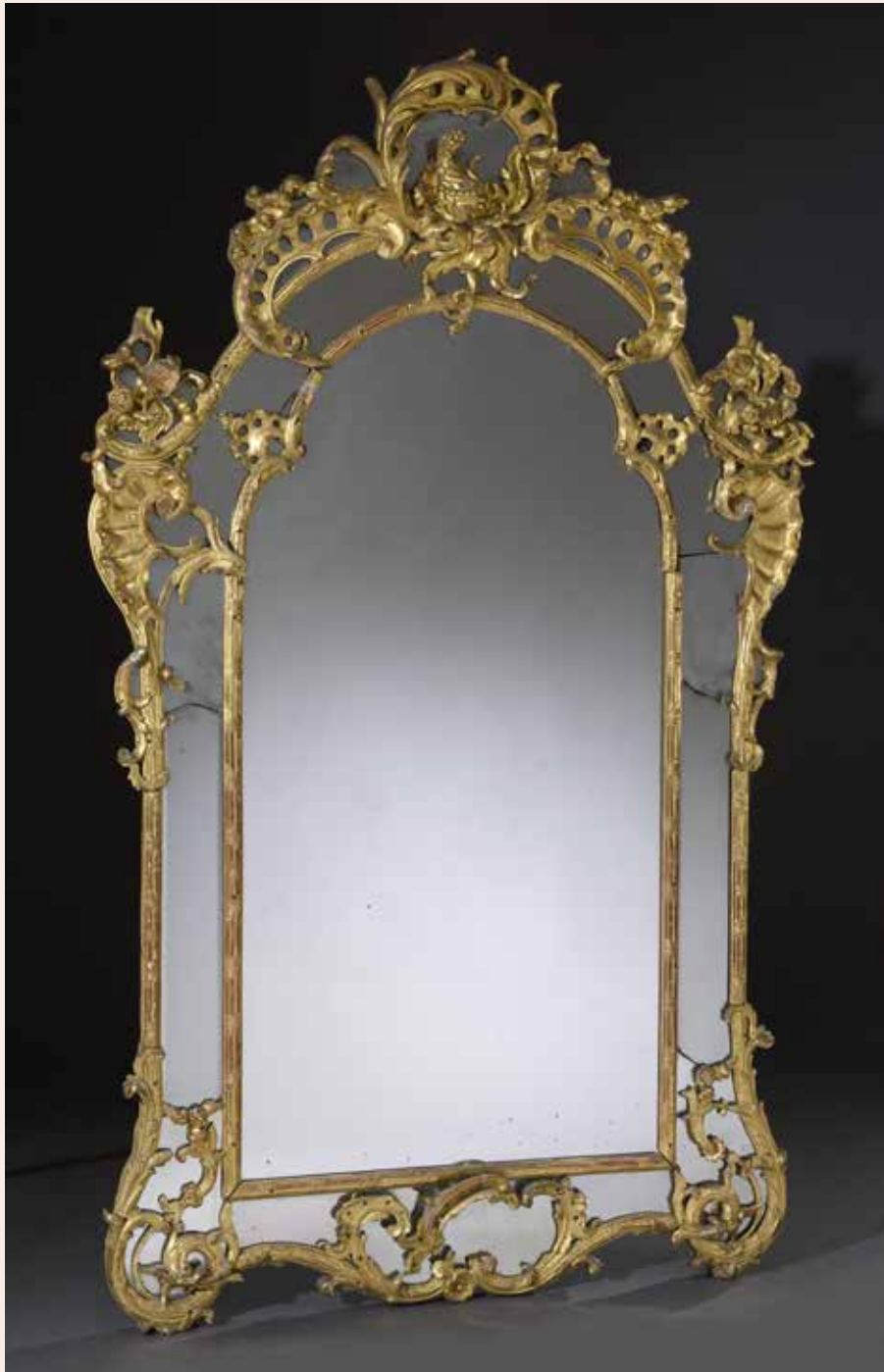
130. GRAND MIROIR À PARCLOSES en bois sculpté et doré, encadrement à double baguettes moulurées, enrubannées, sculptées de coquilles, feuillages, queues-de-cochon, fleurs et grenade éclatée. Début du XVIII e s. H. 204 cm x L. 121cm Accidents, restaurations, manques, reprises à la dorure.