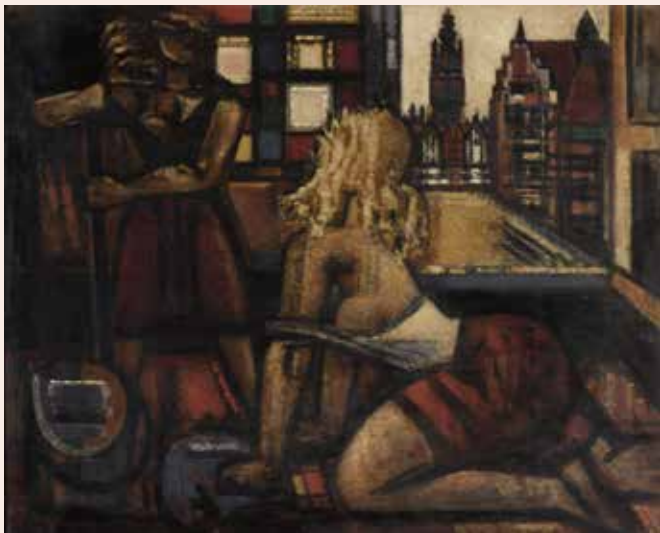
MARCEL GROMAIRE (1892-1971). Le samedi en Flandres, 1949. Huile sur toile. 7 000 / 12 000 €