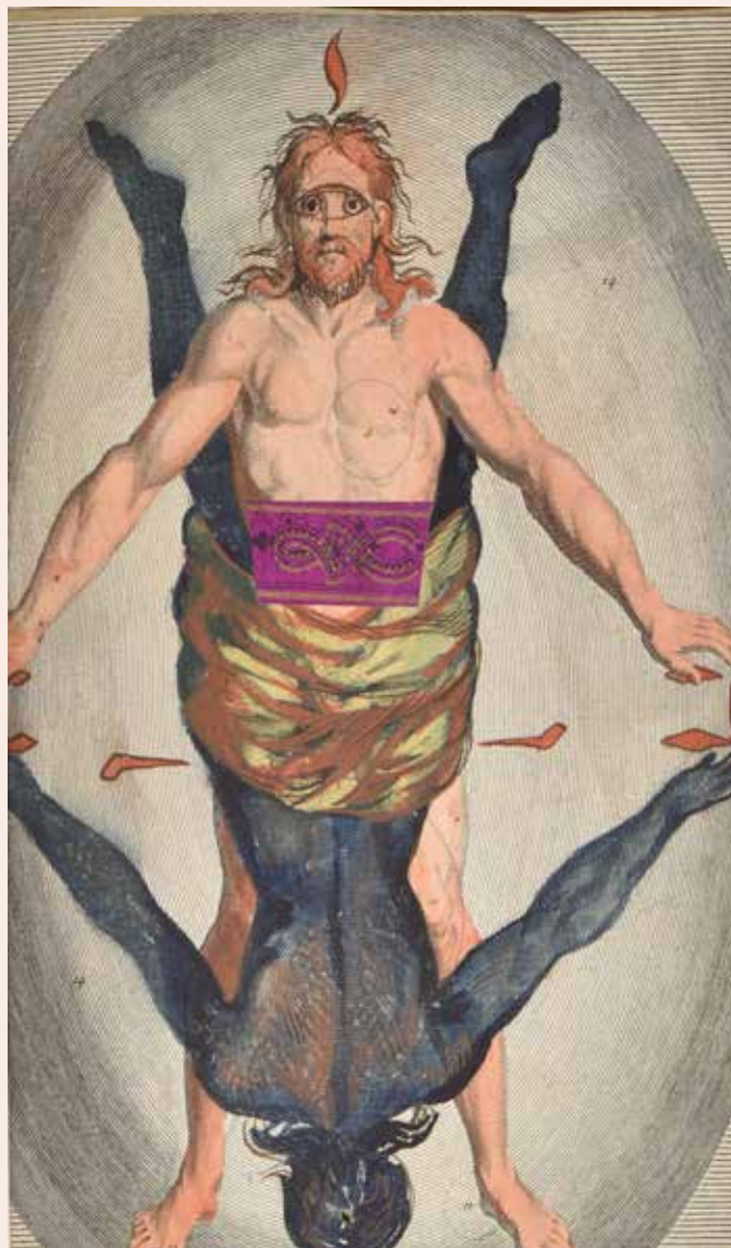
ELIPHAS LEVI. [MANUSCRIT]. La sagesse des anciens, 1874. Un volume, in-4, demi-reliure de l'époque. 20 000 / 30 000 €

NOUS SOMMES A VOTRE DISPOSITION SI VOUS SOUHAITEZ INCLURE DES LOTS DANS CETTE VENTE.