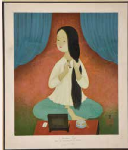
MAI THU (1906-1980). La Toilette (1962) Lithographie dédiéee.