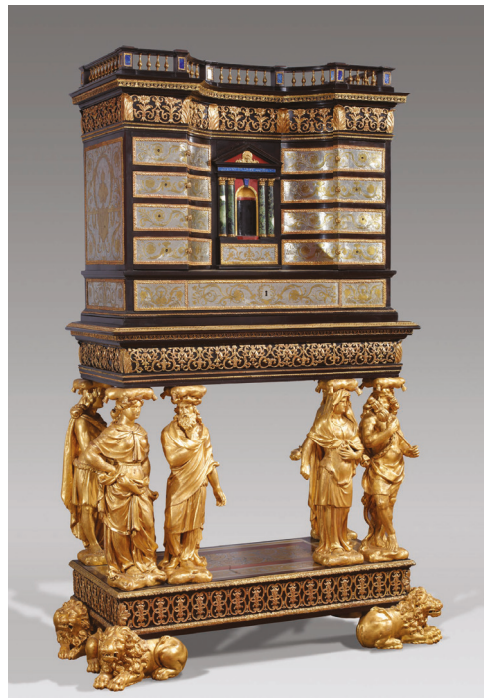
Musée Jacquemart-André, Paris.