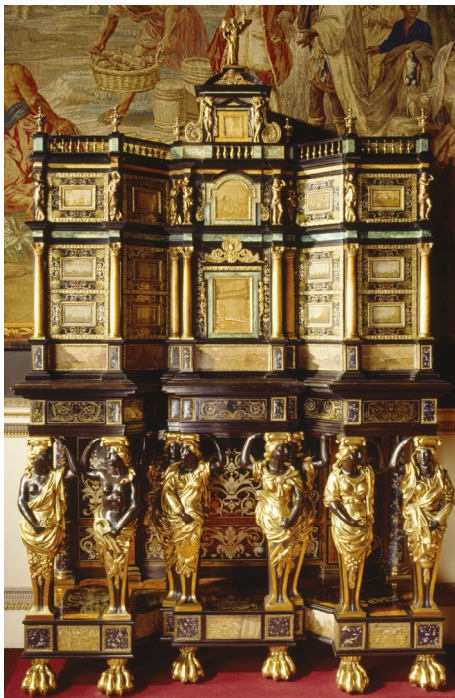
Nostell Priory, Grande-Bretagne.

En troisième lieu, il convient de rapprocher notre meuble du cabinet réalisé vers 1680 provenant probablement de la duchesse de Fontanges (voir illustration), maîtresse de Louis XIV (J. N. Ronfort, « Le mobilier royal à l'époque de Louis XIV, rapprochements et documents nouveaux », l'Estampille , Avril 1985, p. 36. Attribué à Pierre Gole par Ronfort en 1985 et Scheurleer en 2005, ce cabinet est aujourd'hui conservé au musée Jacquemart-André à Paris. Au-delà d'une structure et de dimensions similaires (H : 165 cm, L : 92,5 cm, P : 41,5 cm), on y retrouve aussi une marqueterie de laiton et d'étain, mais sans écaïlle. Il est également datable vers 1680.