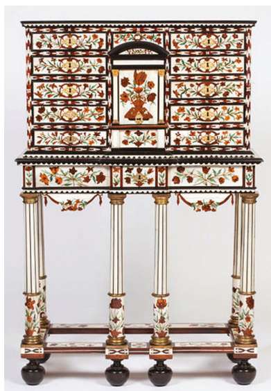
Victoria and Albert Museum, Londres.