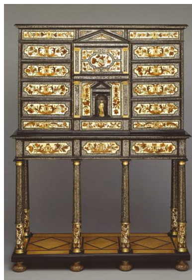
Musée d'art, Dallas, Etat-Unis.