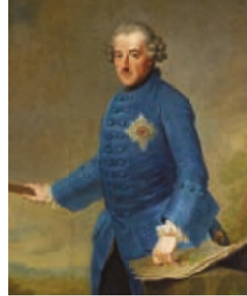
Portrait de Frédéric II de Prusse par Johann Georg Ziesenis , 1763