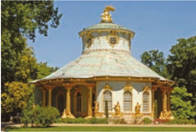
Pavillon Chinois du château de Sanssouci.