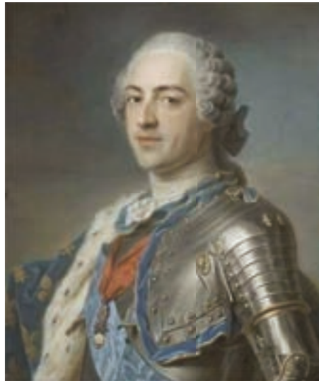
Louis XV, roi de France (1710-1774) Maurice Quentin de la Tour, 1748 Musée du Louvre, Paris

Premier grand service de la manufacture de Vincennes, le service de Louis XV est commandé à la manufacture en 1751 pour le château de Versailles. Pour ce service, le fond de couleur bleu céleste (...) dont sa Majesté a été si satisfaite, également nommé Bleu Hellot ou bleu ancien ou encore bleu du Roi est mis au point par le chimiste Jean Hellot. La livraison du service s'échelonne entre 1753 et 1755.