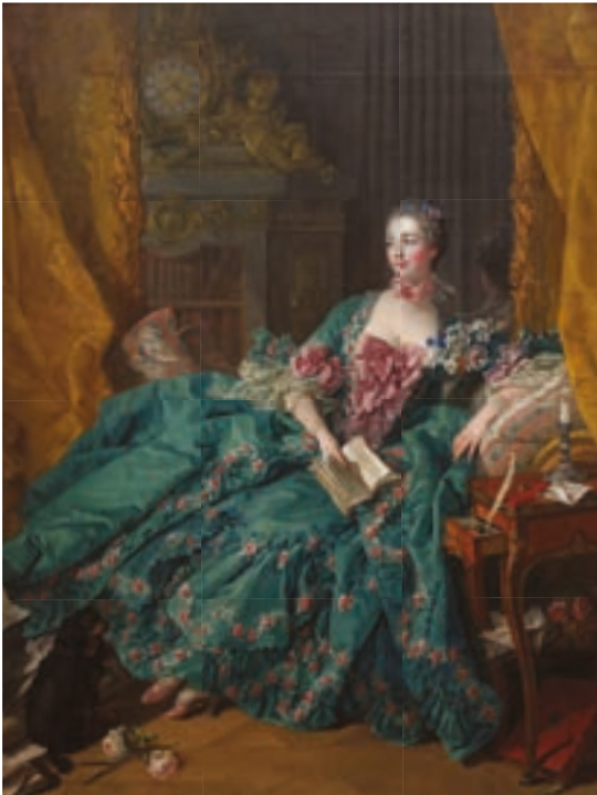
François Boucher, Madame de Pompadour, 1756, Munich.