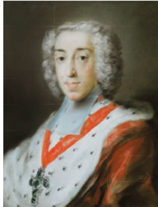
Rosalba Carriera, Clément-Auguste de Bavière, Prince-Archevêque de Cologne, 1727, Gemäldegalerie Alte Meister, Dresde.

Le 18 mars 1756, il est noté dans le livre de crédit de Lazare Duvaux : « n° 2435 à Mme de Pompadour (...) Une jatte ovale de porcelaine de Vincennes, bleu-céleste à cartouches dehors & dedans, peinte à oiseaux, les bords ornés de fleurs en relief, avec le broc peint de même (M. L'Electeur de Cologne), 672 l. ».