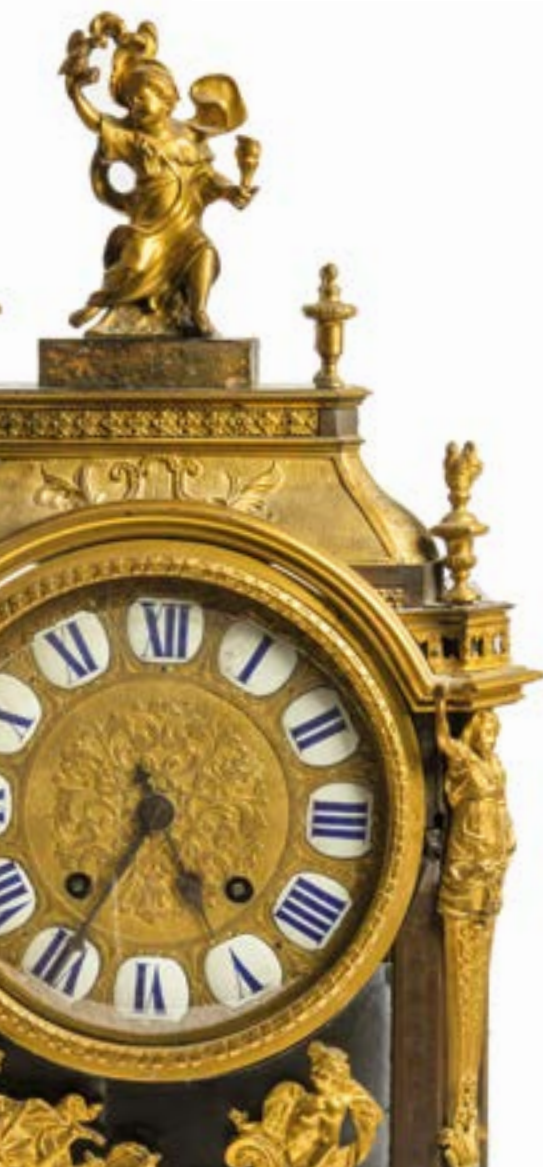
Détail du lot 238.