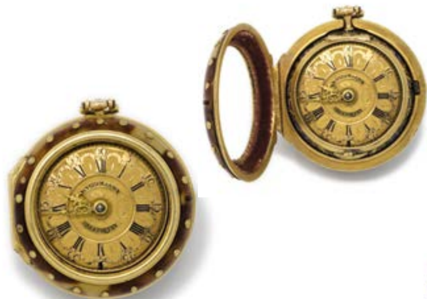
134. Montre bassine émaillée signée de l'émailleur Huaud le Puisné Amsterdam vers 1680, mouvement Van Oostom les scènes galantes peintes sur le pourtour dans un étui en or plaqué d'écaillés. Manque le verre 8 000 / 12 000 €