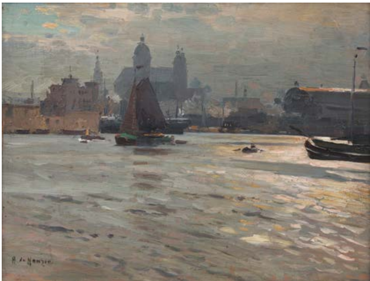
59. A de HANZEN Port Huile sur panneau 23 x 33 cm 2 000 / 3 000 €