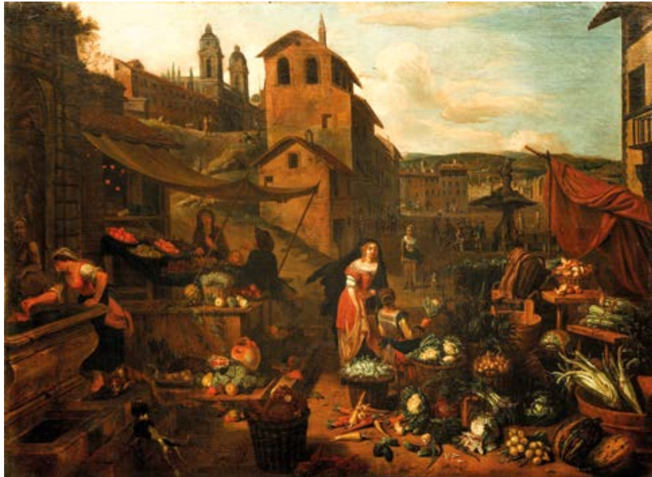
15. Jan Van BUKEN (1635-1694) Scène de marché à Rome Huile sur toile 85 x 119 cm 13 000 / 18 000 €