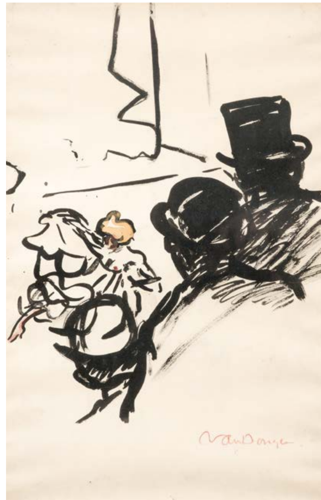
60. Kees VAN DONGEN (1877-1928) Au café concert Encre de Chine, aquarelle et crayon de couleurs signé en bas à droite. Au dos : étiquette de la galerie Charpentier : exposition Van Dongen, Paris, 1942 Taches, petite déchirure, papier insolé. 50 x 35 cm 8 000 / 10 000 €