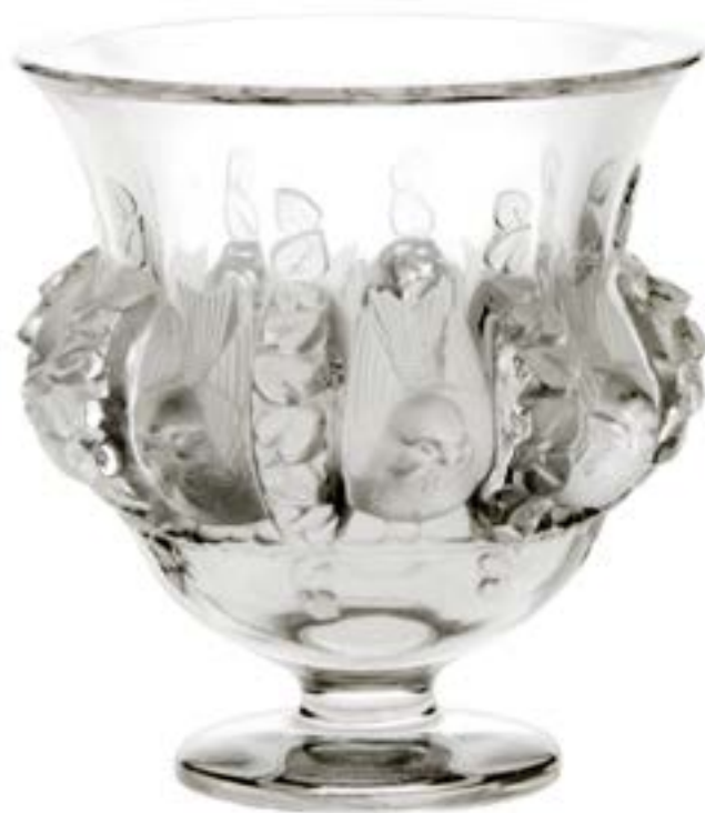
71. LALIQUE Vase en cristal décor en relief aux oiseaux H : 12 cm 200 / 300 €