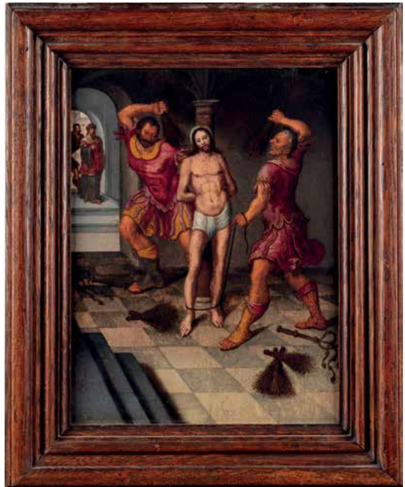
71. ECOLE DES PAYS-BAS du NORD vers 1560 Le Christ aux outrages Panneau de chêne, une planche, non parqueté 29 x 22,5 cm Restaurations anciennes

Porte une ancienne attribution au Maître de Brunswick (selon une étiquette au revers du panneau). 3 000 / 5 000 €