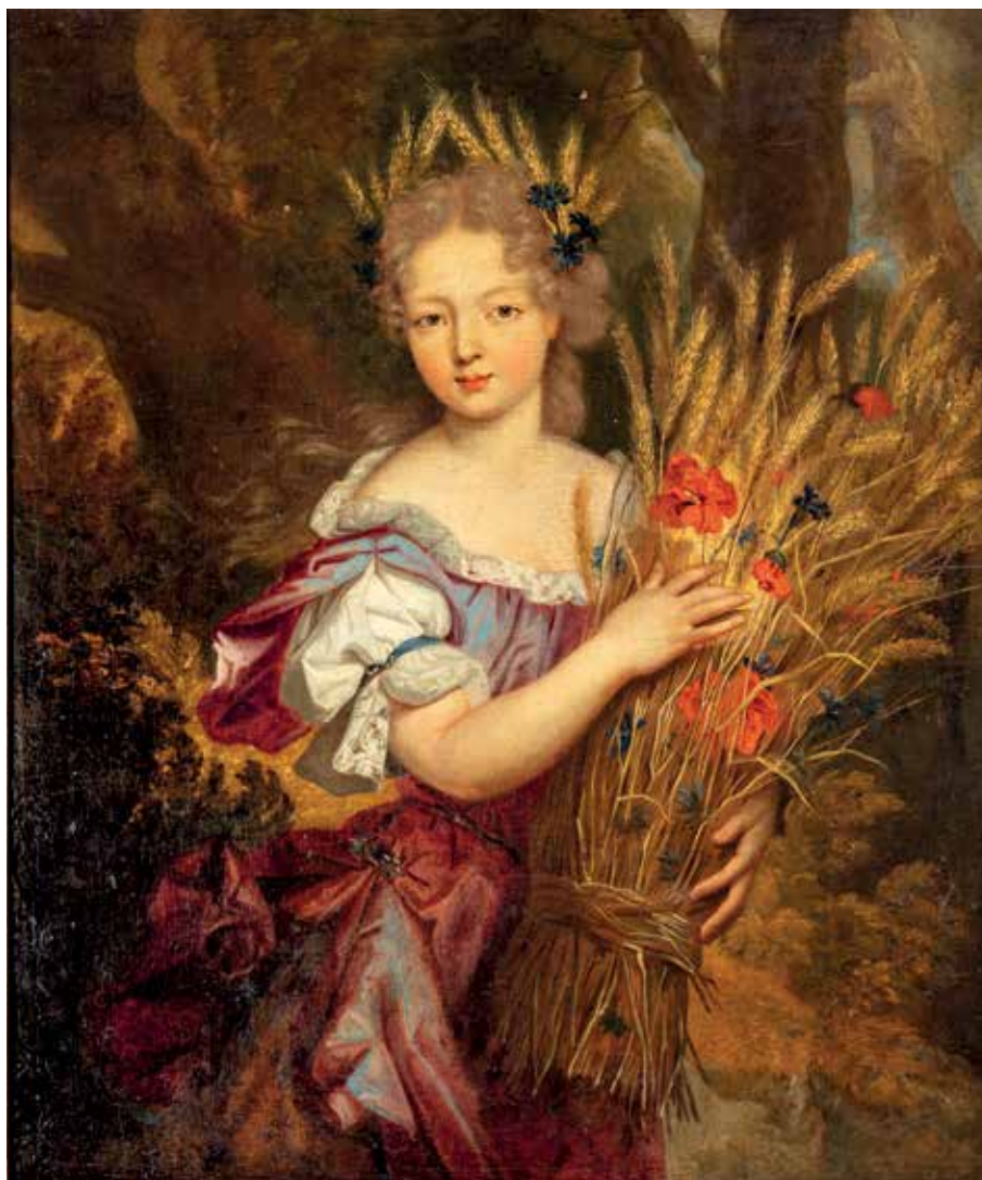
92. ECOLE FRANCAISE vers 1700 entourage Nicolas FOUCHE Portrait de femme aux épis de blé Toile 65,5 x 55,5 cm Restauration | 500 / 2 000 €