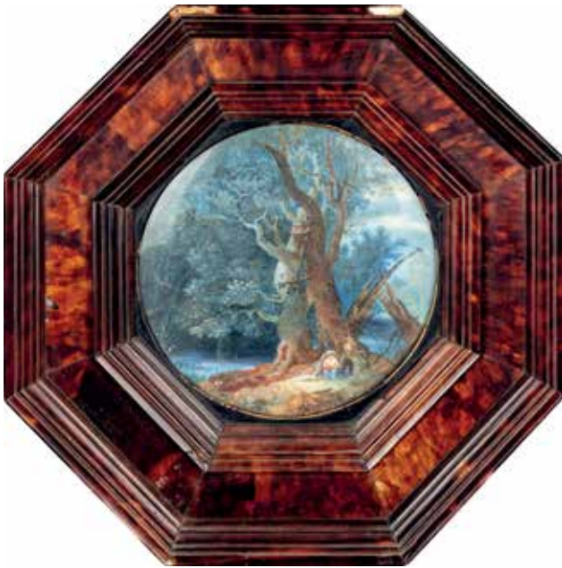
70. ECOLE FRANCAISE de la fin du XVIIIe Le repos de la Sainte Famille pendant la fuite en Égypte Gouache ronde Diam. : 10 cm Restaurations anciennes 1 000 / 1 500 €