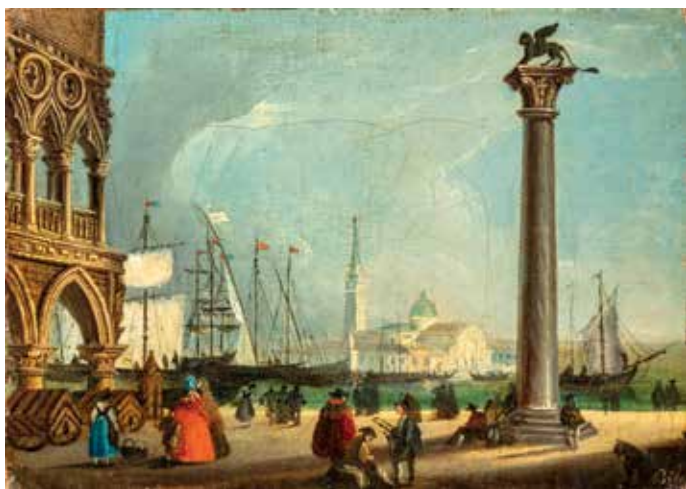
110. Giuseppe Bernardino BISON (Palmanova 1762-Milan 1844) La Piazzeta à Venise Toile sans cadre 17,5 x 24,5 cm Signé en bas à droite « Biso... » 1 000 / 1 500 €