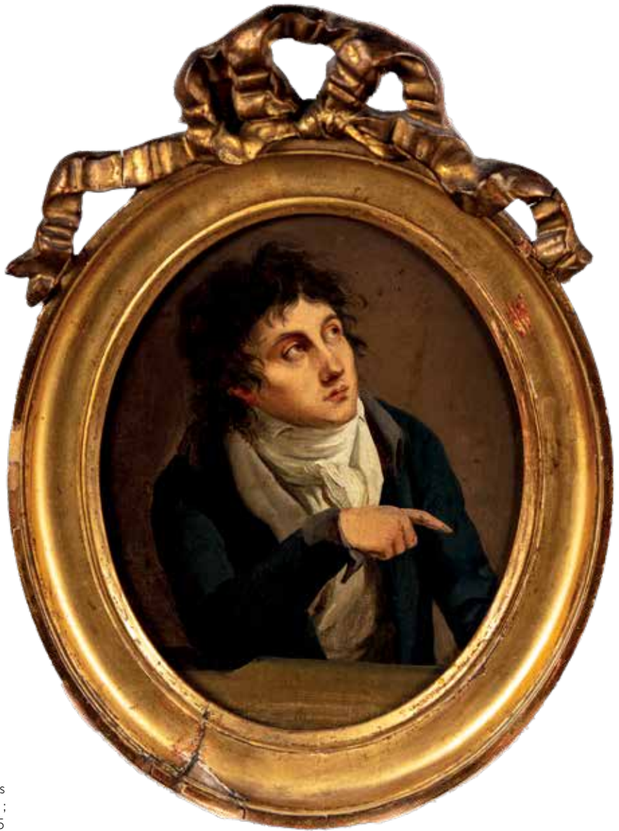
103. Louis-Léopold BOILLY (La Bassée 1761-Paris 1845) Portrait de Talma Toile marouflée sur panneau ovale 19 x 15 cm

Porte au revers du panneau des étiquettes avec ces inscriptions : « 82 » ; « Boilly Louis-Léopold 1761-1845 (Portrait de Talma) Étude très poussée pour le tableau du musée du Louvre, Intérieur de l'atelier d'Isabey (Talma est le onzième personnage à partir de la droite) » ; « Talma François J 1763-1826 Tragédien » 4 000 / 6 000 €