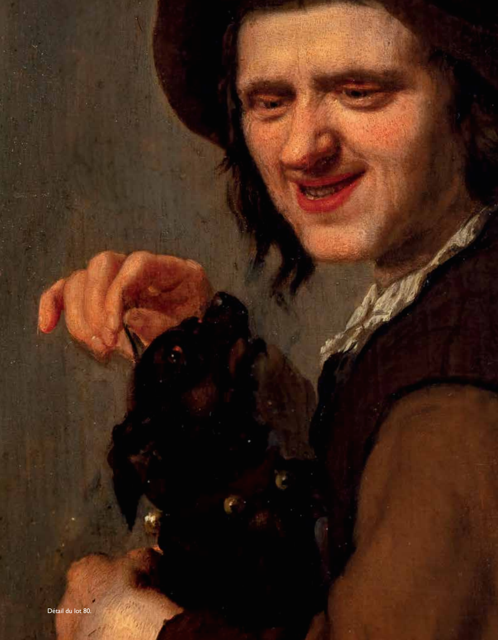
Détail du lot 80.