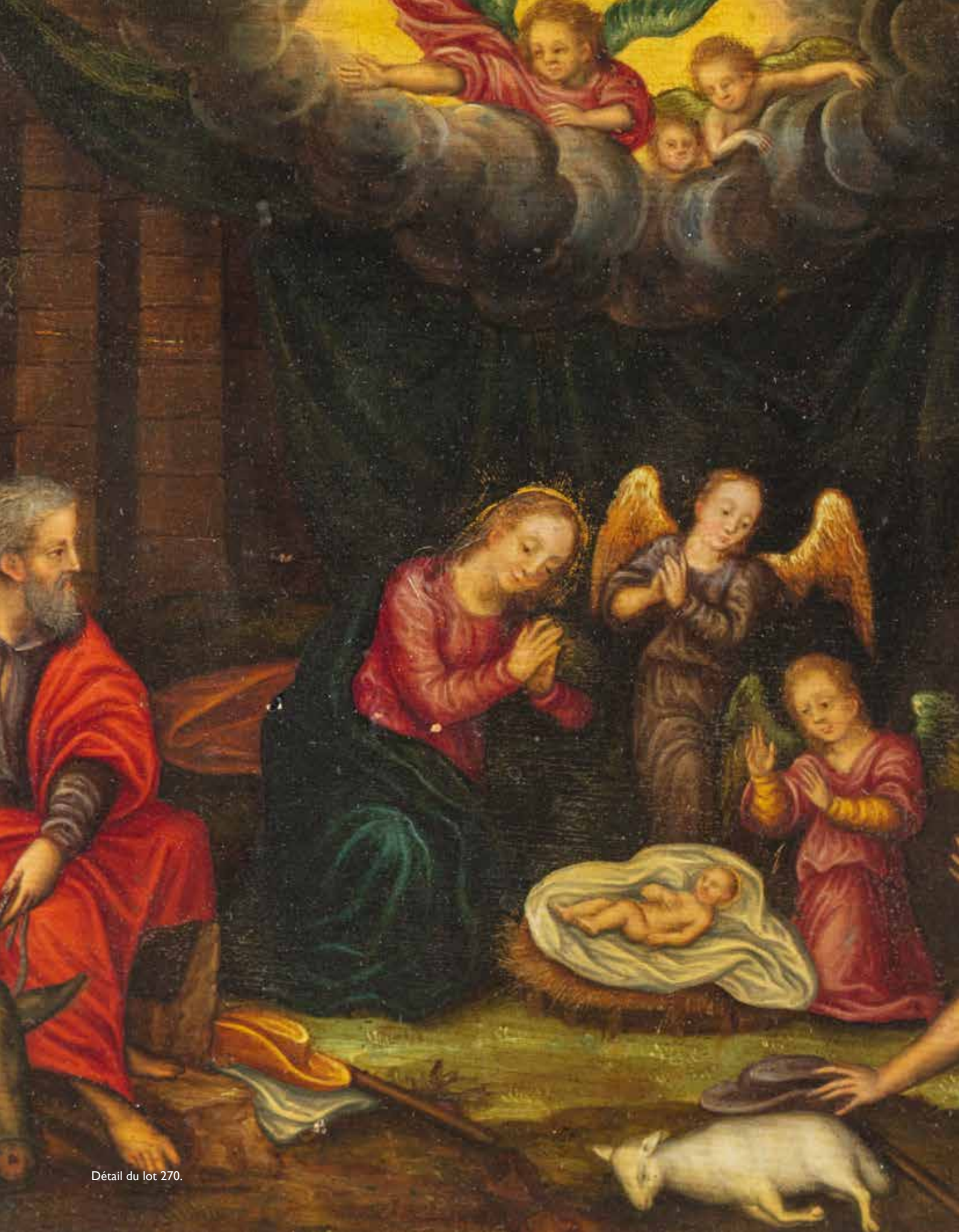
Détail du lot 270.