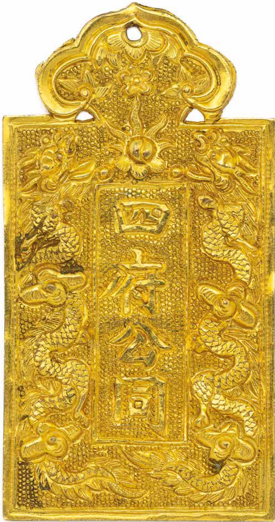
En couverture : Détail du lot 61. Ci-dessus : lot 3.