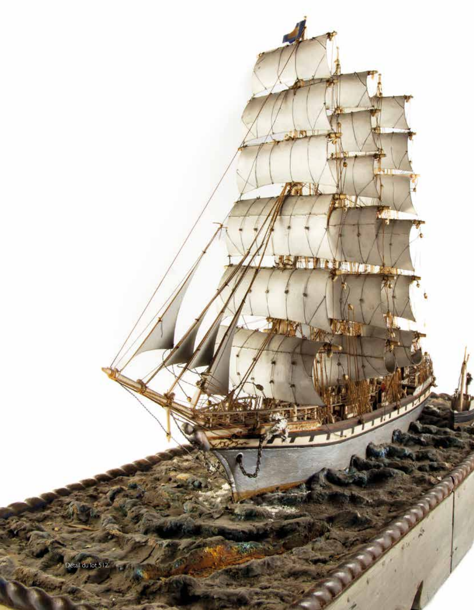
Détail du lot 512.