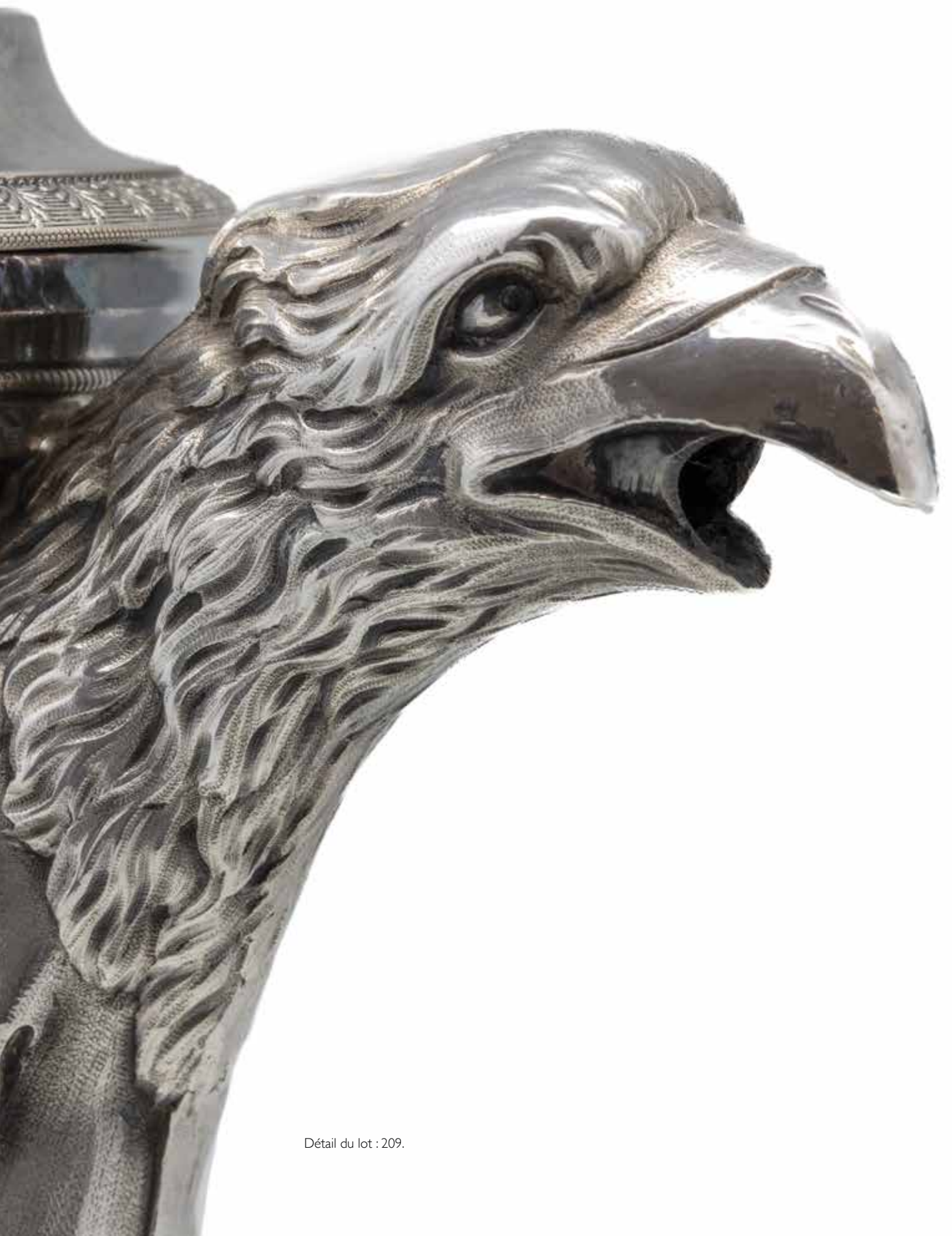
Détail du lot : 209.