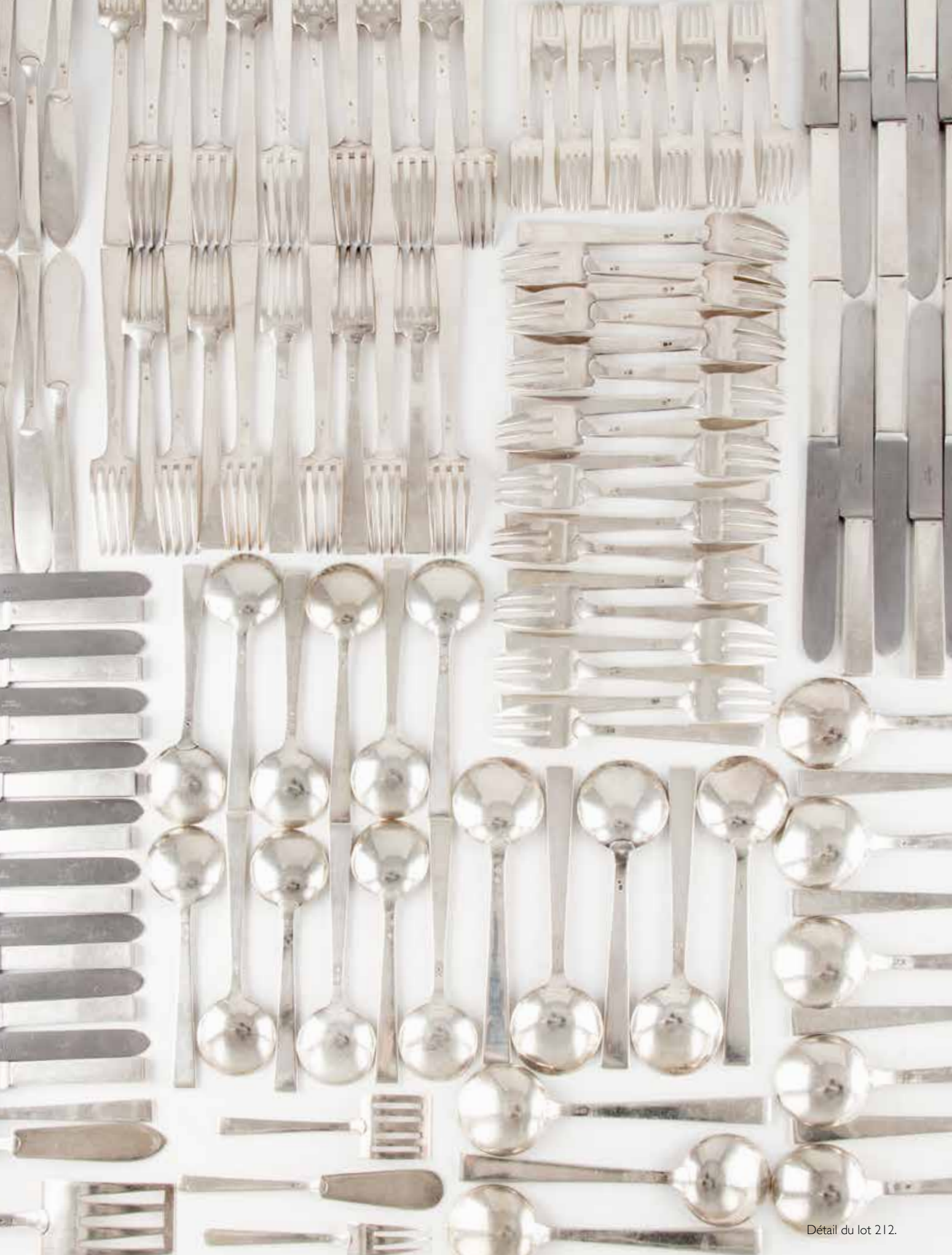
Détail du lot 212.