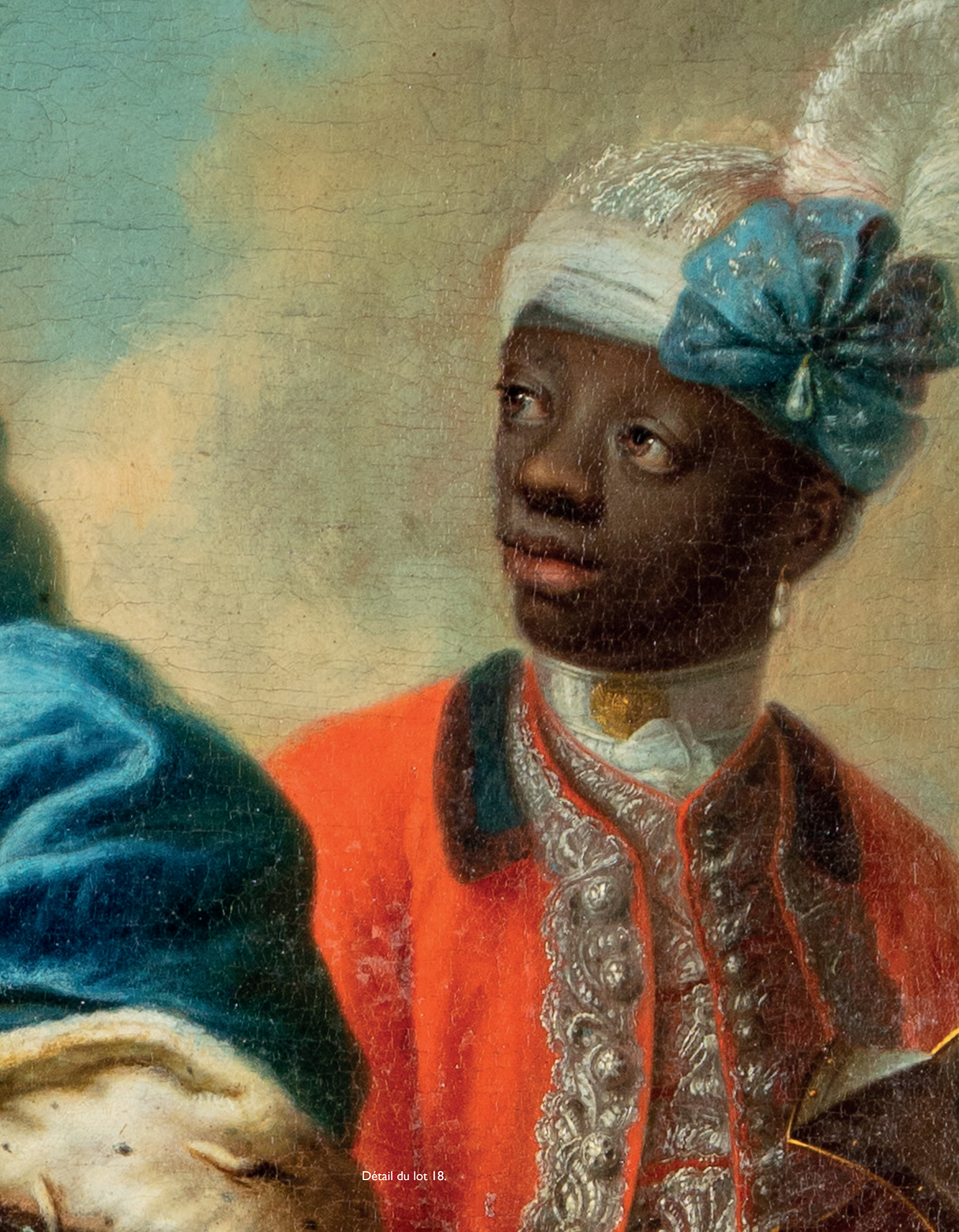
Détail du lot 18.