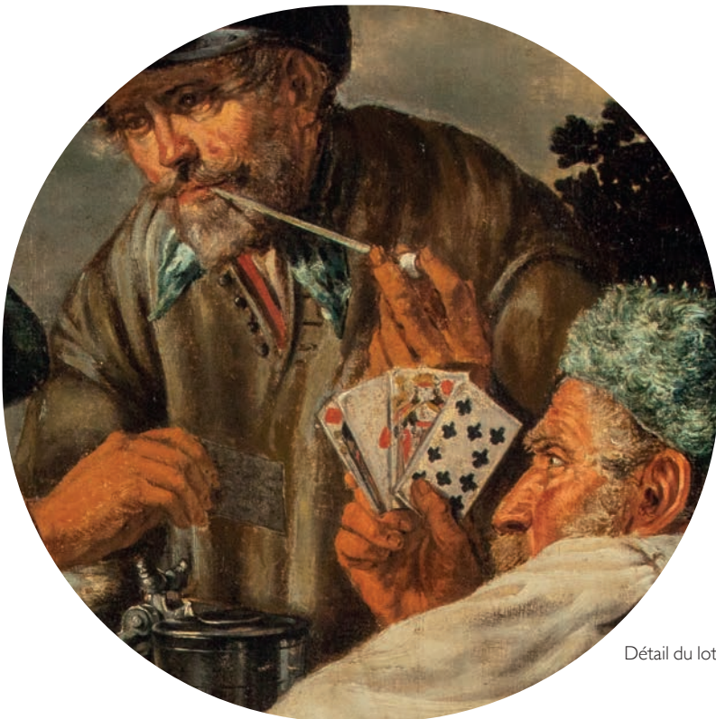
Détail du lot 11.