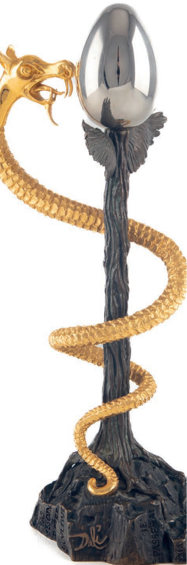
Détail du lot 357.