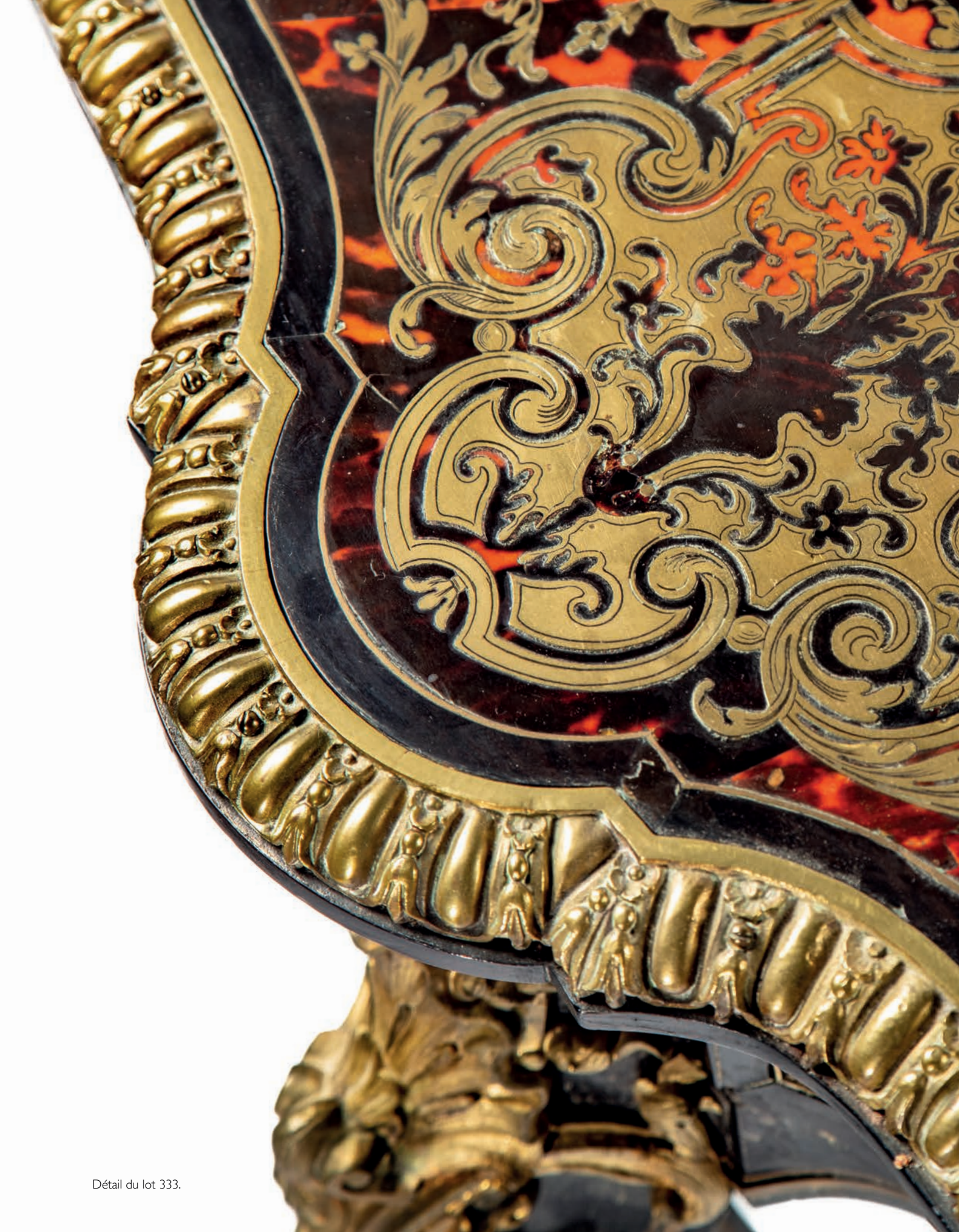
Détail du lot 333.