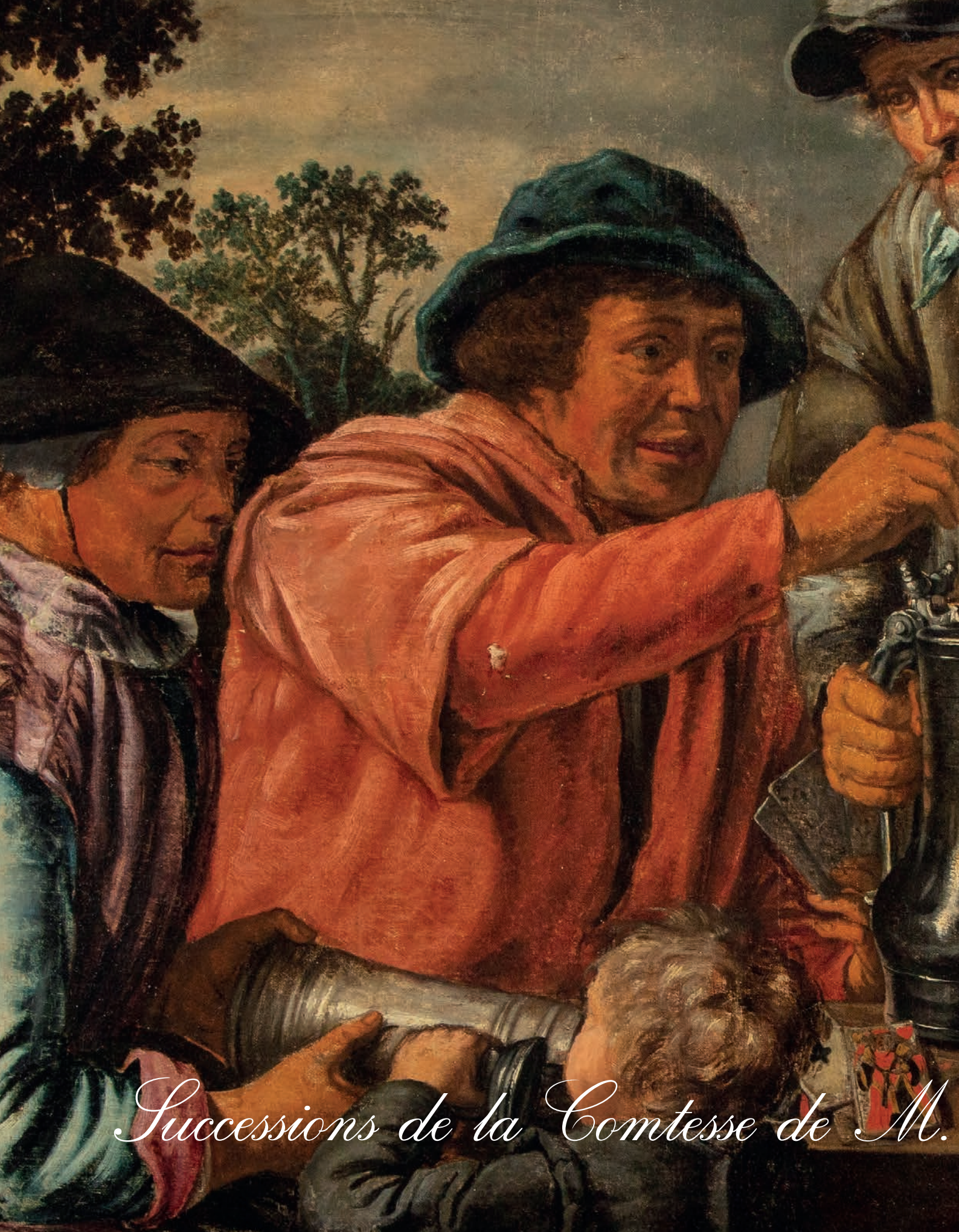
Successions de la Comtesse de M.