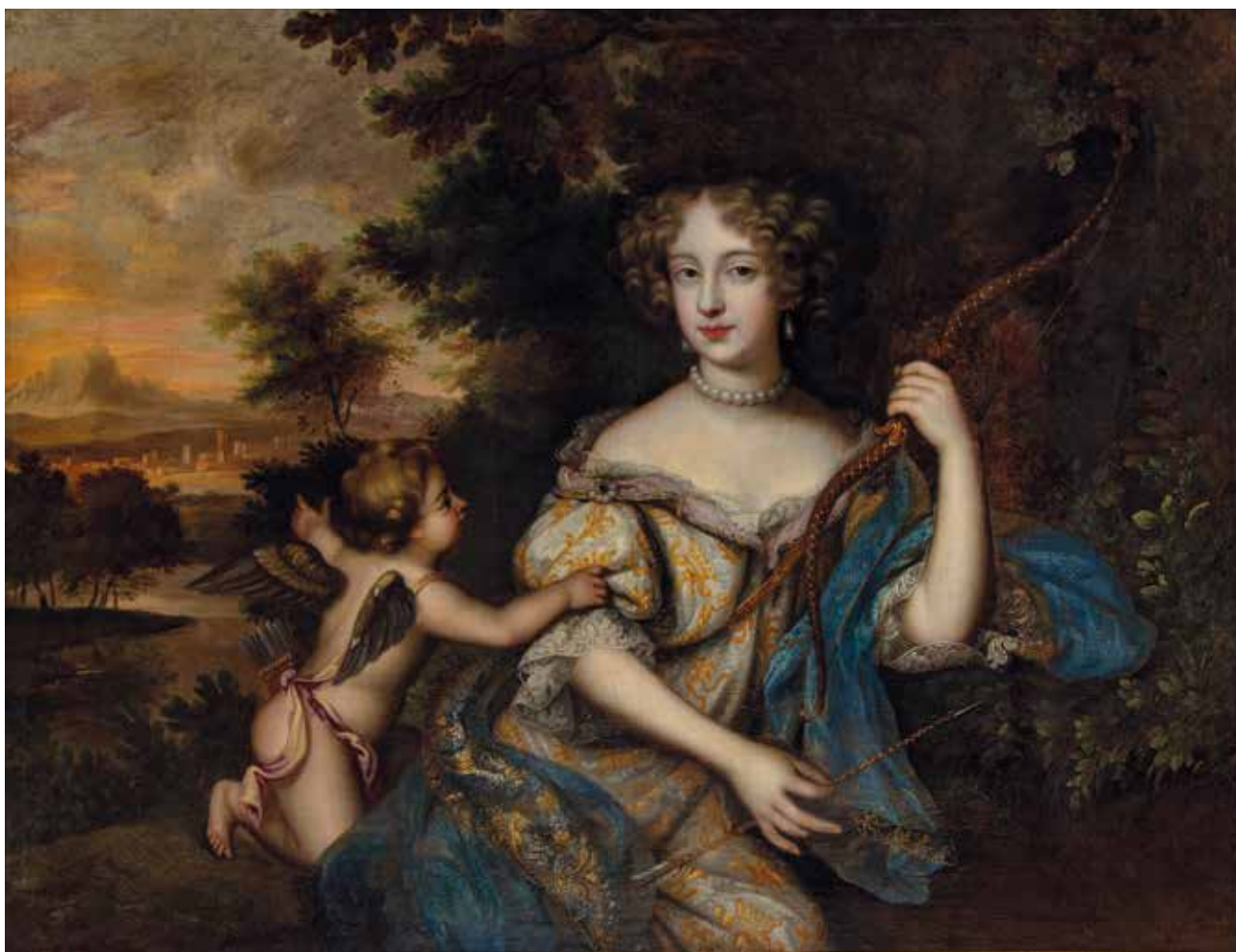
302. Entourage de Pierre MIGNARD (1612-1695) Portrait de femme en Diane accompagnée par un Amour Huile sur toile, rentoilée 95 x 123 cm (Restaurations) 4 000 / 6 000 €

303. ECOLE FLAMANDE du XVIIIe Le christ enfant et saint Jean Baptiste Huile sur cuivre 11 x 13 cm Usures et manques 200 / 300 €