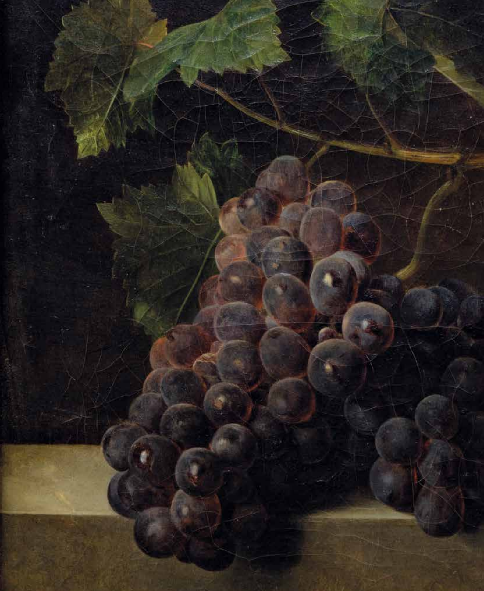
Détail du lot 251.