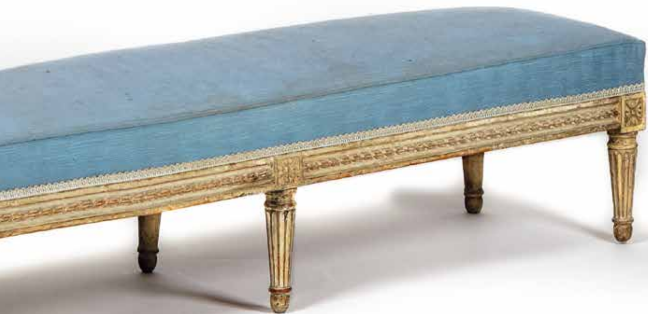
Détail du lot 445.