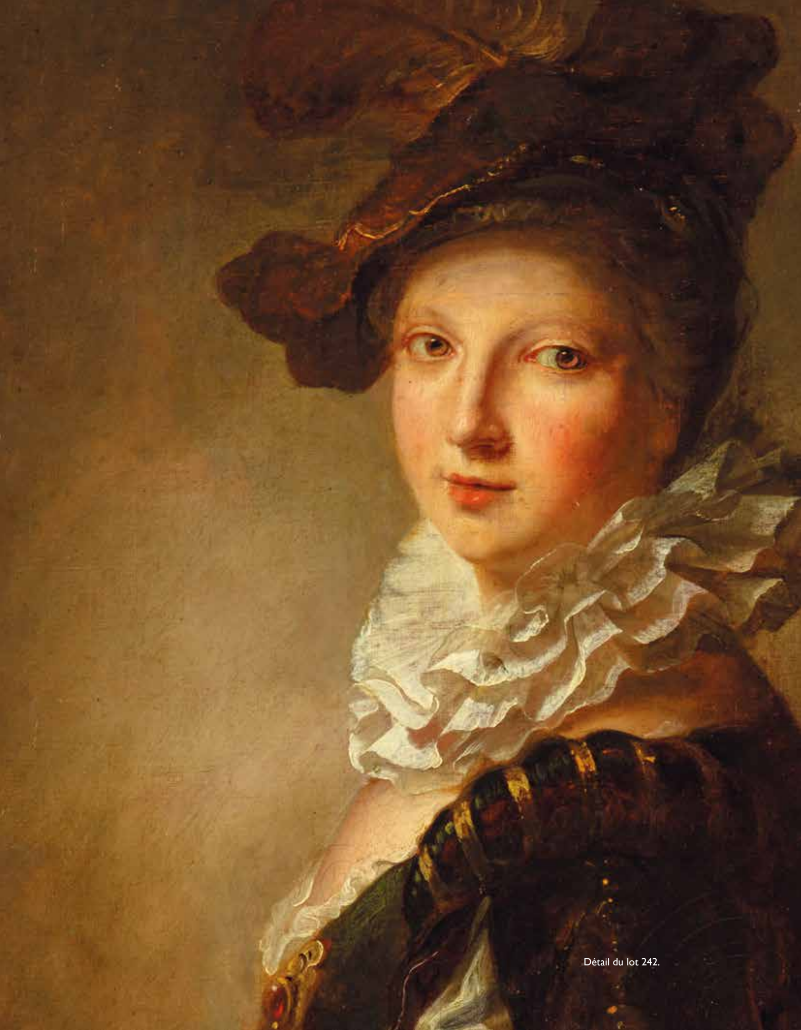
Détail du lot 242.