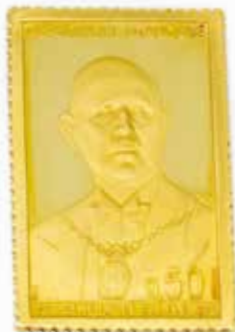
Détail du lot 104.