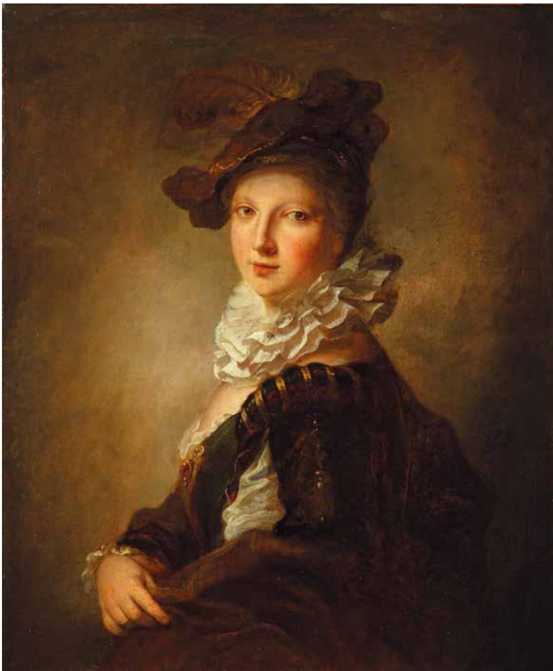
242. Alexis GRIMOU (c.1678-1733) Portrait d'une femme à la collerette 50 x 46 cm 6 000 / 10 000 €