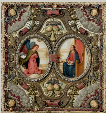
France, première moitié du XVII e siècle, adjugé 7 200 €