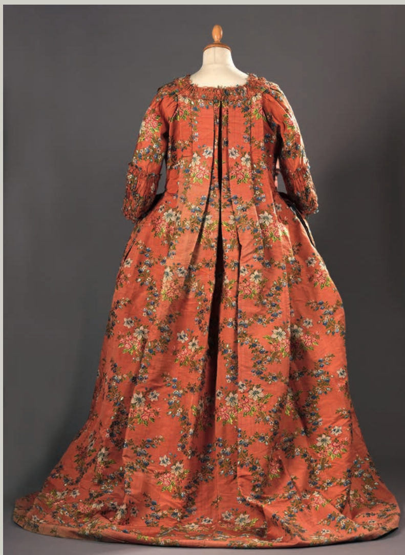
Robe à la française, vers 1760, adjugé 10 500 €

Journée d'expertise en présence de Raphaël MARAVAL-HUTIN Mardi 24 septembre de 10h à 12h et de 14h à 18h