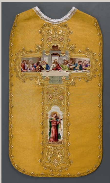
Ornement liturgique brodé complet, Lyon, début du XX e siècle, adjugé 5 000 €

Journée d'expertise en présence de Raphaël MARAVAL-HUTIN Mardi 24 septembre de 10h à 12h et de 14h à 18h