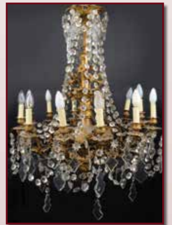
Important lustre en bronze doré à 12 bras de lumière à décor de personnages. Haut. 85 cm. Riche décor de pampilles, époque début XIX ème . Est. 700 / 800 €.