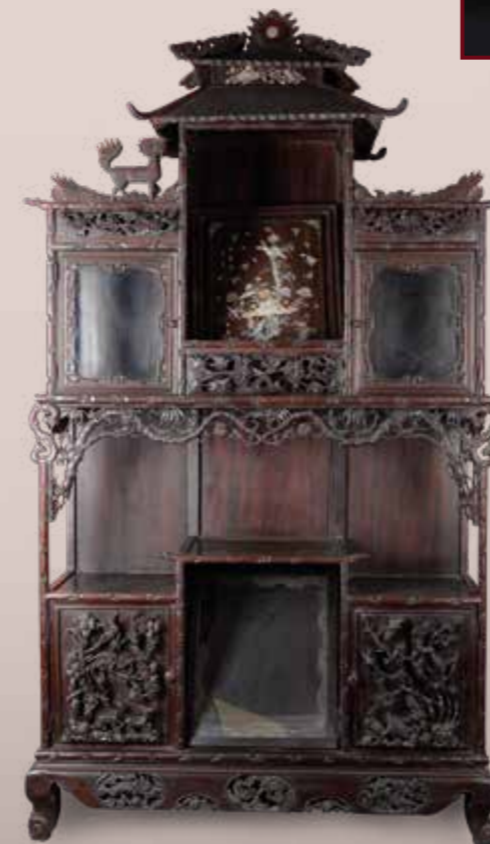
Cabinet Indo-chinois, ouvrant par 6 portes et une entoise, à décor sculpté d'oiseaux et de dragons. Est. 1 200 / 1 500 €.