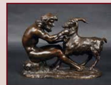
CLODION (d'après), Sculpture en Bronze à patine brune. Haut 17 cm. Est. 350 / 450 €.