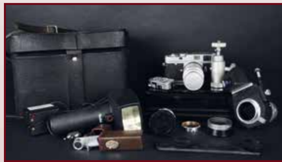
LEICA, Ensemble de matériel photographique comprenant : Appareil photo LEICA M2 numéro 995 505 - 2 objectifs un monté sur l'appareil, un posemètre LEICA METER MR, un flash de marque ROLLEI et divers accessoires LEICA. Le tout dans une mallette de photographe en cuir. Est. 600 /800 €.