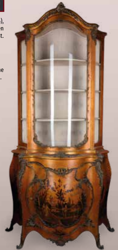
Cabinet Vitrine, Portes et cotés galbés, riches garnitures de bronze et chutes de bronze, porte inférieure à décor de scène galante, verni dit Martin. Dim. 241x50x114. Est. 2 000 / 3 000 €.