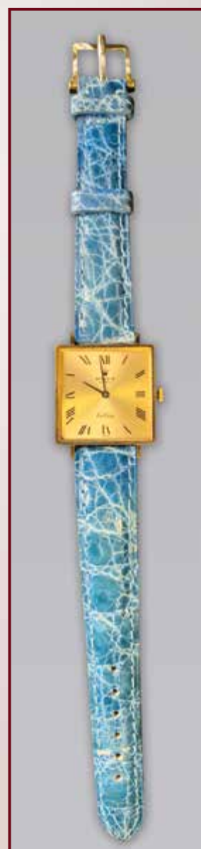
ROLEX. Modèle Cellini état neuf. Est 600 / 800 €.