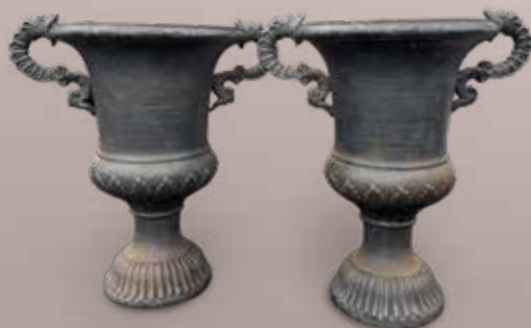
Importante Paire de Vases Médicis en fonte à décor de dragon. Haut. 81 cm. Est. 1 200 / 1 500 €.