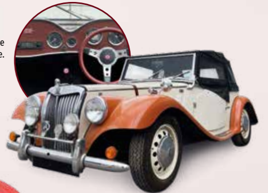
RMB REPLICA GENTRY, 1984. Est. 10 000 / 12 000 €.