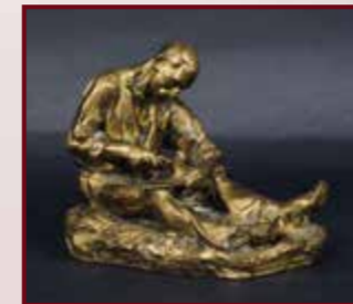
DALOU Jules (1838- 1902), Sculpture en bronze à patine doré, Susse fondeur Paris (Haut. 14 cm) Cire perdue (cachet de l'atelier). Est. 600 / 400 €.