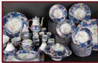
Service HAVILAND. Est. 300 / 400 €.