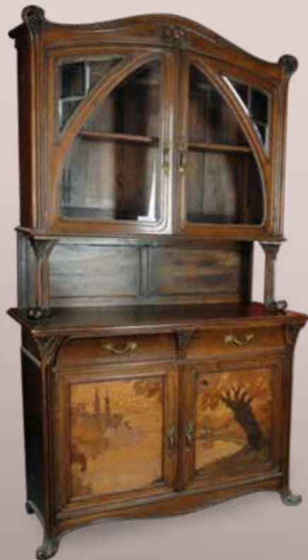
MAJORELLE : Salle à manger en noyer sculpté et mouluré portes marqueterie de paysage forestier, se composant d'un buffet deux corps avec entretoise, un dressoir, une table, six chaises. Est. 4 000 / 5 000 €.