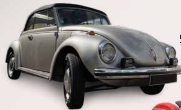
Coccinelle VOLKSWAGEN, 1970. Est. 18 000 / 20 000 €.