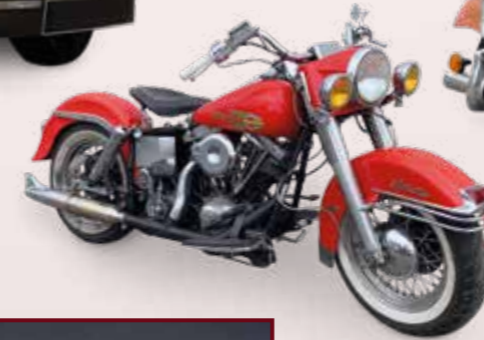
HARLEY DAVIDSON, Électra Gide 1340 cm 3 de 1983. Entièrement révisée. Est. 10 000 / 12 000 €.