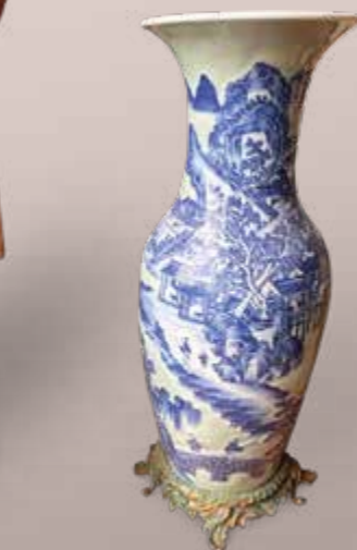
Chine. Important vase en porcelaine. Époque XVIII ème siècle. Pied en bronze doré rocaille. Est. 400 / 600 €.