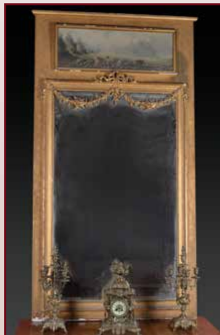
Important trumeau de style Louis XVI, décor de Putti dans un décor Arboré. Dim.220 x 118 cm. Est. 300 / 400 €.