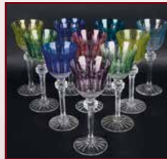
SAINT LOUIS : 10 Verres en cristal taillé type ROEMER TOMMY (couleur). Est. 300 / 400 €.