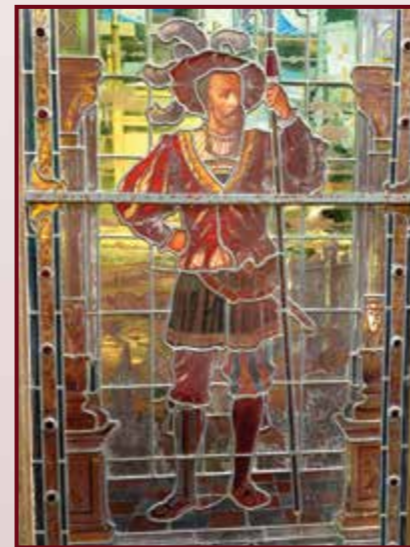
Important vitrail à décor de gentilhomme de la Renaissance sous une voute, grisaille. Dim. 260 x 107 cm. Est. 800 / 1 200 €.