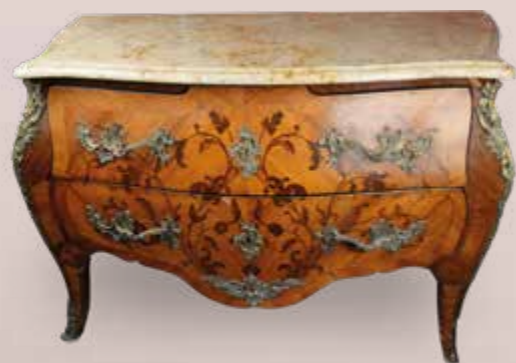
Commode en marqueterie de bois de rose et bois de violette ouvrant par 2 larges tiroirs à traverse dissimulée, galbée sur trois face, marbre brèche d'Alep, porte une estampille, poignée, entrées et chutes en bronze doré de style rocaille. Époque XIX ème . Porte une estampille N D GRAND et fleur de Lys. Haut. 84 cm, Larg 125 cm & prof. 63 cm. Est. 3 000 / 4 000 €.