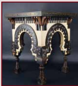
BUGATTI Carlo, (1856-1940) (attribué à). Petit Guêridon recouvert de parchemin, à décor mauresque, incrustation de décor en étain. Hauteur 53, largeur 44. Est. 4 000 / 5 000 €.