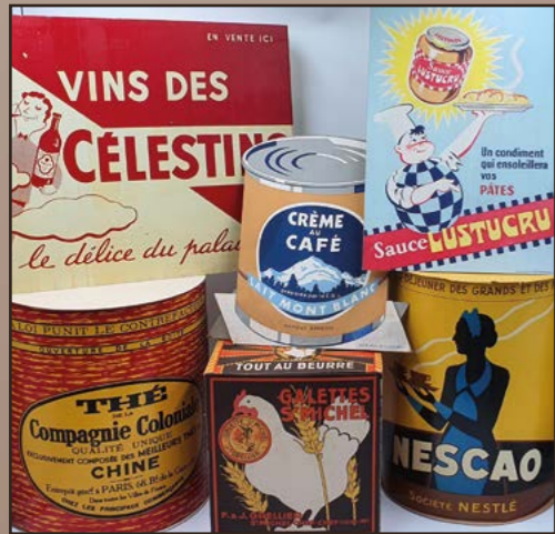
Cartons, plaques et PLV publicitaires anciens.