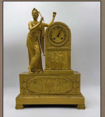
PENDULE en bronze doré, époque empire, représentant une allégorie de la musique, Dim. 46 x 31 x 10 cm. Est. 600 / 800 €.