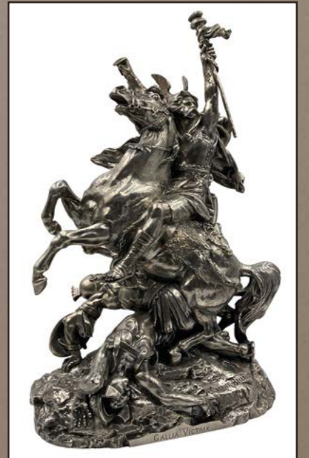
Albert-Ernest CARRIER BELLEUSE (1824-1887) et CHRISTOFLE ORFEVRE, "Gallia Victrix" Sculpture en métal argenté figurant Vercingétorix à cheval victorieux de la bataille de Gergovie, signée sur la terrasse, titrée sur un cartouche à l'avant, Marque fondeur "Christofle Orfèvre", H. 54 cm. Est. 6/8 000 €.