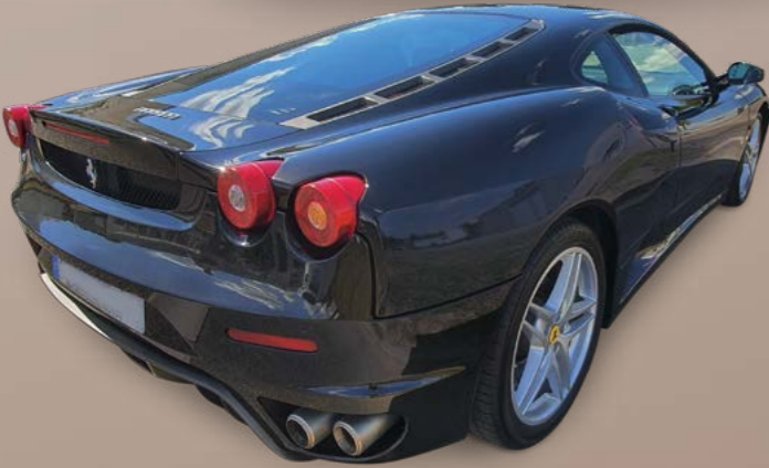
FERRARI F430 F1, 2006, option scellerie cuir Daytona. Moteur V8 4.3, puissance maximale de 485 CV, Puissance administrative 43 CV Fiscaux, Énergie ES, 26 500 kms, 2 places assises. Avec contrôle technique, avec certificat d'immatriculation. Est. 70 / 90 000 €.