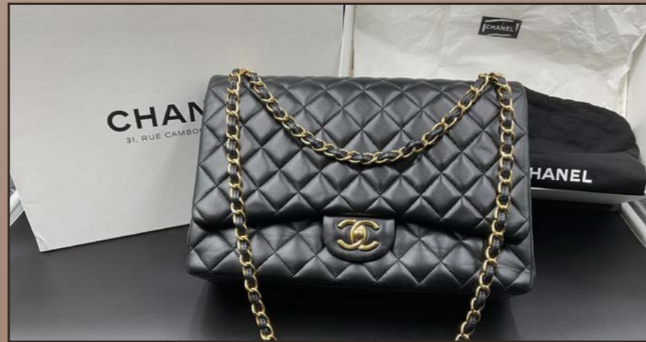
CHANEL, Sac à main grand modèle TIMELESS en cuir d'agneau noir matelassé, bandoulière et fermoir en métal doré, Dim. 23 x 34 x 10 cm. Avec sa boîte et son dust Bag. Ensemble en très bon état. Est. 600 / 800 €.