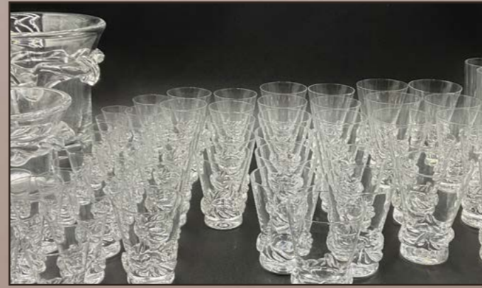
DAUM France, Service de verres en cristal modèle Sorcy, marqué à la base et composé de : 11 verres à liqueur (H. 5,5 cm), 12 verres à porto (H. 7 cm), 12 verres à vin blanc (H. 8,5 cm), 13 verres à vin rouge, 10 verres à eau (H. 10,5 cm), 12 flûtes à champagne (H. 14,5 cm), un seau à glace (H. 12,5 cm), un seau à champagne (H. 19 cm). Soit 72 pièces. Est. 300 / 500 €.