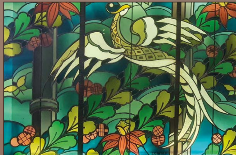
Jacques GRUBER (1870 - 1936) Grand et rare vitrail réalisé par le maître verrier dans les années 20, décor typique du travail de l'artiste à cette époque figurant un paon aux ailes déployées dans un paysage foisonnant de fleurs et feuillages agrémenté par deux colonnes cannelées, thème de prédilection de l'Art nouveau, le travail de l'artiste laisse toutefois présager, par l'utilisation de lignes et de formes plus épurées, le développement grandissant du mouvement Art-déco. Signé en bas au centre, Dim. du vitrail 116 x 156 cm. Le vitrail réalisé en 3 parties est intégré dans un châssis en bois avec un système de retro-éclairage mettant valeur l'œuvre du maître, Dim avec encadrement : 136 x 170 cm. Est. 3 000 / 4 000 €