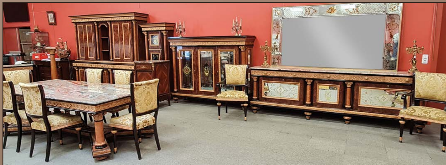
Salle à manger. Travail italien. Ensemble de mobilier en bois blanc sculpté et plaquage de loupe de noyer, à décor de frises feuillagées et fleuries. Frises de motifs géométriques sur les corniches, ornées de colonnes coiffées de chapiteaux corinthiens.