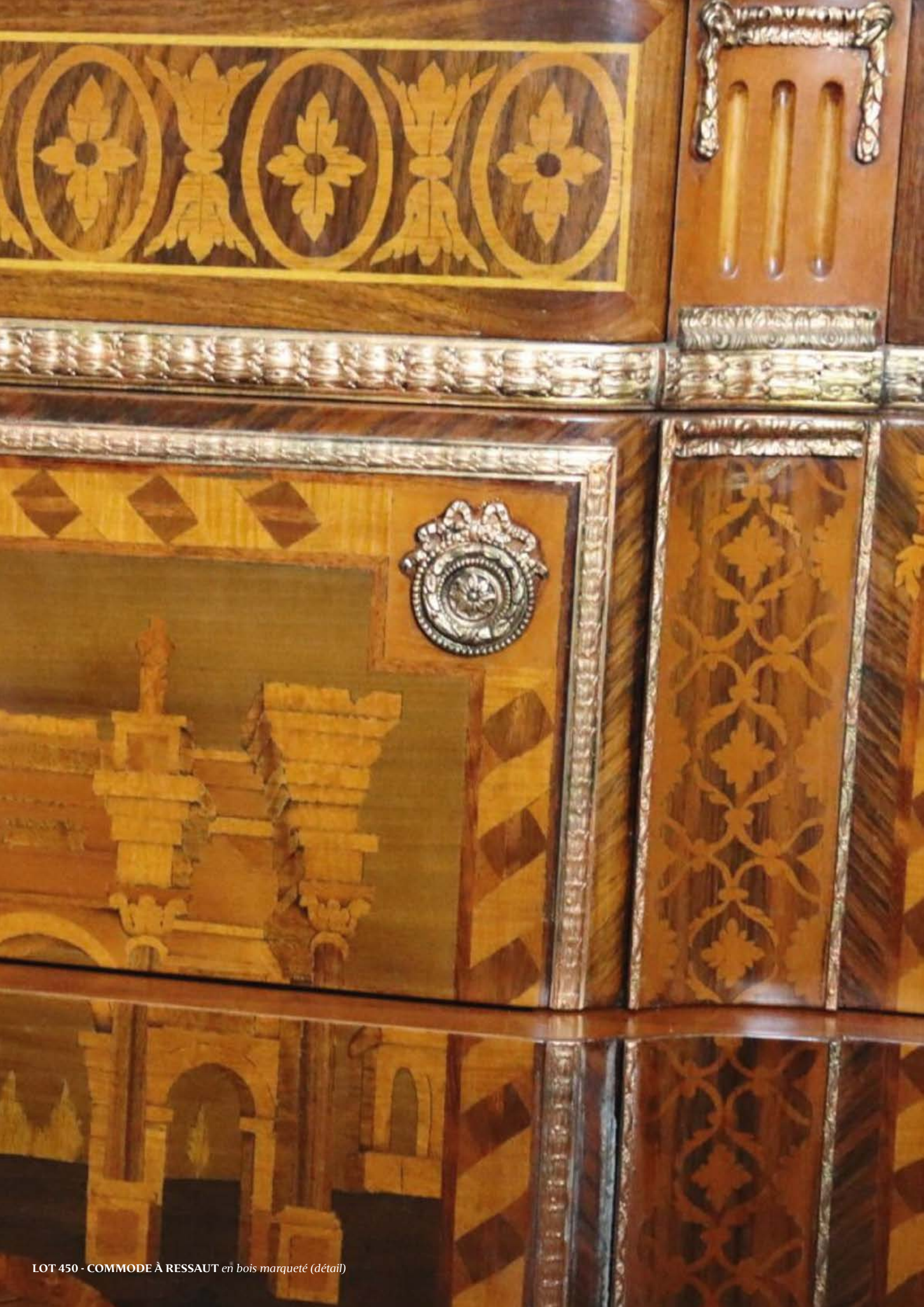
LOT 450 - COMMODE À RESSAUT en bois marqueté (détail)