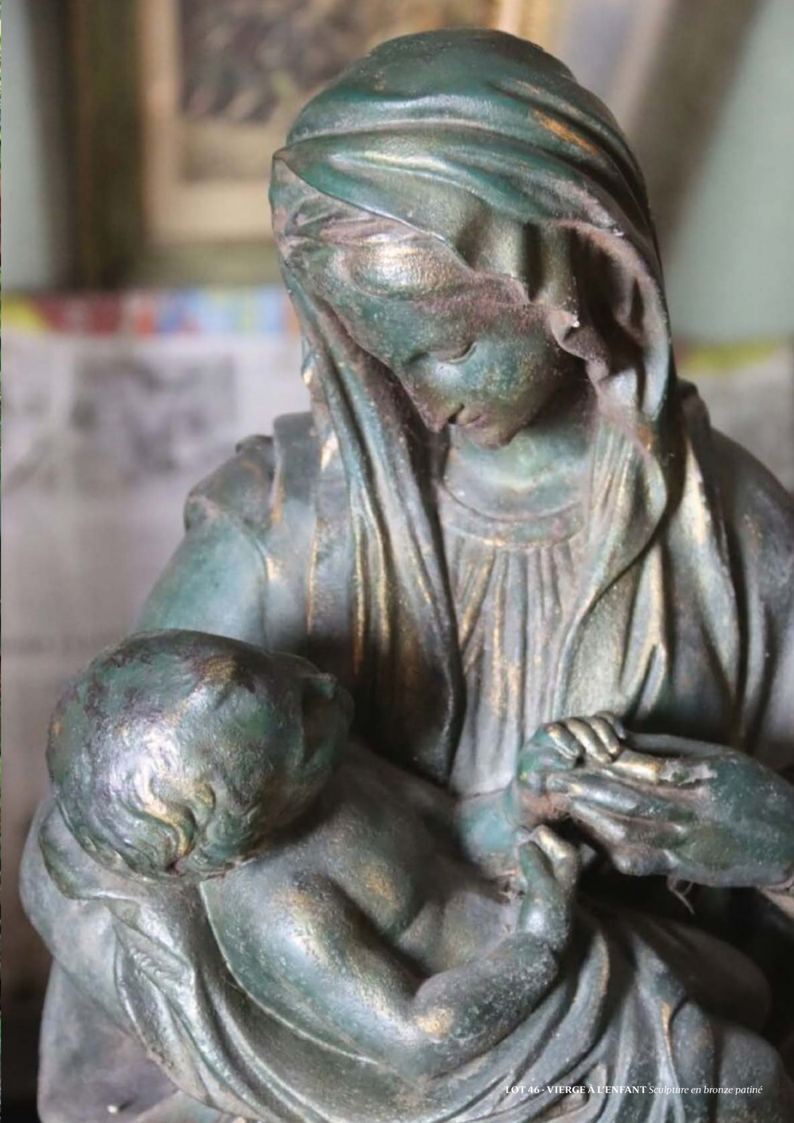
LOT 46 - VIERGE À L'ENFANT Sculpture en bronze patiné