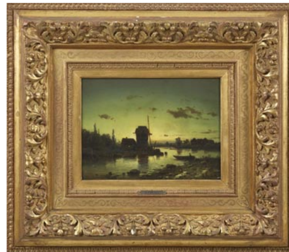
114 ADOLF CHWALA (Prague 1836 - Vienne 1900) Paysage au moulin Huile sur panneau Hauteur : 22 cm ; Largeur : 30 cm Signés en bas à droite et en bas à gauche "AChwala" 2 200 / 2 400 €