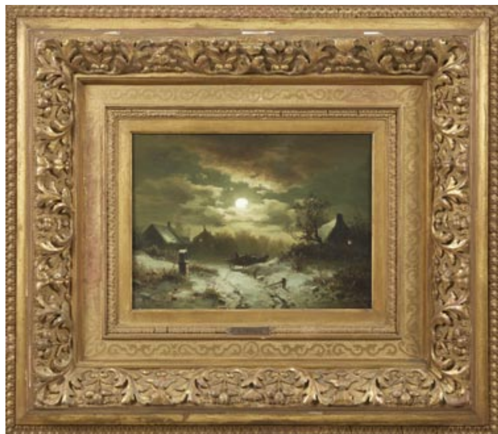
113 ADOLF CHWALA (Prague 1836 - Vienne 1900) Paysage enneigé Huile sur panneau Hauteur : 22 cm ; Largeur : 30 cm Signés en bas à droite et en bas à gauche "AChwala" 2 200 / 2 400 €