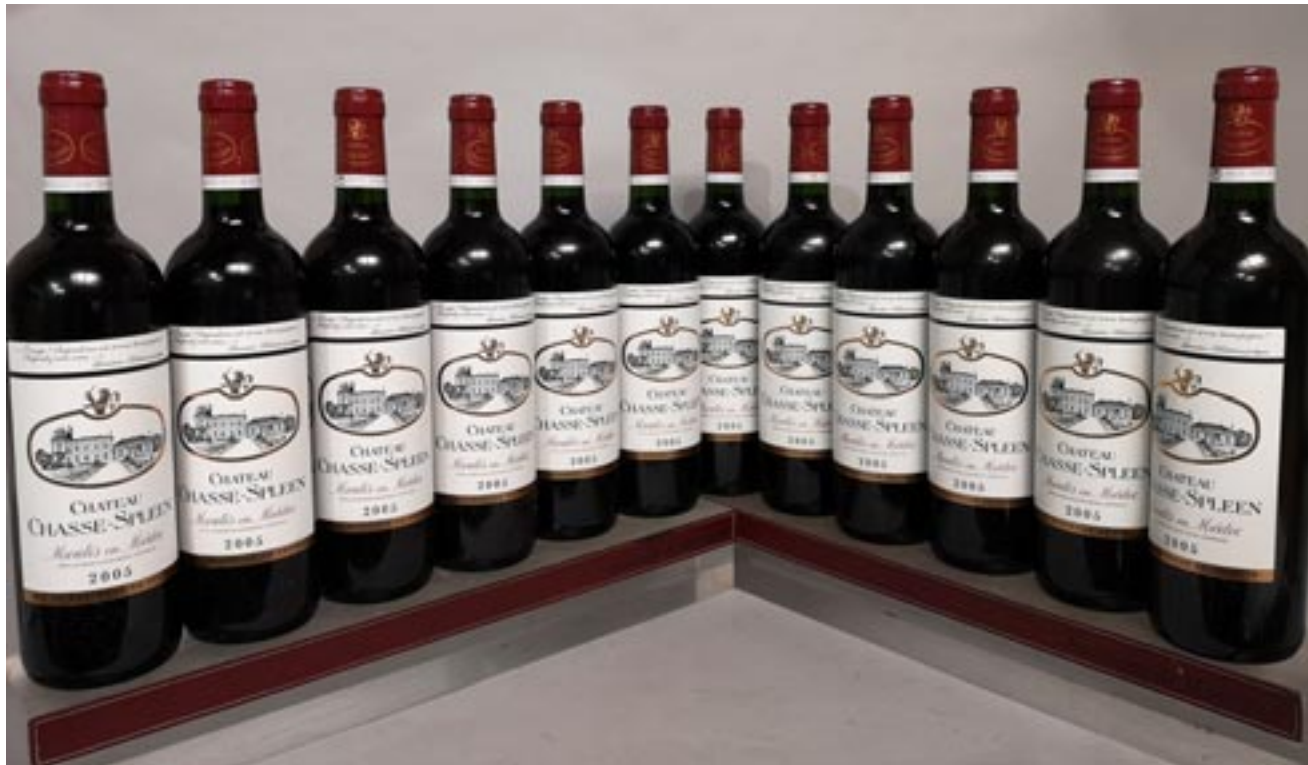
236 12 bouteilles Château CHASSE SPLEEN - Moulis en Médoc 2005 480 / 600 €

L'abus d'alcool est dangereux pour la santé, à consommer avec modération