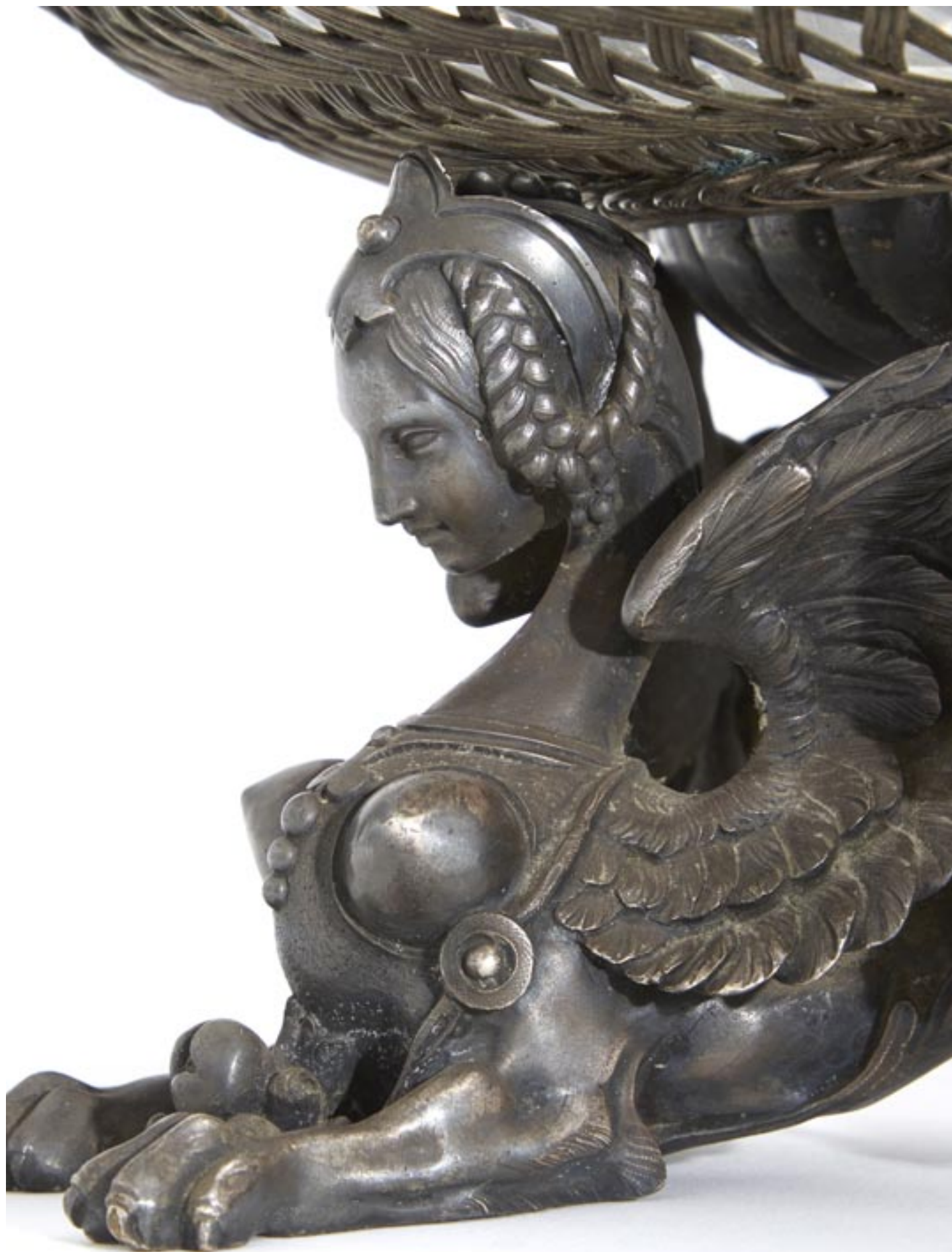
détail lot 149