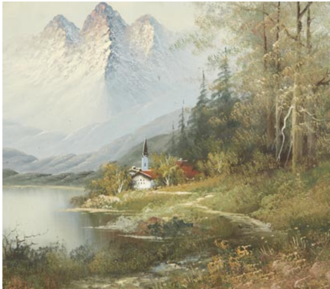
détail lot 120

COMMISSAIRES-PRISEURS habilités Frédéric DELOBEAU Pierre BORN