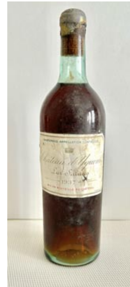
210 Bouteille Château Yquem, 1937, Sauternes 1 200 / 1 500 €

L'abus d'alcool est dangereux pour la santé, à consommer avec modération