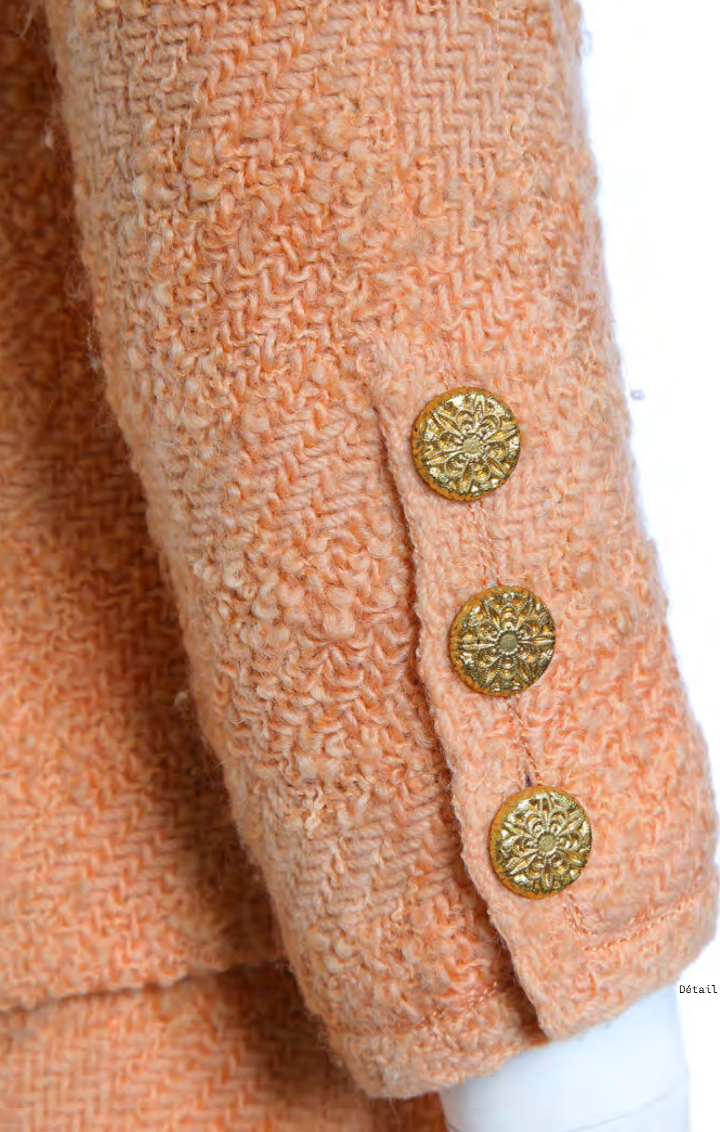
Détail du lot 374.