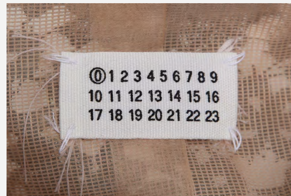
Détail du lot 325.

John Galliano a accepté le rôle de directeur de création chez Maison Margiela en 2014, cinq ans après le départ à la retraite du créateur fondateur Martin Margiela et trois ans après son départ de Dior.