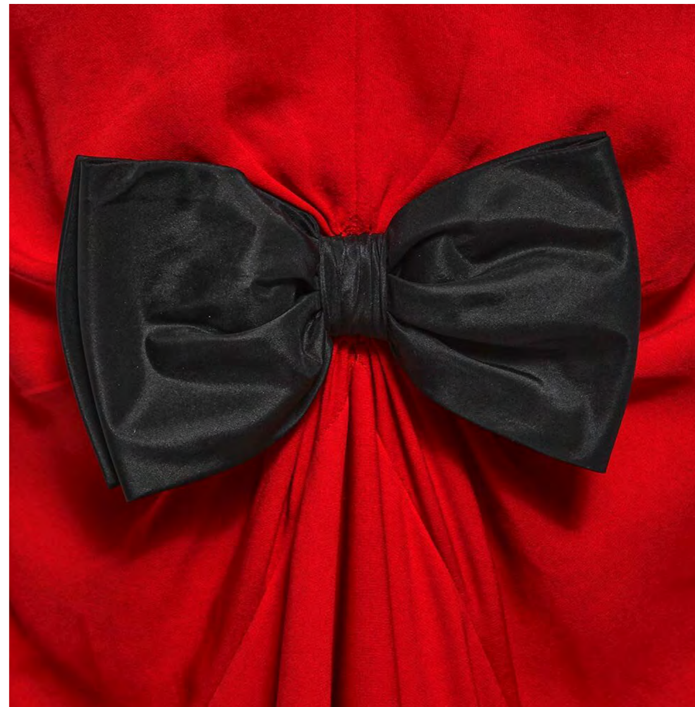
Détail du lot 276.