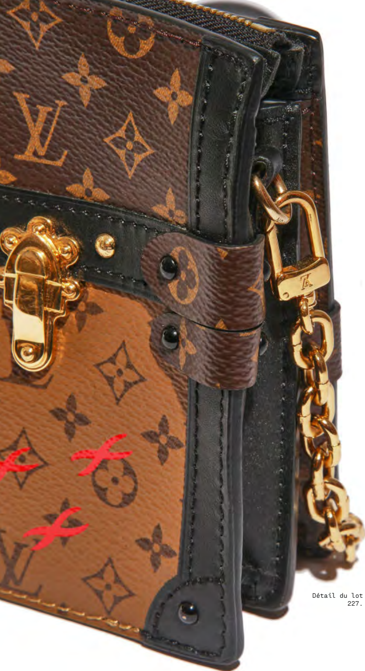
Détail du lot 227.