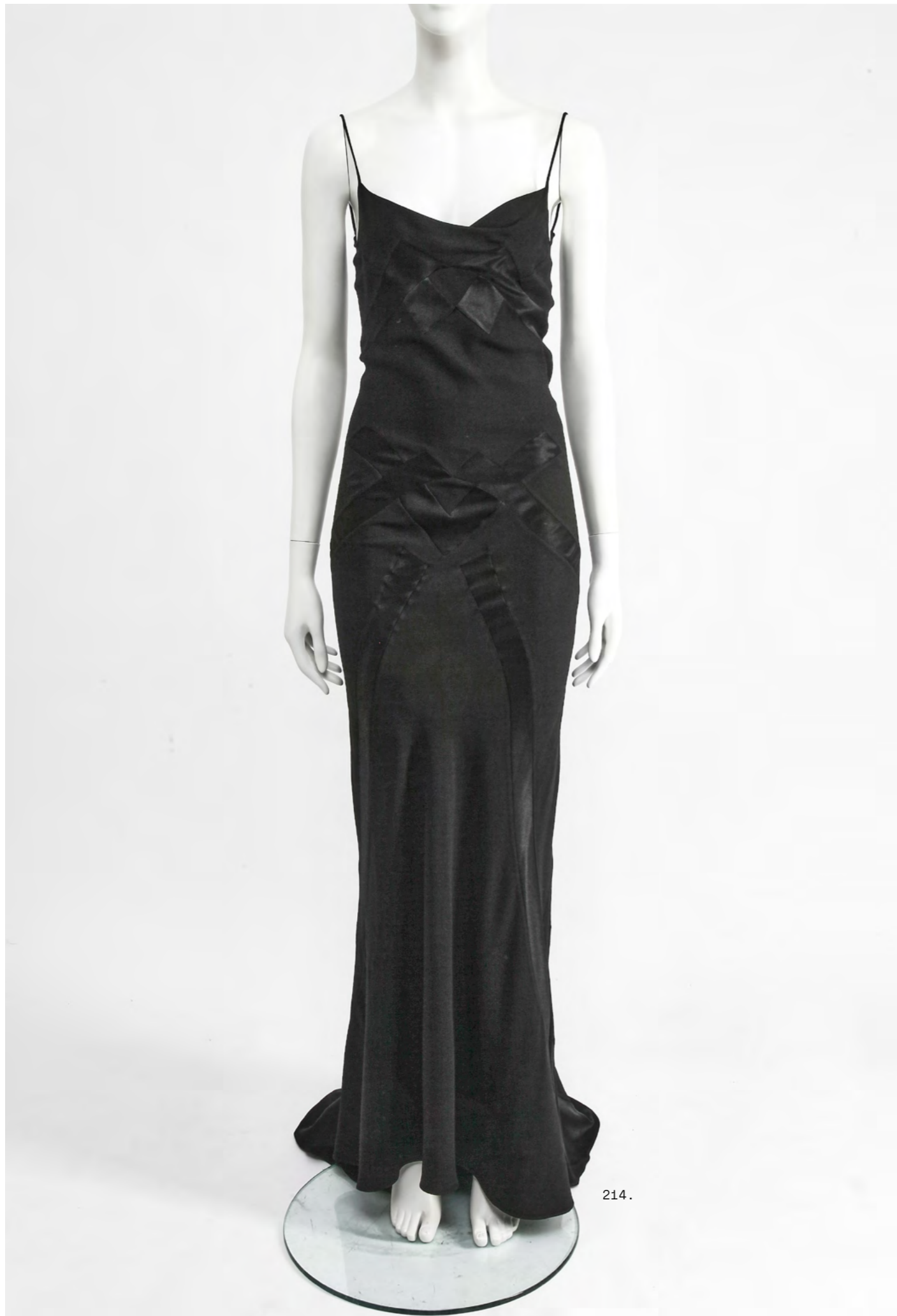
214. JOHN GALLIANO Une robe en crêpe de mousse noir, collection « Misia Diva (Pin Up) », Printemps-Eté 1995

A black moss crêpe dress, 'Misia Diva (Pin Up)' collection, Spring-Summer 1995 Paris label, size 36/4, the satin-backed crêpe inset with intersecting panels of the fabric in reverse creating a satin ribbon effect on the exterior, with spaghetti straps, cowl neckline, trained hem, bust 85cm 34in