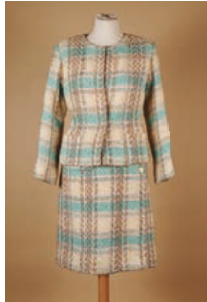
92 CHANEL Boutique Tailleur en mohair et laine tissés façon tweed pastel, courte veste, crochets, deux poches plaquées, jupe à pan boutonné, rappel sur la poche, doublure en satin de soie, boutons en métal doré (env T 38)