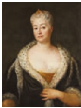
196 Attribué à Antoine PESNE (1683-1757) Portrait de dame au manteau bordé d'hermine, peut-être une princesse de Prusse (?) Toile Hauteur : 75 cm - Largeur : 60 cm Restaurations anciennes 800/1 200 €