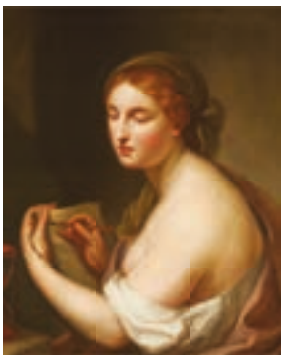
195 Ecole Romaine vers 1800, suiveur de Raphaël-Anton Mengs Allégorie du dessin Toile Hauteur : 73 cm - Largeur : 60 cm Restaurations anciennes 1 500/2 000 €