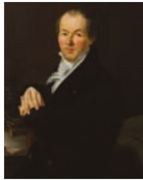
199 Ecole Anglaise du XIXe siècle Portrait d'un Lord Anglais à son bureau Huile sur toile Hauteur : 81,5 cm - Largeur : 65,5 cm Rentoilage 400/600 €