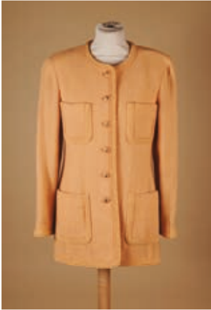
88 CHANEL Boutique début 1990 Veste en laine tissée abricot, quatre poches plaquées, simple boutonnage en bakélite strié (env T 38/40) (mini fil tiré)