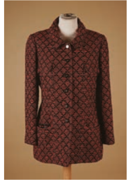
90 CHANEL Boutique (collection Automne-hiver 1995) Veste en laine et mohair mélangés tissée figurant un quadrillage rouge et noir, simple boutonnage, quatre poches à rabat (T 42 vintage, taille petit) (nombreux fils tirés)