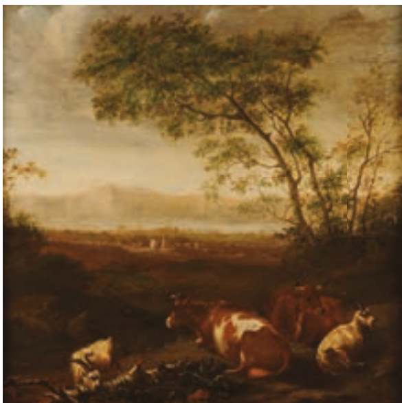
193 École HOLLANDAISE du XVIII e , entourage d'Abraham Begeyn Troupeau au repos Panneau de chêne parqueté Hauteur : 47 cm - Largeur : 44 cm Restaurations anciennes