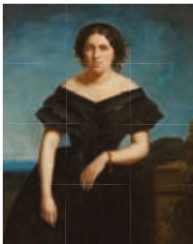
201 Ecole du XIXe siècle Portrait d'une élégante en robe noire Huile sur toile Hauteur : 116 cm - Largeur : 89 cm 300/500 €