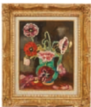
167 Louis VALTAT (1869-1952) Anémones dans un pichet vert Huile sur toile. Signée en bas à gauche. 36,5 x 29 cm Provenance : Collection particulière