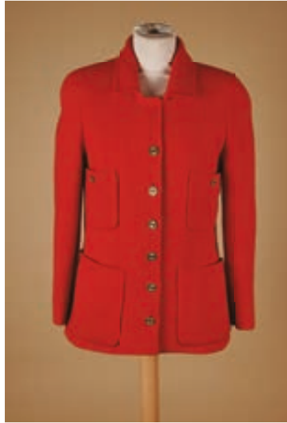
89 CHANEL Boutique début 1990 Veste en laine tissée coquelicot, quatre poches, boutonnage CC en métal doré (env T 38) (déchirure au centre de la doublure sur 8 cm, griffe recousue)