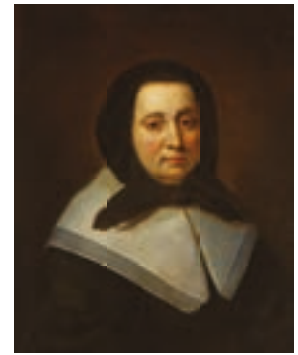
200 Ecole Française du XVIIe siècle Portrait de dame au foulard Toile Hauteur : 68 cm - Largeur : 56 cm Restaurations anciennes 700/1 000 €