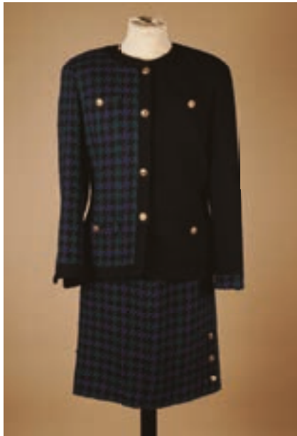
91 CHANEL Boutique début 1990 Tailleur en lainage tissé noir et dans les tons violet et vert, boutons CC en métal doré, veste à encolure ronde, quatre poches plaquées, jupe droite (env T 38) (petites bouloches, mini fils tirés)