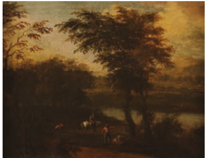
192 École HOLLANDAISE vers 1700 Cavalier près d'une rivière Toile Cadre : En bois sculpté doré du XVII e recoupé Hauteur : 34 cm - Largeur : 43 cm Porte une signature et une date en bas au centre J de(?) W?. Restaurations anciennes 600/800 €