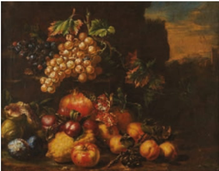
191 École ROMAINE de la seconde moitié du 17 e siècle Nature morte aux raisins, grenade, pommes, cédrat et figes Toile et châssis d'origine Hauteur : 49 cm - Largeur : 66 cm On perçoit ici l'influence d'Abraham Brueghel qui a fait basculer la nature morte italienne vers des compositions plus exubérantes et baroques.