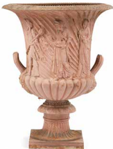
171 Importante vase de de jardin de forme Médicis en fonte de fer peint à décor en bas-relief d'une procession de vestales dans le goût de l'antique, sur fond de cannelures torsées. Anses et masques de vieillards sur les côtés. Base carrée. H. : 81 - D. : 66 cm. 200/300 €

Louis-Magdelaine PLUVINET fut reçu maître menuisier à Paris le 19 avril 1775.