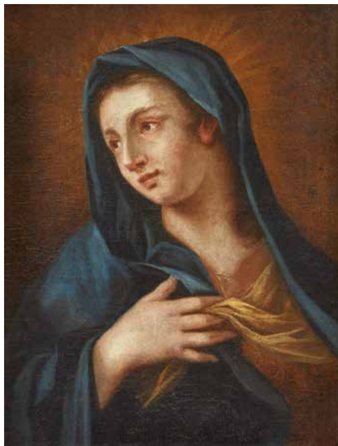
7 Ecole ITALIENNE du XVIII e Vierge en buste. Toile. 56 x 43 cm. Restaurations anciennes. 600/800 €