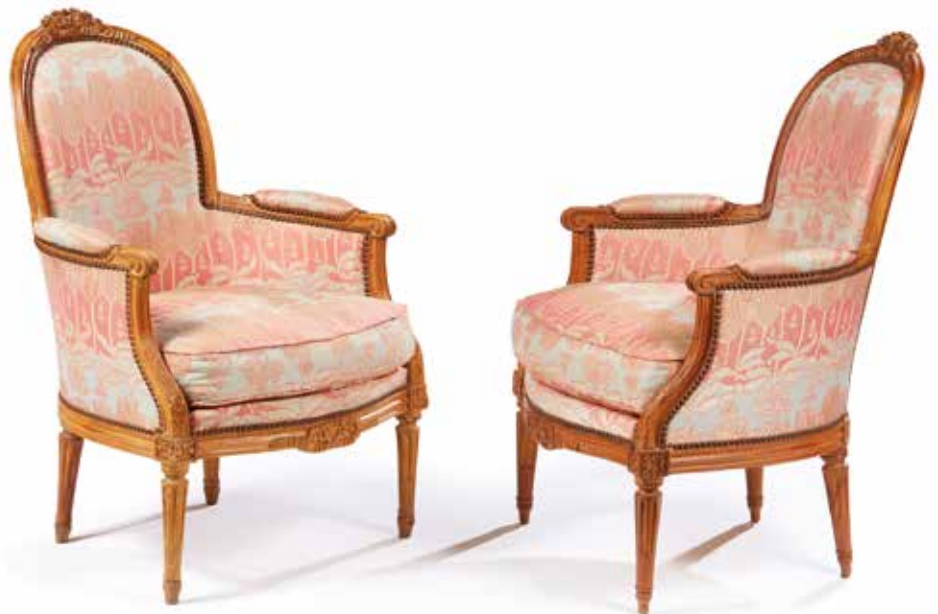
170 Paire de bergères à dossier enveloppant en hêtre mouluré et sculpté à décor d'un nœud de ruban sur le dossier. Pieds fuselés à cannelures rudentées. Estampillées PLUVINET. Epoque Louis XVI. (Accidents). H. : 99 cm. 400/600 €

Louis-Magdelaine PLUVINET fut reçu maître menuisier à Paris le 19 avril 1775.