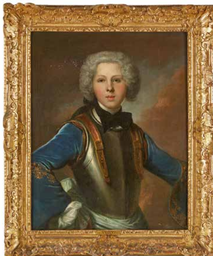
9 Ecole FRANÇAISE du XVIII e , entourage de NATTIER Portrait de jeune homme en armure. Toile. 79 x 62,5 cm. Restaurations anciennes et manques. 3 000/4 000 €

Notre tableau est très proche du Portrait de Lady Mary Herbert par François de Troy, peint vers 1697-1700 (Grande Bretagne, collection particulière ; catalogue de l'exposition François de Troy, Toulouse, musée Paul Dupuy, 1997, Somogy, Edition d'art, 1997, page 53). On y retrouve la même servante qui tend une toque dans le tableau anglais et une couronne de fleurs dans le nôtre. Les deux modèles sont coiffées à la Fontange.