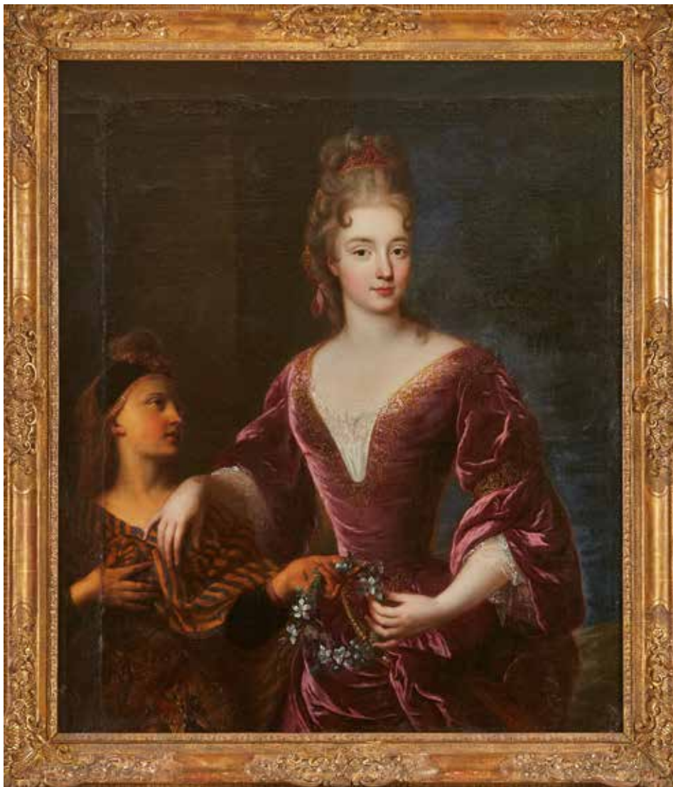
8 François de TROY (1645-1730) Portrait de femme à la robe rouge et la couronne de fleurs accompagnée d'un jeune page. Toile, agrandie en haut et à gauche. 114 x 96 cm. Restaurations anciennes. 8 000/10 000 €