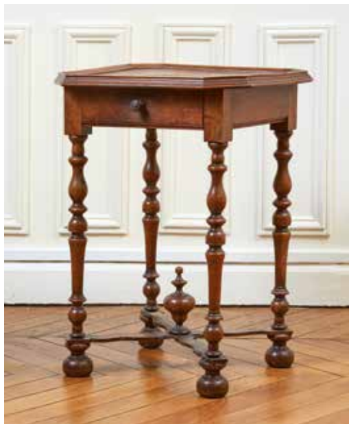
136 Petite table à pans coupés en noyer ouvrant par un tiroir en ceinture et reposant sur des pieds tournés en balustre réunis par une entretoise en « X ». Epoque XVII e siècle. (Restaurations). H. : 67 cm. - L. : 50 cm. - P. : 43 cm. 200/300 €