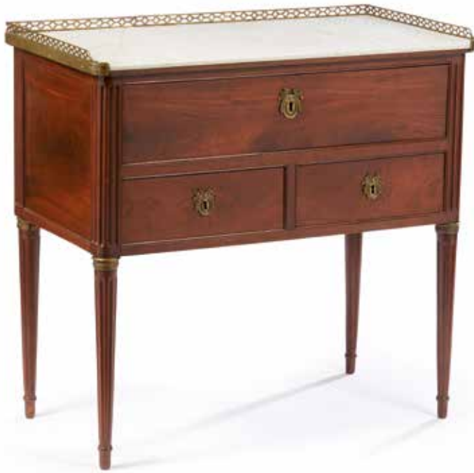
169 Petite commode en acajou et placage d'acajou finement mouluré, ouvrant par trois tiroirs sur deux rangs séparés par une traverse. Les montants arrondis à cannelures reposent sur des pieds fuselés et cannelés. Plateau de marbre blanc encastré à galerie. Epoque Louis XVI. H. : 90 - L. : 92, 5 - P. : 48 cm. 600/800 €