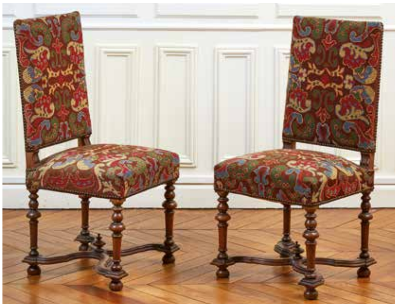
137 Paire de chaises à dossier plat en noyer, le piétement tourné en balustre est réuni par une entretoise en « X ». Style Louis XIII. H. : 98 - L. : 47 - P. : 48 cm. 80/100 €