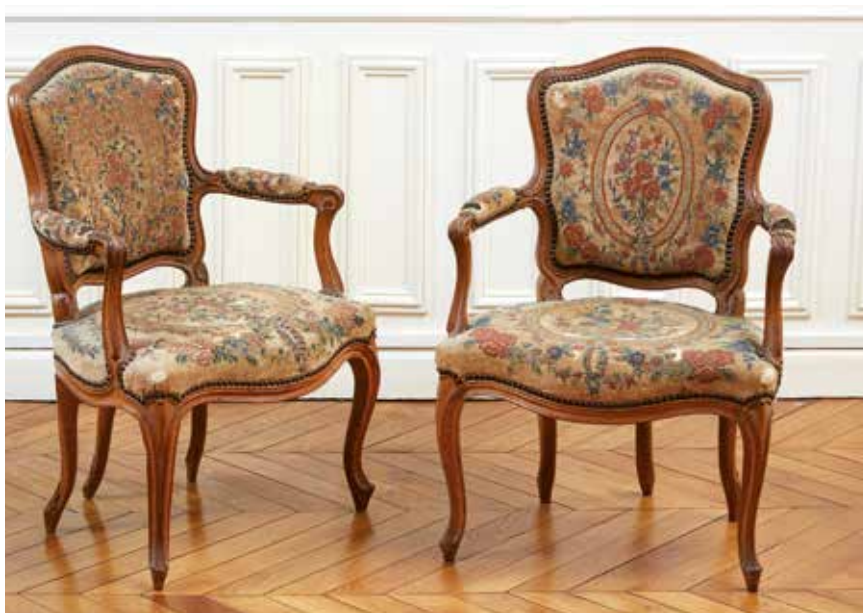
153 Paire de rares fauteuils à cinq pieds à dossier épaulé en cabriolet en hêtre mouluré. Les consoles d'accotoirs en coup de fouet reposent sur des pieds cambrés se terminant par des bouchons coniques. Estampillés I. NADAL. Epoque Louis XV. (Anciennement laqués, probables transformations). Garniture ancienne au petit point. H. : 88 - L. : 62 - P. : 60 cm. 800/1 000 €

Jean Nadal est le plus ancien d'une famille de menuisiers parisiens. On ignore la date de l'obtention de sa maîtrise. Il était établi rue de Cléry et d'après certaines sources, il exerçait encore son activité les dernières années du règne de Louis XV.