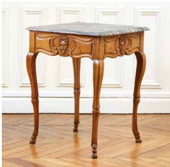
152 Table d'appoint carrée en bois fruitier mouluré et sculpté à décor en ceinture d'un masque de satyre dans un cartouche. Pieds cambrés terminés par des sabots de biche. Plateau de marbre gris veiné à bec de corbin. Travail provincial en partie du XVIII e siècle. H : 70 - L : 54 - P : 53 cm. 150/200 €