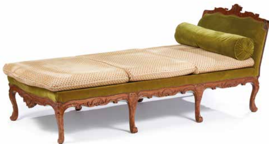
138 Lit de repos en noyer finement sculpté à décor de coquilles parmi des feuillages et croisillons. Il repose sur huit pieds cambrés se terminant en enroulement. Style Régence. (Un pied accidenté). H. : 87 cm. L. : 200 cm. P. : 89 cm. 300/500 €