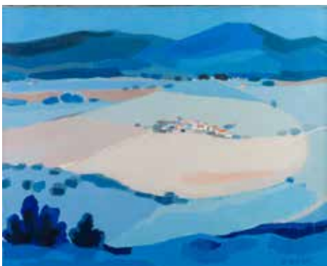
196 Pierre ROUX 1932 «Provence» HST, SBD, 54x65cm 800/1000 €