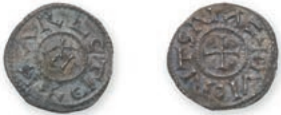
114 CARLOMAN (879-884). Denier. Autun. (Dep. 94). 1,76 g. Très Beau. Rare. 800 / 1 000 €