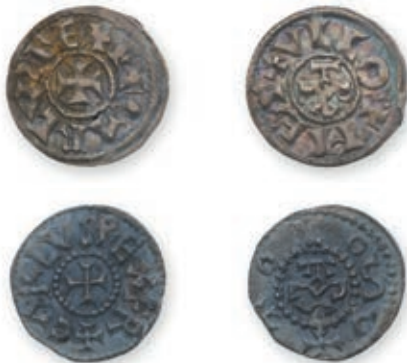
107 CHARLES LE CHAUVÉ. Deniers. Melle . Type immobilisé. (Dep. 627 var.). Toulouse. (Dep. 1001 var.). 1,60 g. 1,52 g. Ens 2 p. Presque Très Beau. 300 / 400 €