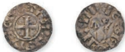
125 HENRI 1er (1031-1060). Ateliers du domaine royal. Denier . Paris. (Ciani 33). 1,17 g. Très Beau. Un peu rare. 500 / 600 €