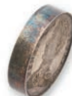
132 HENRI V PRETENDANT. Piéfort de 1 franc. 1832. (G. 451P). 21,57 g. 700 / 900 €