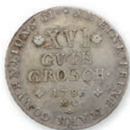
137 ALLEMAGNE. Brunswick Lunebourg. Karl Wilhelm Ferdinand (1780- 1806). 16 Gute Groschen. 1785. (KM 867). RUSSIE. ANNE (1730-1740). Rouble. 1734. (Davenport 1673) Coup sur la tranche. Ens. 2 p. Très Beau. 300 / 400 €