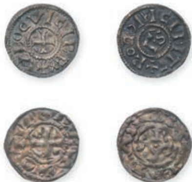
121 LOUIS IV D'OUTREMER (936-954). Denier . Rouen. (Dep. -, Prou 930-931). OTTO 1er (936-973). Denier . (Dannenberg 1153). 1,54 g. 1,35 g. Ens. 2 p. Très Beau. 300 / 400 €