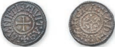
106 CHARLES LE CHAUVÉ. Denier. Nantes (Dep. 683). 1,71 g. Très Beau. 600 / 800 €