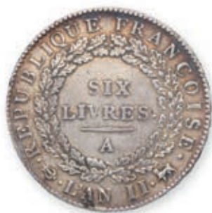
129 CONVENTION (1792-1795). Ecu de 6 livres. Paris. An II. 1793. (G. 58). Très Beau. 200 / 300 €