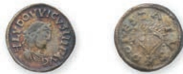
100 LOUIS LE PIEUX. Denier au bateau . Dorestad . (Dep. 413 (42 ex.)). 1,54 g. Presque Très Beau. Rare. 800 / 1 200 €