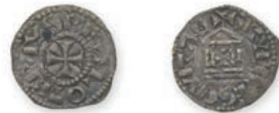
112 LOUIS III (879-882). Denier. Tours. (Dep. 1041). LOTHAIRE (954-986). Denier. Bourges. (Dep. 206). 1,69 g. 1,22 g. Ens. 2 p. Presque Très Beau. 500 / 600 €