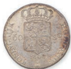
139 PAYS-BAS. LOUIS NAPOLEON (1806-1810). 50 stuivers. 1808. (KM 28). Superbe. 300 / 400 €