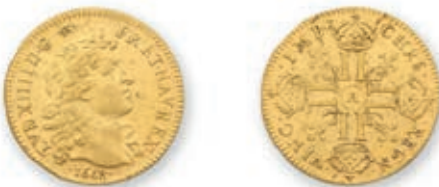
212 LOUIS XIV (1643-1715). Louis juvénile tête nue . Paris . 1668. (Dr. 232, Dy. 1428). Or. 6,75 g. Légers coups sur la tranche sinon Très Beau. 400 / 500 €