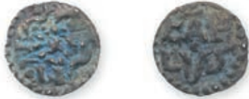
96 CHARLEMAGNE. Denier . Tours ? (voir Dep. 1031). 1,13 g. Très Beau. 600 / 900 €