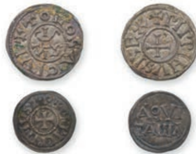
104 PEPIN I (817-838). Obole . Bourges (Dep. 184). PEPIN II (839-865). Denier . Toulouse . (Dep. 999 var.). 0,77 g, 1,57 g. Ens. 2 p. Très Beau. 400 / 500 €