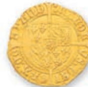
84 BELGIQUE . Flandres. Charles le Téméraire (1467-1477). Florin de Bourgogne . n.d. (1474-1477). Saint André debout tenant sa croix devant lui. R/ Ecu de Bourgogne sur une longue croix pattée. (VG&H 32-3). 3,35 g. Presque Très Beau. 700 / 900 €