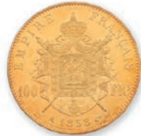
77 NAPOLEON III (1852-1870). 100 francs tête nue . Paris . 1858. (G. 1135). Traces de monture sinon Très Beau. 1 200 / 1 300 €