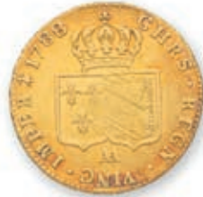
75 LOUIS XVI (1774-1792). Double louis à la tête nue . Metz . 1788. (Dr. 802). 15,20 g. Raies . Presque Très Beau. 800 / 1 000 €