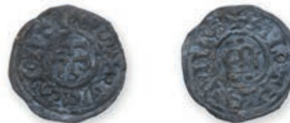
111 Italie LEON IV (847-855) LOTHAIRE. Denier. Rome. (Berman 26). 1,18 g. Fentes. TB. 200 / 300 €