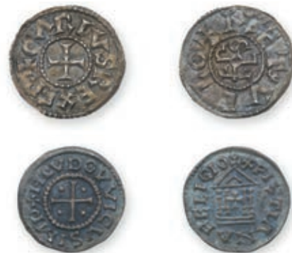
103 LOUIS LE PIEUX. Denier . Type immobilisé. (Dep. 1179 var.) CHARLES LE CHAUVE. Denier immobilisé . Melle . (Dep. 627). 1,53 g, 1,57 g. Ens. 2 p. Presque Très Beau. 200 / 300 €