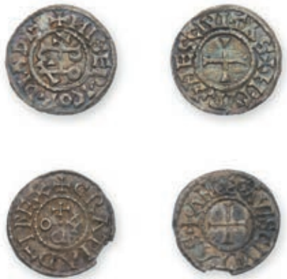
116 EUDES (887-898). Deniers (2). Angers (Dep. 44) (ébréché). Tours (Dep. 1043). 1,72 g. 1,60 g. Ens. 2 p. Très Beau. 300 / 400 €