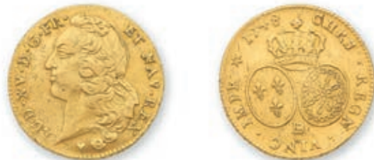
213 LOUIS XV (1715-1774). Double louis au bandeau . Strasbourg . 1748. (Dy. 1642, Dr. 542). Or. 16,10 g. Tranche irrégulière sinon Très Beau. 1 200 / 1 500 €