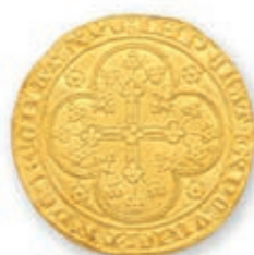
82 BELGIQUE . Flandres. Louis de Male (1346-1384). Chaise d'or au lion . Le comte assis sur un trône gothique, tenant l'écu au lion. R./ Croix fleuronée dans un quadrilobe. (Del. 466, Fr. 163). 4,45 g. Très Beau. 1 000 / 1 200 €