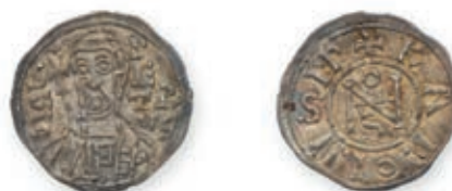
124 Italie. JEAN VIII (872-882). Denier . Rome. (Berman 36). 1,43 g. Très Beau à Superbe. 600 / 800 €