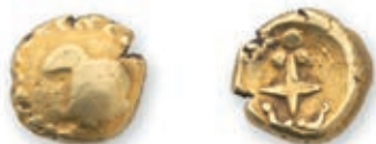
1 Germanie. Vindelici. Statère regenbogenschüsselchen. (150-50 av. J-C.). Tête d'oiseau à g. entourée d'une couronne de lauriers. R./ Anépigraphie. Croisette au centre, trois globules en triangle au-dessus, accostée de deux S. (LT 9436-9437, Kellner type II.E). 7,83 g. Presque Très Beau. 1 200 / 1 500 €