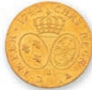
73 LOUIS XV. Louis au bandeau . Lille . 1742. (Dr. 728). 8,10 g. Traces de monture sinon Presque Très Beau à Très Beau. 500 / 700 €