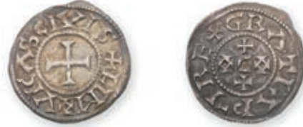
109 CHARLES LE CHAUVÉ. Denier. Bourges. (Dep. 198 var.) EUDES (887- 898). Denier. Limoges. (Dep. 511). 1,76 g. 1,72 g. Ens. 2 p. Très Beau. 400 / 500 €