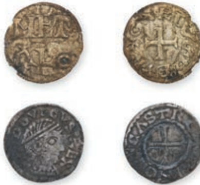
118 CHARLES LE SIMPLE (898-929). Denier. Melle. (Dep. 629 var.) LOUIS IV D'OUTREMER. Denier. Chinon. (Dep. 318). Très rare. 0,92 g. 1,55 g. Ens. 2 p. TB et Très Beau. 300 / 400 €