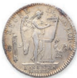
128 LOUIS XVI (1774-1792). Ecu de 6 livres Français. Paris. 1792. (G. 55). Très Beau. 200 / 300 €