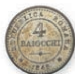
136 Corse. PASCAL PAOLI (1761/1768). 4 soldi. 1760. (KM 7). 4 baiocchi. Arg. Br. Ens. 2 p. Presque Très Beau. 200 / 300 €