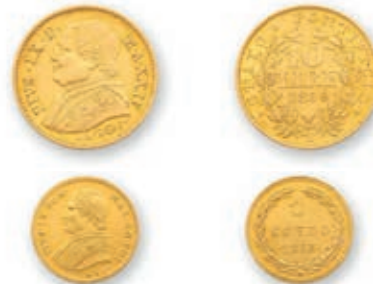
216 VATICAN . PIE IX (1846-1878). 10 lire . 1869. (Fr. 281). Scudo . 1853. (Fr. 275). ( légers coups ). Or. Ens. 2 p. Très Beau. 200 / 300 €