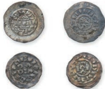
119 HUGUES d'Arles, roi d'Italie, et LOTHAIRE II (931-947). Denier. Pavie. (Dep. -). BERENGER de Frioul, roi d'Italie (888-915) ? Denier au temple. Ens. 2 p. 1,59 g. 1,11 g. TB et Très Beau. 500 / 600 €