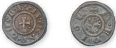
95 CHARLEMAGNE. Denier . Milan . (Prou 905). 1,72 g. Très Beau. 700 / 800 €