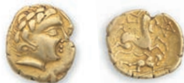
6 Aulerques Cénomans. Statère. (II e s. av. J-C.). Tête à d. R./ Cheval androcéphale à d., conduit par un aurige. Sous le cheval, personnage allongé tenant une lance et un poignard. (DT 2150, LT 6852). 7,37 g. Très Beau. Joli style. 2 500 / 3 000 €