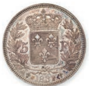
131 HENRI V PRETENDANT (1820-1883). 5 francs. 1831. (G. 651). Très Beau. 150 / 200 €