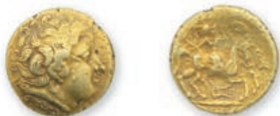
5 Groupe de Normandie ou Rediones ? Statère. (III e s.- II e s. av. J-C.). Tête à la chevelure très élaborée. R./ Cavalière armée sur un cheval ; dessous, lyre horizontale à d. (DT -, LT -). 8,07 g. TB à Très Beau. 1 500 / 2 000 €