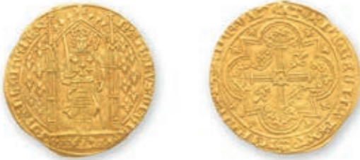
209 CHARLES V (1364-1380). Franc à pied . Le roi debout sous un dais, tenant l'épée et la main de justice. R./ Dans un quadrilobe anglé, croix fleuronnée, portant en cœur un quadrilobe centré d'un point, cantonnée de deux lis et de deux couronnelles. (Dy. 360, L. 371). Or. 3,77 g. Traces de monture sinon Très Beau. 350 / 450 €