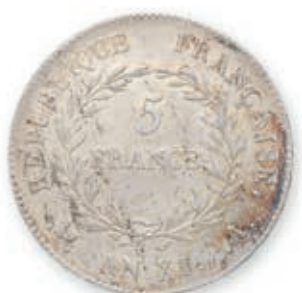
130 CONSULAT (1799-1804). 5 francs Bonaparte Premier Consul. Paris. An XI. (G. 577). Très Beau. 200 / 300 €