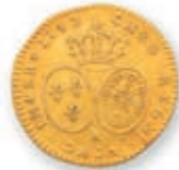
74 LOUIS XV. 1/2 louis au bandeau . Paris . 1743. (Dr. 736). 4,05 g. Presque Très Beau. 200 / 300 €