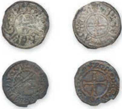
113 LOUIS III. Denier. Tours. (Dep. 1041). LOUIS IV D'OUTREMER (936-954). Denier. Chinon. (Dep. 318). Rare. 1,39 g. 1,15 g. Ens. 2 p. Presque Très Beau. 500 / 700 €