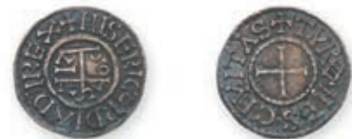
120 LOUIS III (879-882). Denier. Tours. (Dep. 1041). 1,78 g. Très Beau. 200 / 300 €