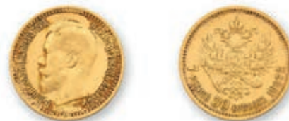
215 RUSSIE . NICOLAS II (1894-1917). 7 ½ roubles . ( Faux d'époque ). 1897. Or. Presque Très Beau/Très Beau. 250 / 350 €