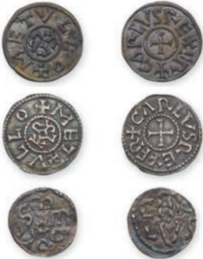
97 CHARLEMAGNE. Obole . Melle . (voir Dep. 605). CHARLEMAGNE ou CHARLES LE CHAUVE (840-875). Denier . Melle . (Dep. 606). CHARLES LE CHAUVE. Denier immobilisé . Melle . (Dep. 627). 0,86 g, 1,60 g, 1,76 g. Ens. 3 p. Très Beau. 800 / 1 000 €