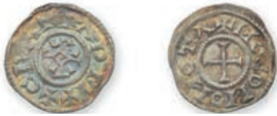
105 CHARLES LE CHAUVÉ (840-875). Denier. Mouzon (Dep. 670). 1,74 g. Presque Très Beau. Un peu rare. 500 / 600 €