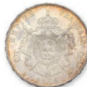
134 NAPOLEON III (1852-1870). 5 francs tête nue. Paris. 1855. (G. 734). Superbe. 150 / 250 €