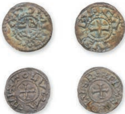
108 CHARLES LE CHAUVÉ. Deniers. Toulouse. (Dep. 1002 var.). Clermont- Ferrand. (Dep. 334). 1,35 g. 1,64 g. Ens 2 p. Très Beau. 300 / 400 €