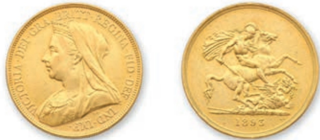
214 GRANDE-BRETAGNE . VICTORIA (1837-1901). 5 livres . 1893. (Fr. 394). Or. Importante trace de soudure sur la tranche . TB. 1 800 / 2 200 €