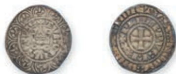
126 PHILIPPE IV (1285-1314). Maille . (Lafaurie 221). 1,29 g. Très Beau. 100 / 150 €