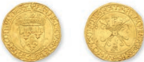
211 FRANCOIS I er (1515-1547). Ecu d'or au soleil . 2 e t. Lyon . (Dy. 771). 3,38 g. Légère trace de pli sinon Très Beau. 300 / 400 €