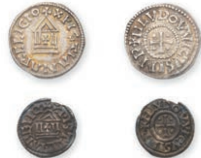
102 LOUIS LE PIEUX. Denier . Type immobilisé. (Dep. 1179). Obole . Type immobilisé. (Dep. 1180). 1,70 g, 0,76 g. Ens. 2 p. Très Beau. 500 / 600 €