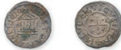
101 LOUIS LE PIEUX. Denier . Type immobilisé. (Dep. 1179). 1,61 g. Très Beau. 200 / 300 €