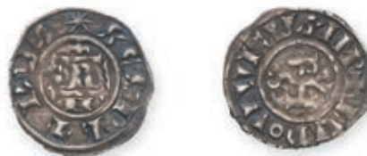
122 Italie. GREGOIRE IV (827-844). Denier . Rome. (Berman 21). 1,71 g. Très Beau. 200 / 300 €