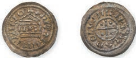
115 CHARLES LE CHAUVÉ, empereur (875-877). Grand denier. At. non précisé (Milan). (MEC 1, 1009). 1,72 g. Presque Superbe. Rare. 400 / 500 €