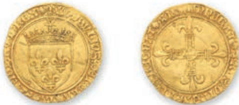
210 LOUIS XII (1498-1514). Ecu d'or au soleil . Dijon . (L. 592, Dy. 647). 3,38 g. Presque Très Beau/Très Beau. 250 / 350 €