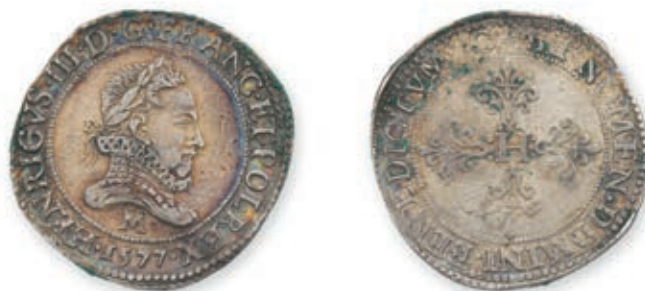
127 Henri III. Franc d'argent . Toulouse. 1577. (Dy.1130A). HENRI IV. \frac{1}{4} d'écu. 1 er t. Nantes. 1607. (Dy. 1222). Ens. 2 p. Presque Très Beau. 200 / 300 €