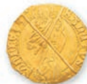
83 BELGIQUE . Brabant. Philippe le Bon. (1430-1467). Lion d'or . Malines . Lion assis à g. sous un dais gothique, entre deux briquets. R./ Ecu de Bourgogne sur une croix fleuronée. (Del. 65, Fr. 29). 4,20 g. A été monté . TB. 400 / 500 €