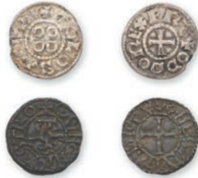
117 EUDES. Denier. Toulouse (Dep. 1012). CHARLES LE SIMPLE (898-929). Denier. Chinon et Tours. (Dep. 321). 1,49 g. 1,68 g. Ens. 2 p. Presque Très Beau. 500 / 600 €