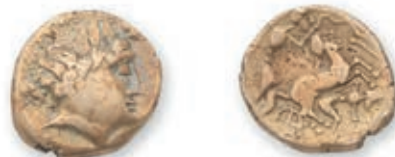
9 Andécaves. Statère. (I er s. av. J-C.). Profil apollinien à d. ; deux cordons perlés en forme de demi-cercles, partent du sommet de la tête. Motif en aigrette surmontant le tout. R./ Cheval androcéphale à d. surmontant un personnage ailé, accroupi. (DT 2174-2175, LT 6527). 7,12 g. TB à Très Beau. 800 / 1 000 €