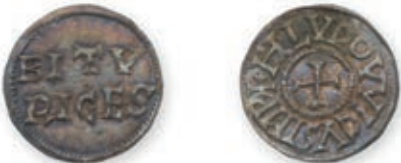
98 LOUIS LE PIEUX (814-840). Denier . Bourges . (Dep. 177). 1,77 g. Très Beau. 400 / 500 €