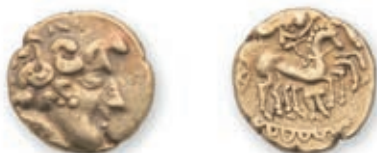
3 Carnutes. Statère à la joue ornée et à la lyre. (II e s. et début du I er s. av. J-C.). Tête laurée à d., trois perles en triangle sous l'oreille. R./ Bige à d. conduit par un aurige, dessous, lyre inversée. (DT 2525, LT 5951 var.). 7,25 g. Très Beau. Portrait de caractère. 2 000 / 2 500 €