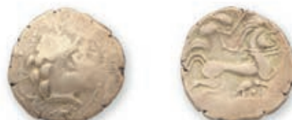
10 Namnètes. Statère d'électrum du type à l'hippophore et à la croix. Tête à d. entourée de cordons perlés terminés par de petites têtes. Devant le front, une croix. R./ Cheval androcéphale à d. ; au-dessous, un personnage tenant les jambes du cheval. (DT 2181, LT 6723). 6,98 g. TB. 500 / 800 €