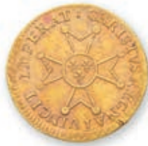
72 LOUIS XV (1715-1774). Louis de Malte . La Rochelle . 1718. (Dr. 723). 9,79 g. Coup sur la tranche sinon Presque Très Beau. 1 200 / 1 500 €