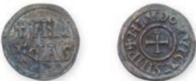
99 LOUIS LE PIEUX. Denier . Venise . (Dep. 1116 D). 1,40 g. Très Beau. 400 / 500 €