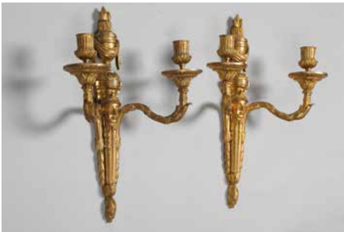
142. Paire d'appliques en bronze ciselé et doré à deux bras de lumière décor de feuilles d'acanthé et palmettes, fût cannelé à décor de têtes casquées surmonté d'un pot en feu. XIX ème siècle Hauteur fût : 41 cm 200/300 €