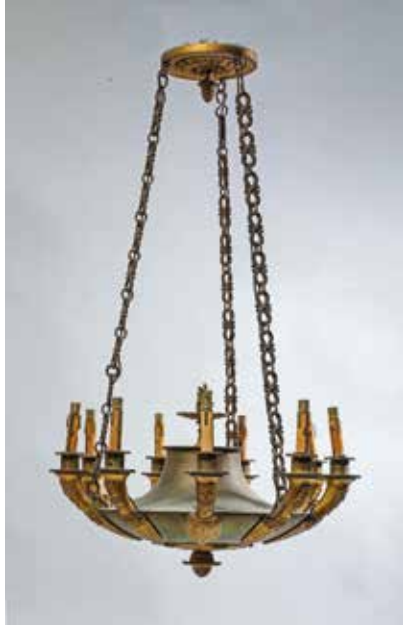
186. Suspension vasque en bronze doré et patiné à neuf bras de lumière à décor de mascarons et palmettes Style Restauration. Avec sa chaîne. Largeur : 43 cm 200/300€