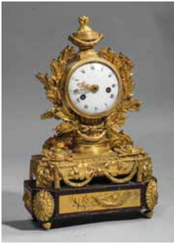
141. Pendule en bronze ciselé et doré surmontée d'une urne ; cadran en émail blanc entouré de feuilles de chêne asymétriques ; aiguilles fleurs de lys ; mouvement signé « Lage à Versailles » ; pieds toupie Époque Restauration. (Accident restauré à une feuille de chêne) Hauteur : 37,5 cm 400/600 €