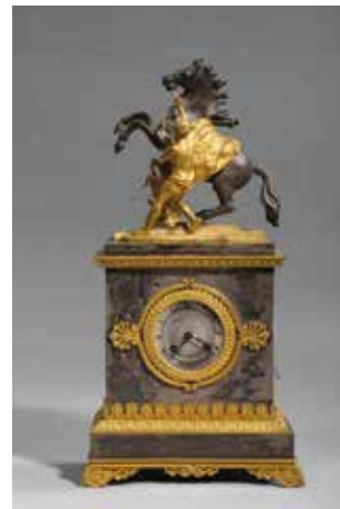
144. Pendule borne en bronze doré, patiné et métal représentant le cheval de Marly d'après Coustou ; cadran en métal guilloché indiquant les heures en chiffres romains entouré de palmettes, base soulignée de frises de palmettes, repose sur quatre pieds à enroulement feuillagé. Style Restauration Hauteur : 47 cm 150/300 €