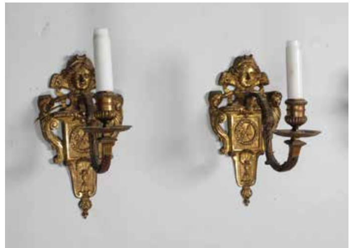
143. Paire d'appliques en bronze ciselé et doré à un bras de lumière; fût au décor de carquois et flèches dans une couronne de laurier ; épaulé de bustes de femme et surmonté d'un mascarone Style Régence Hauteur fût : 27 cm 200/300 €