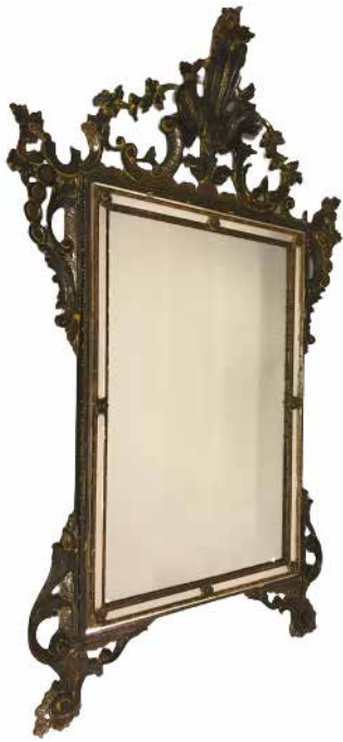
136. Miroir à pareclose en bois polychrome à décor rocaille Style Louis XV 150 x 90 cm (accidents et manques) 100/200€