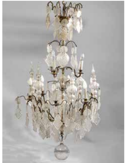
187. Grand lustre à pampilles à bras de lumières sur deux niveaux, monture en bronze ; pampilles en verre et cristal moulé dans le goût de Murano, avec ses poignards. Hauteur : 150 cm environ Largeur : 87 cm environ 500/1 000€