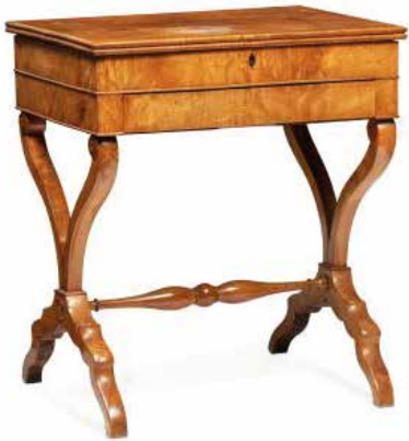
185. Table travailleuse en bois de placage XIX ème siècle 80/120€