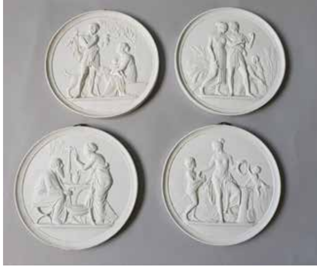
145. Ensemble de quatre médaillons en biscuit à décor de scène antique symbolisant les quatre saisons Travail du début du XX ème siècle dans le goût néo-classique, (probablement du Danemark). Trace aux trois traits bleu au dos. (Éclat, salissures) Diamètre 26 cm 500/800€