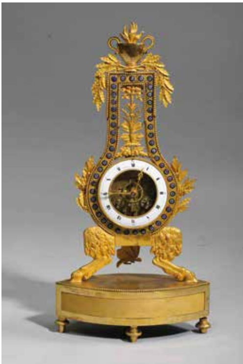
146. Pendule lyre en bronze doré et ciselé et décor émaillé surmontée d'une cassolette et flanquée de guirlande feuillagée, reposant sur des pieds biches. Cadran blanc émaillé signé CHOPIN à PARIS XIX ème siècle sur un socle (Restaurations) 2000/2500€