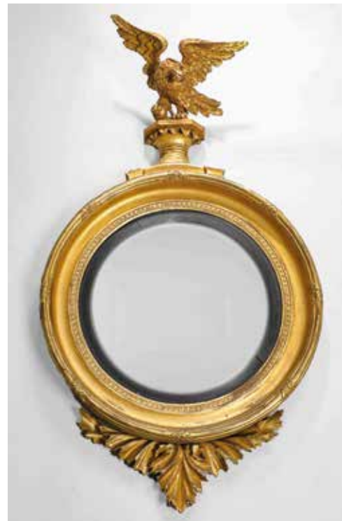
147. Grand cadre de glace en bois et stuc doré, décor de frise de feuilles d'eau, surmonté d'un aigle aux ailes déployées et terminé par un élément feuillagé. De style, travail du début du XX ème siècle ; glace moderne Hauteur 110 cm ; diamètre miroir 39 cm 200/300€