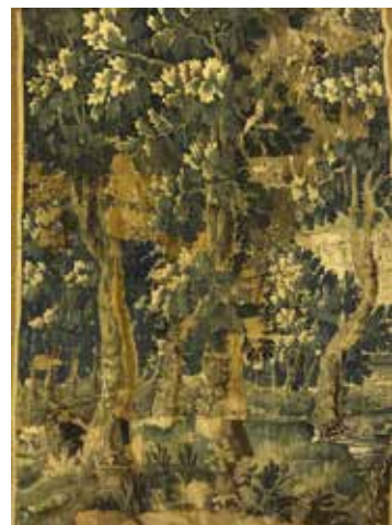
189. Tapisserie du XVIII ème siècle Verdure. 200 x 128 cm (accidents, manques et restaurations) 200/400€