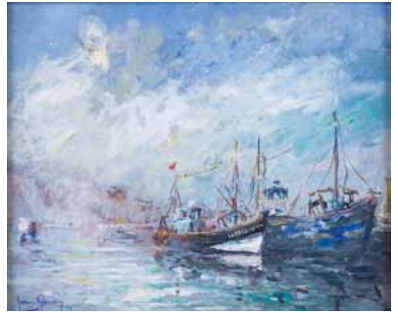
160 Henry GAUDIN «Bateau de pêche» SBG, 32x40cm 400/500 €