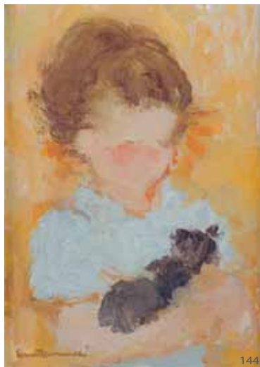
144 Ernest KOSMOWSKI «L'enfant au chat» HST, SBG, 33x24cm 800/1000 €