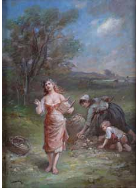
141 LANFANT DE METZ «La fourmi et la cigale» HST, SBG, 44,5x32,5cm 1500/2000 €