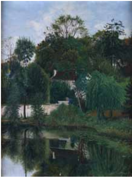
136 Jean ÈVE «Le petit étang de la Ronce à Ville d'Avray» HST, SBD, 61 x 46 cm 600/800 €