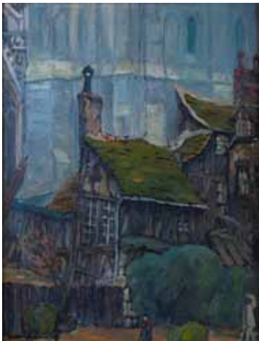
138 Jean Charles CONTEL «Quartier de Lisieux» HST, SBG, 50 x 64 cm 300/400 €