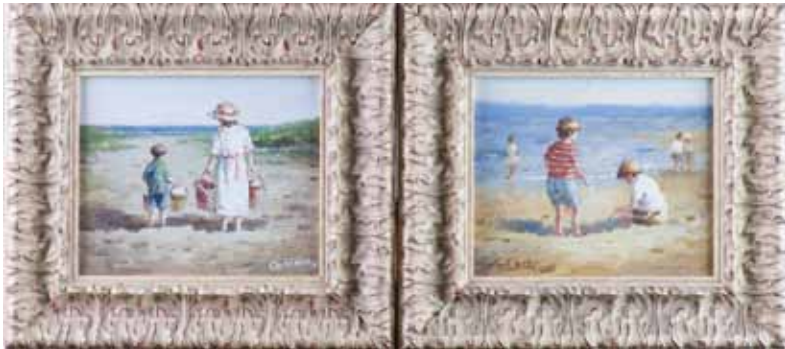
156 CRISTAUX «Enfants à la plage» suite de deux HST, SBG et SBD, 20,5x25,50cm 300/400 €