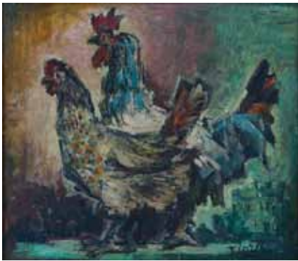
137 FLORES «Le coq et la poule» HSP, SBD, 38 x 43 cm 300/400 €