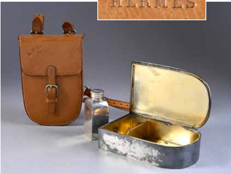
222. HERMÈS Petite sacoche pour les courses de chevaux en pécari contenant une boîte à sandwich et une flasque en métal argenté. L. : 15 cm 200 / 300 €