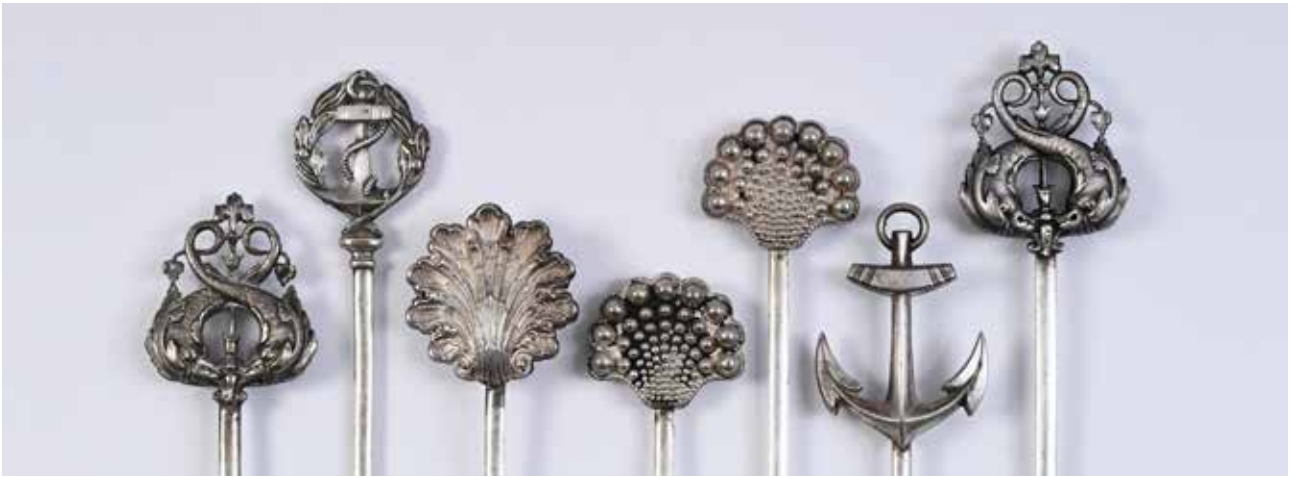
243. Lot de 7 attelets en argent 800° à décor ciselé et gravé de dauphins, trident et ancre. Fin XIXe - début XXe siècle. Poids : 193 g