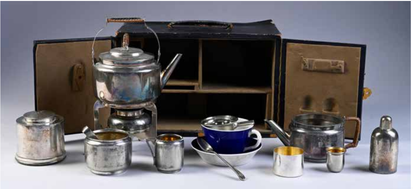
220. KENDALL & Cie, 17, rue de la Paix Paris Nécessaire à thé et café de voyage en métal argenté (manques quelques éléments) dans un coffret en cuir bleu marine. Vers 1900. 300 / 500 €