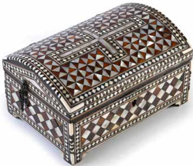
231. Rare coffret ottoman en marqueterie d'écailles et plaquettes de nacre à décor de losanges et d'une croix chrétienne sur le couvercle. L'intérieur gainé de velours rouge et découvrant deux scènes christiques, la naissance de Jésus et la crucifixion. Travail ottoman du XVIIIe siècle 21.7 x 11.6 x 15 cm. (Quelques petits accidents) 4 000 / 5 000 €