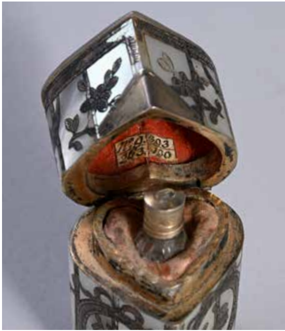
269. Etui à flacon de parfum , en forme de cœur, en nacre finement ciselée de trophées dans des médaillons. La monture en argent doré 800°. Milieu du XVIIIe siècle H. : 5.5 cm. (Quelques petits accidents) 600 / 800 €