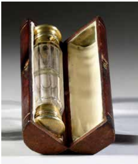
270. Flacon à parfum rond en verre taillé, le bouchon à vis en or, à bélière a charnière. H. : 6,6 cm Poids brut : 30 g Travail du début du XIXe siècle 160 / 180 €