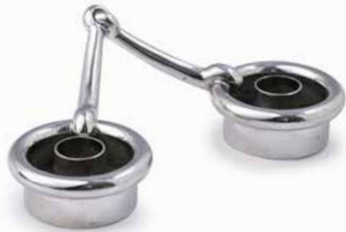
221. HERMÈS Paris Bougeoir double en métal argenté. La prise en forme de mors. Signé Hermès, Paris Made in France sous la base. L. : 11 cm 80 / 120 €