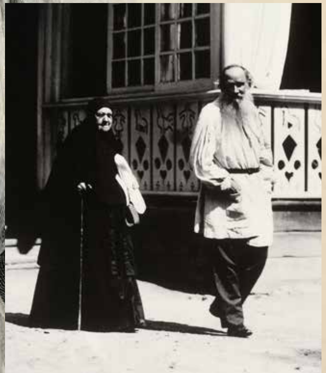
Le comte Léon Tolstoï et sa sœur Maria dans les jardins de la résidence de l'écrivain à Yasania Poliana, près de Moscou en 1908, portant la fameuse chemise.

Mais le plus émouvant des lots de cette vacation sera la chemise (blouse) ayant appartenu au plus célèbre des écrivains russes, Léon Tolstoï (1828-1910), porté le jour de sa mort et conservé depuis dans sa descendance directe (20/30 000 €) - 10. Cette chemise blouse, traditionnellement portée par les paysans russes, était un modèle spécialement créée et cousu par la femme de l'écrivain, Sofia.