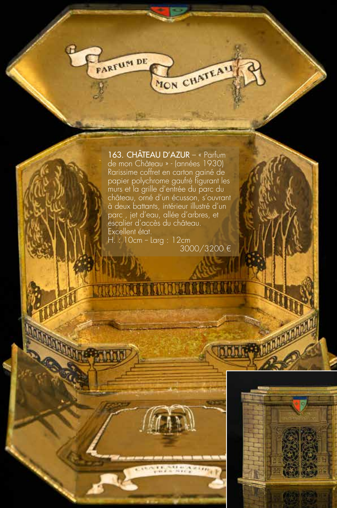
163. CHÂTEAU D'AZUR – « Parfum de mon Château » - (années 1930) Rarissime coffret en carton gainé de papier polychrome gaufré figurant les murs et la grille d'entrée du parc du château, orné d'un écusson, s'ouvrant à deux battants, intérieur illustré d'un parc, jet d'eau, allée d'arbres, et escalier d'accès du château. Excellent état. H. : 10cm - Larg : 12cm 3000/3200 €