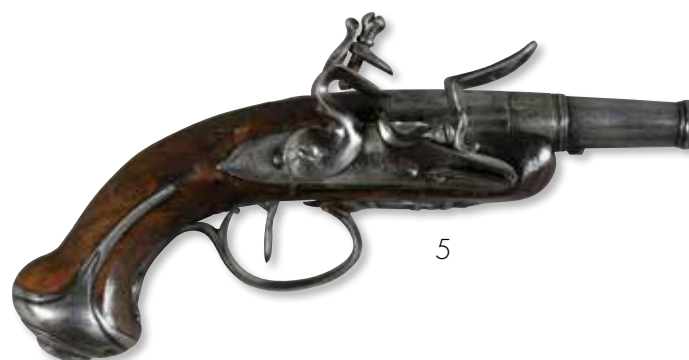
5 Pistolet de voyage à silex et à balle forcée , fût court, garnitures en fer découpé, crosse légèrement filigranée. Canon : 8 cm, longueur totale : 19 cm. Epoque XVIIIème siècle. 250 / 300 €