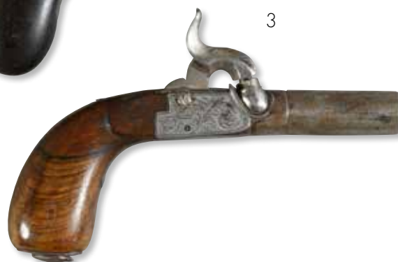
3 Lot comprenant : -Pistolet coup de poing à percussion à l'écossaise et à balle forcée, platine gravée. Longueur : 10 cm - Pistolet coup de poing à percussion à l'écossaise et à balle forcée, platine gravée, poinçon LEG, réserve dans la crosse. Longueur totale : 12 cm. 150 / 200 €