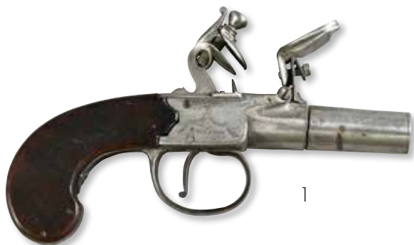
1 Pistolet coup de poing à silex et à l'écossaise , mécanique défectueuse, usures. Canon : 5,5 cm, longueur totale : 14,5 cm. Epoque XVIIIème siècle. 100 / 120 €